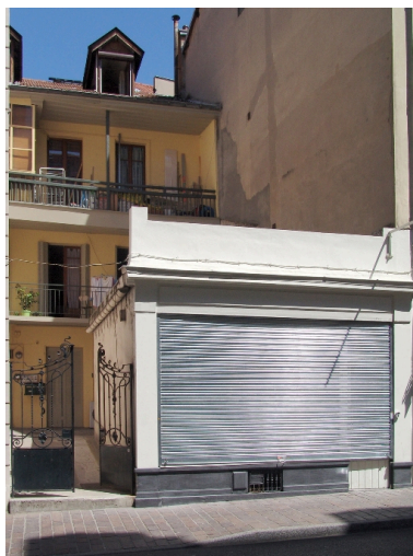
Vue générale IVR82_20067300400NUCA