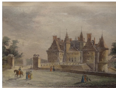
Détail IVR84_20216300500NUCA