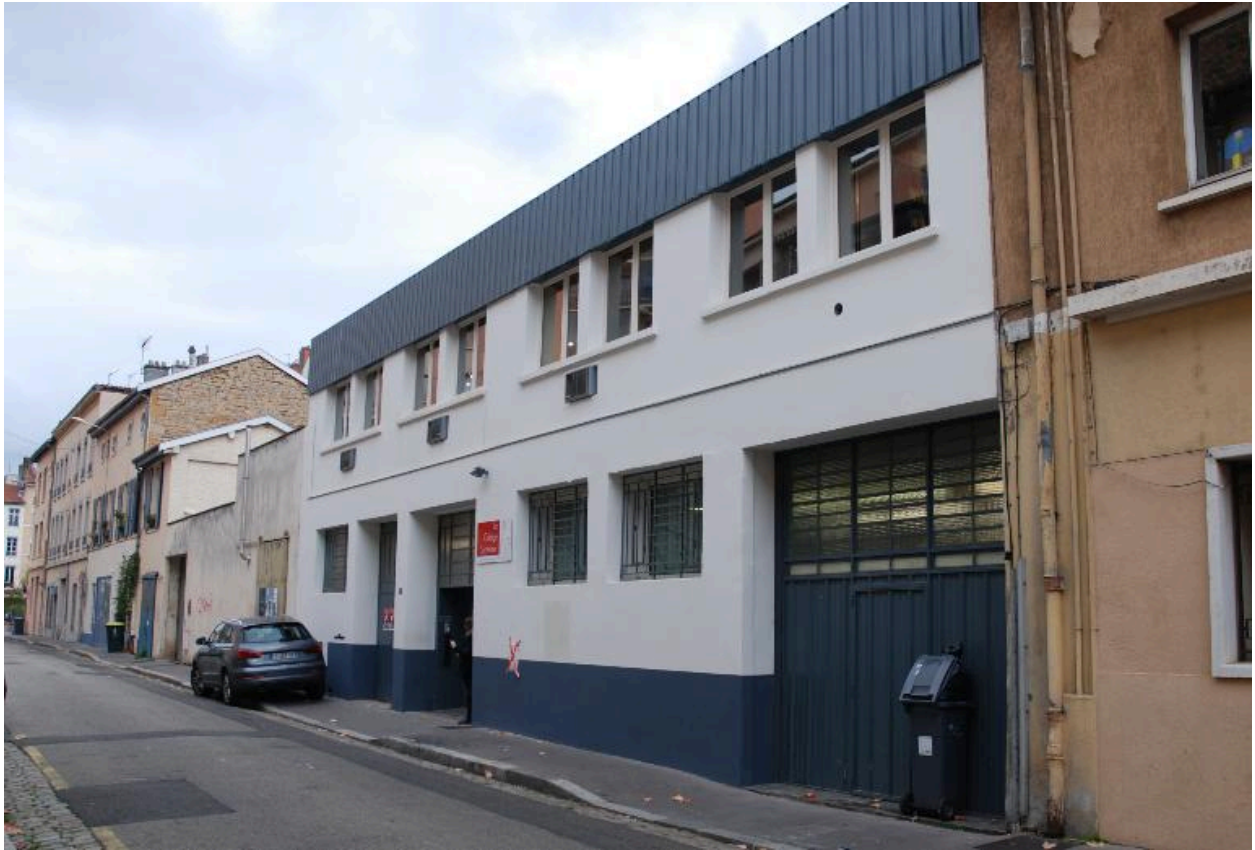
Vue de l'atelier transformé en centre de formation, sur la rue Mazagran