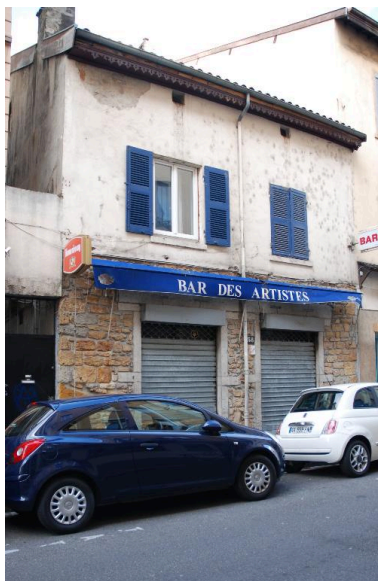
Vue de la maison, sur la rue Sébastien-Gryphe IVR84_20166901941NUCA