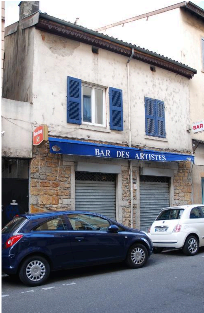
Vue de la maison, sur la rue Sébastien-Gryphe