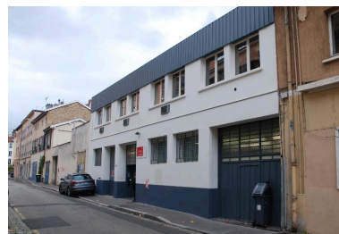
Vue de l'atelier transformé en centre de formation, sur la rue Mazagran