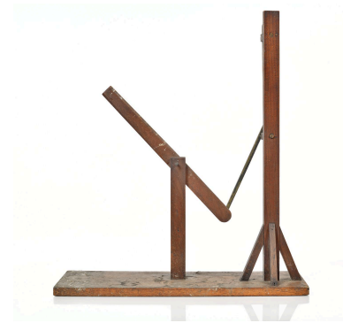
Transformation de mouvement vue 2 IVR84_20256901805NUCA