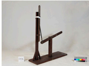
Modèle de transformation de mouvement vue de côté IVR84_20256900981NUCA