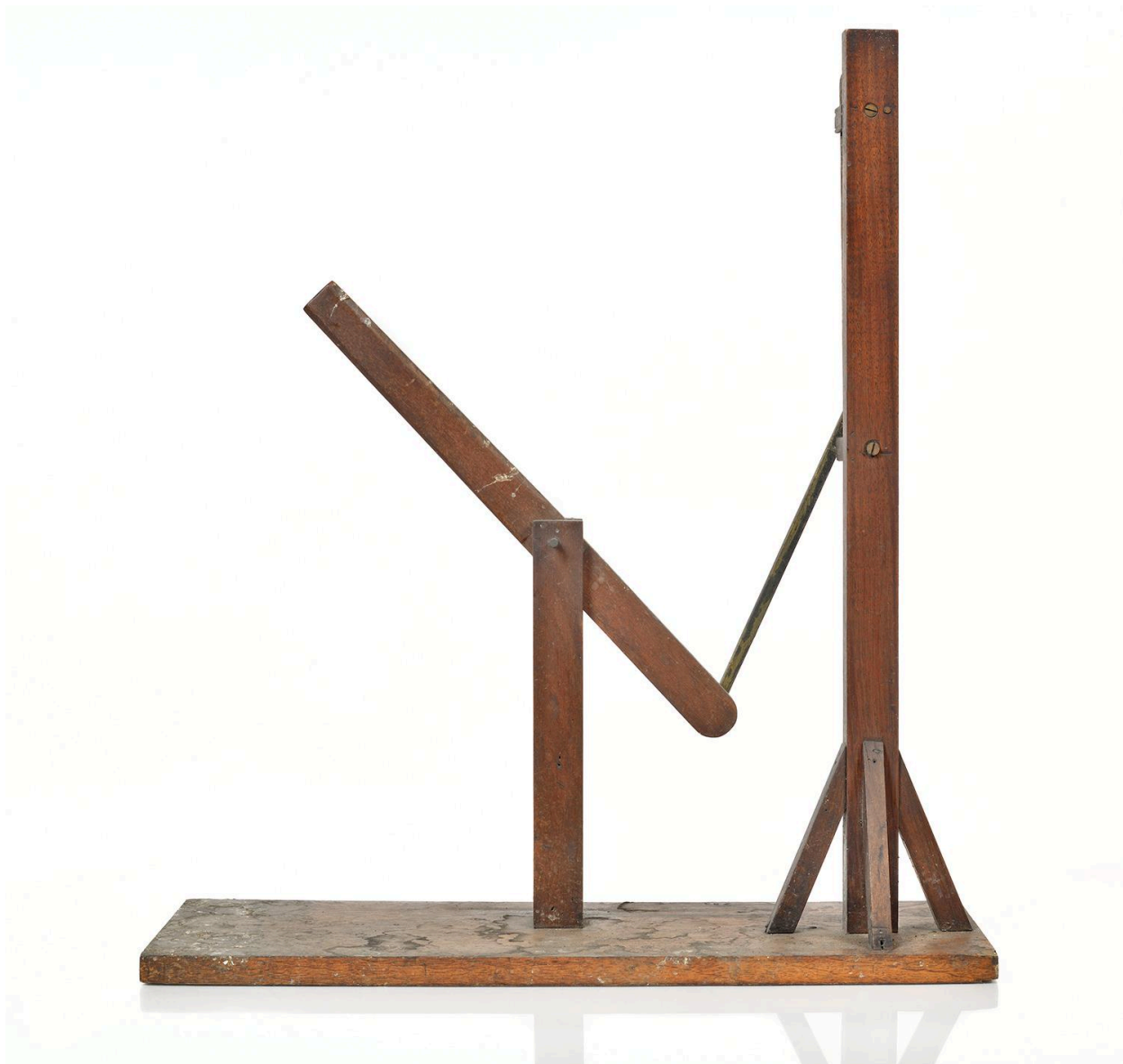
Transformation de mouvement vue 2