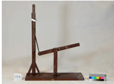
Modèle de transformation de mouvement IVR84_20256900980NUCA