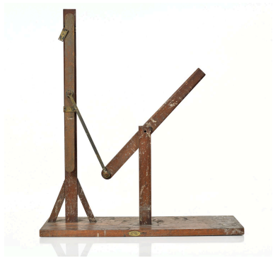
Transformation de mouvement vue 1 IVR84_20256901804NUCA