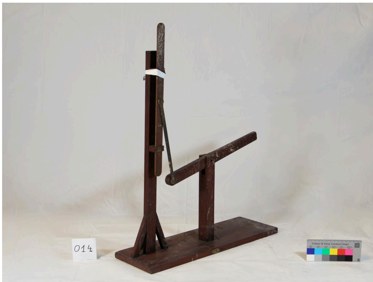
Modèle de transformation de mouvement vue de côté