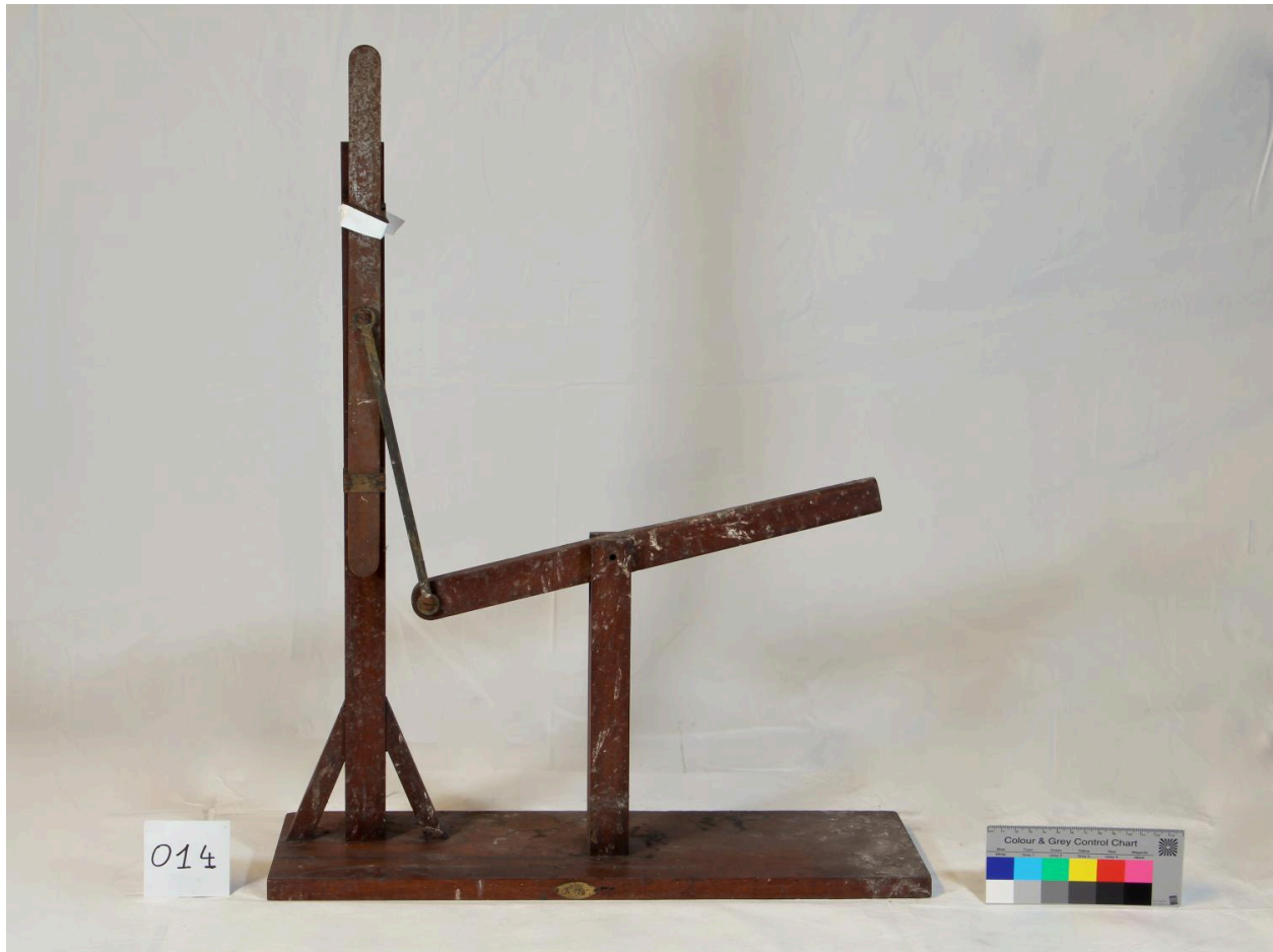
Modèle de transformation de mouvement