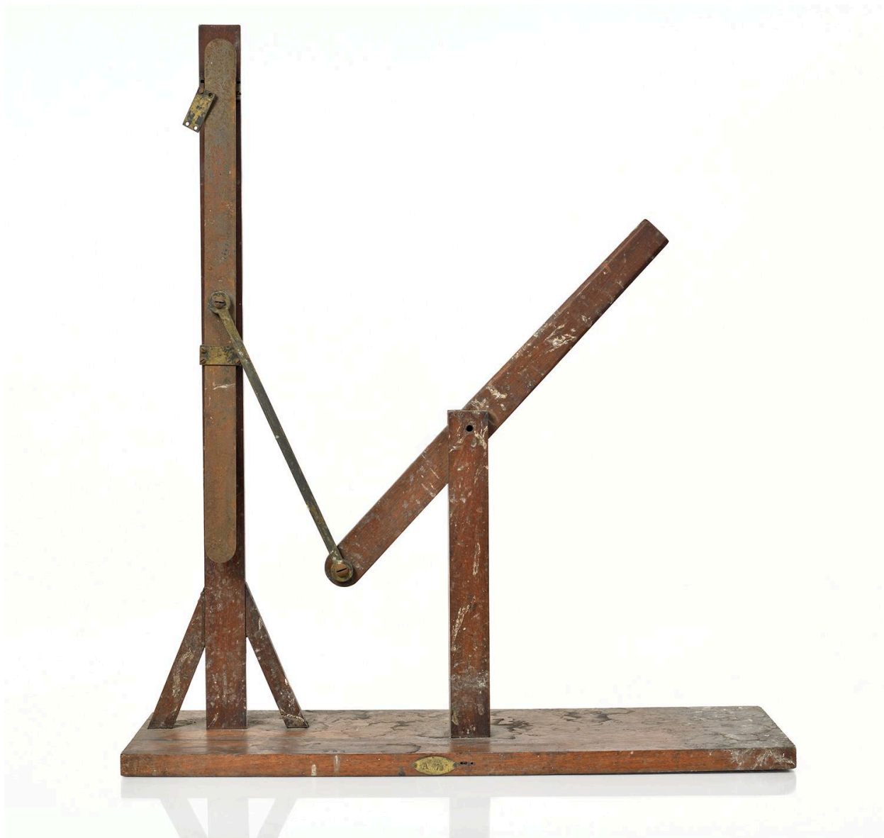
Transformation de mouvement vue 1