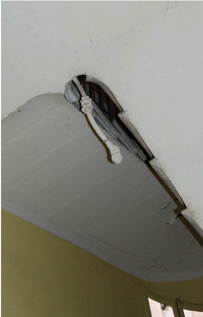
Détail d'un bec de gaz, sur le palier de l'escalier