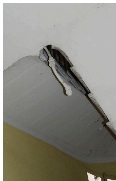
Détail d'un bec de gaz, sur le palier de l'escalier