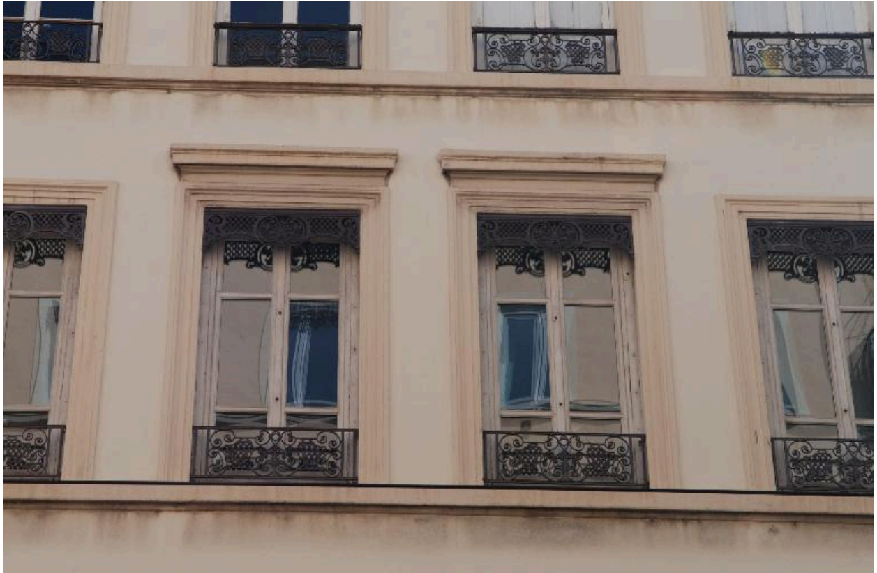
Vue rapprochée de l'élévation sur la rue de Marseille : décor des baies centrales, au 2e étage