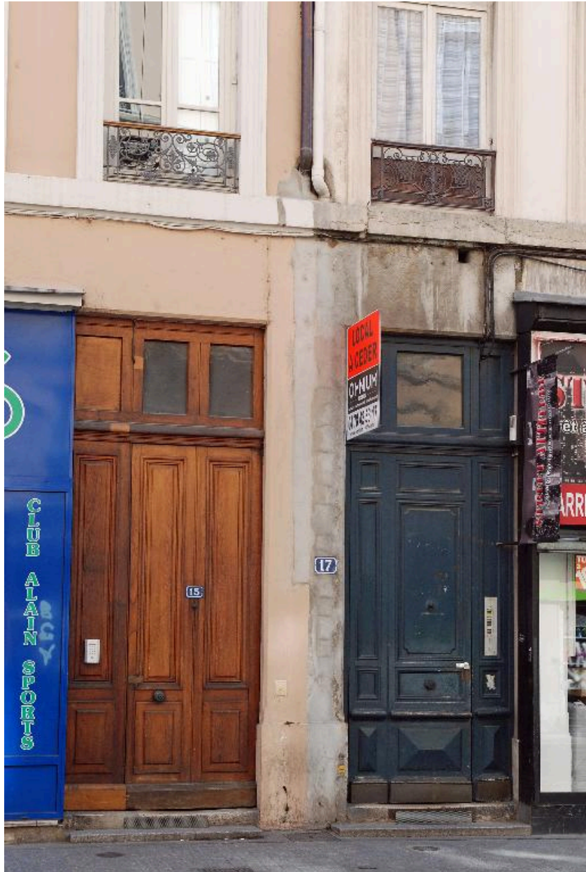
Vue des portes jumelées des n°15 et 17, rue de Marseille