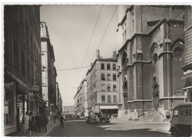
Vue ancienne de l'immeuble, carte postale éditée vers 1960 IVR82_20126900802NUCB