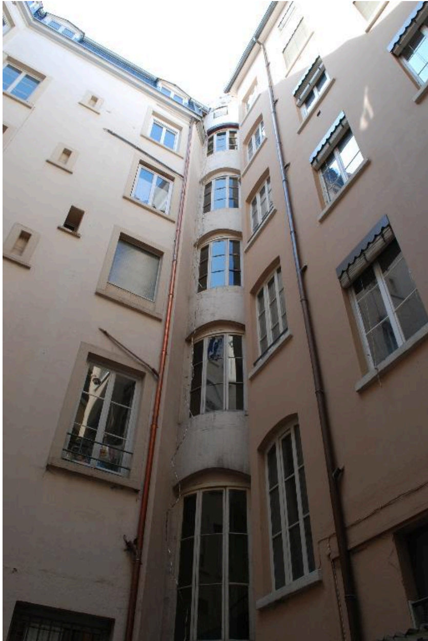
Vue de la cour, avec la cage d'escalier en volume dans l'angle