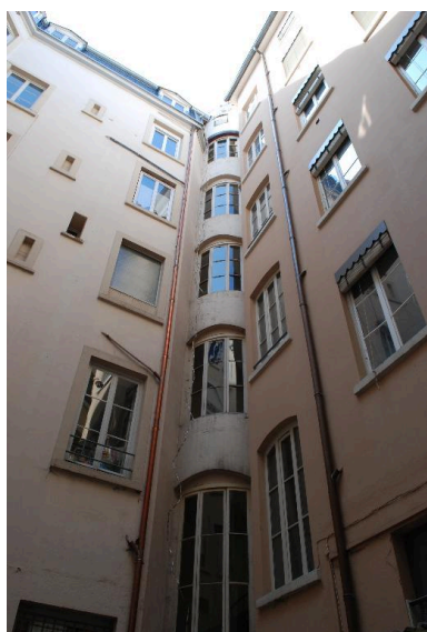
Vue de la cour, avec la cage d'escalier en volume dans l'angle