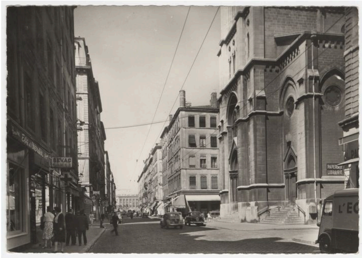
Vue ancienne de l'immeuble, carte postale éditée vers 1960 (AC Lyon, 4 Fi 05543)