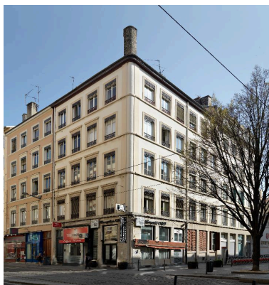
Vue d'ensemble IVR84_20176900453NUCAQ