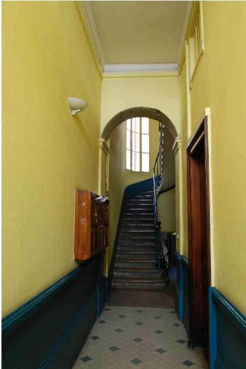
Vue intérieure : l'allée et le départ de l'escalier