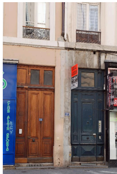
Vue des portes jumelées des n°15 et 17, rue de Marseille IVR84_20166900580NUCA