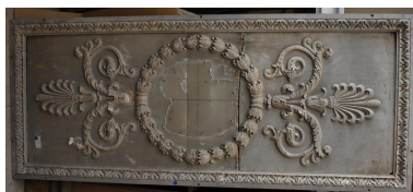
Vue générale - panneau 5 IVR84_20226300828NUCA