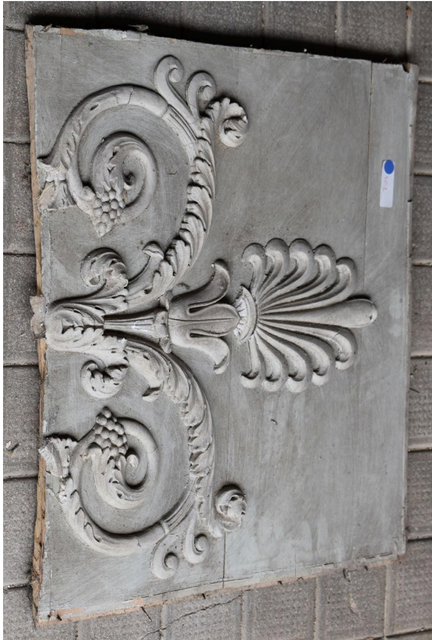
Morceau complémentaire 3 - panneau 4