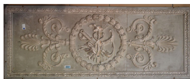
Vue générale - panneau 2 IVR84_20226300759NUCA