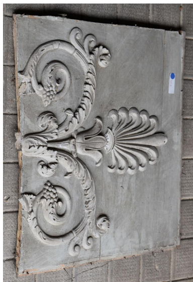
Morceau complémentaire 3 - panneau 4 IVR84_20226300854NUCA