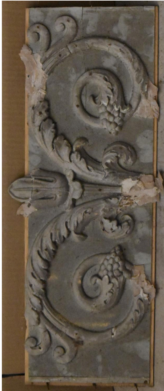
Morceau complémentaire 1 - panneau 4