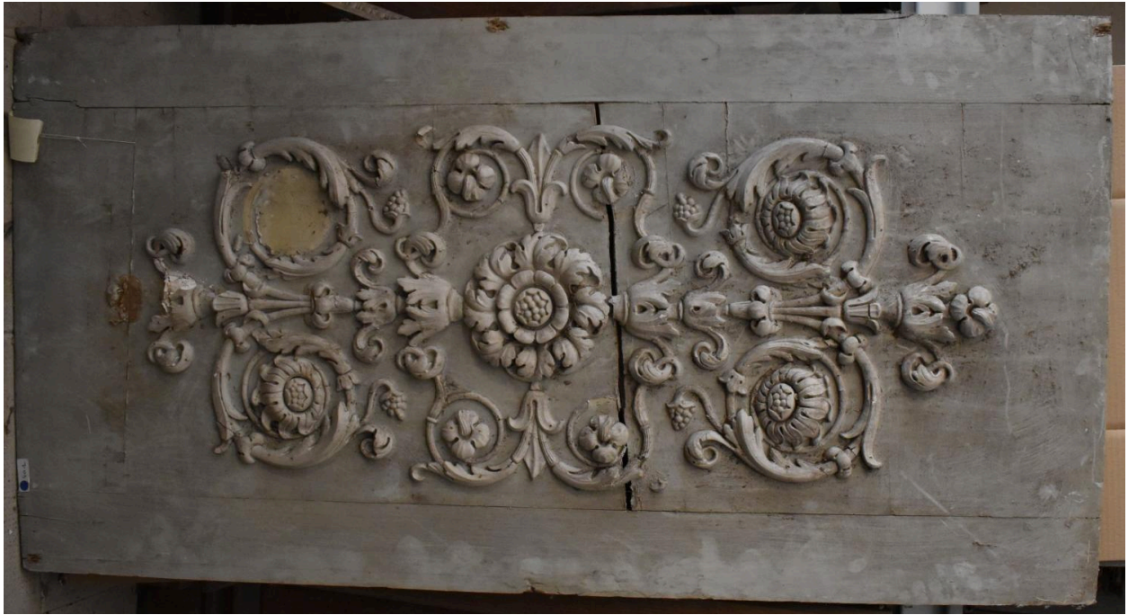
Vue générale - panneau 7