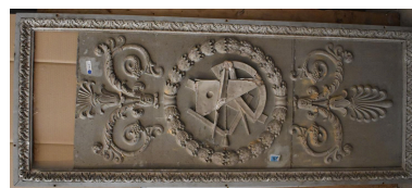
Vue générale - panneau 3