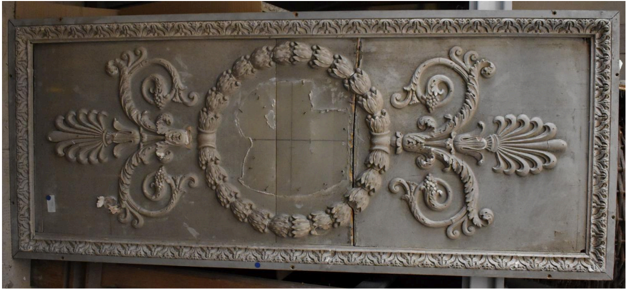
Vue générale - panneau 5