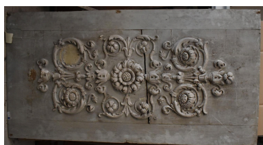
Vue générale - panneau 7 IVR84_20226300826NUCA