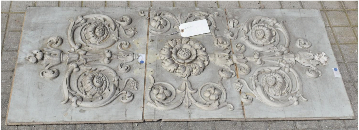
Vue générale - panneau 11