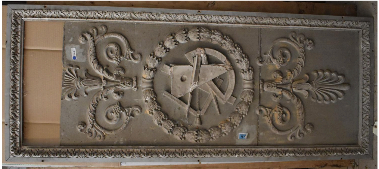
Vue générale - panneau 3