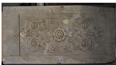
Vue générale - panneau 8 IVR84_20226300833NUCA