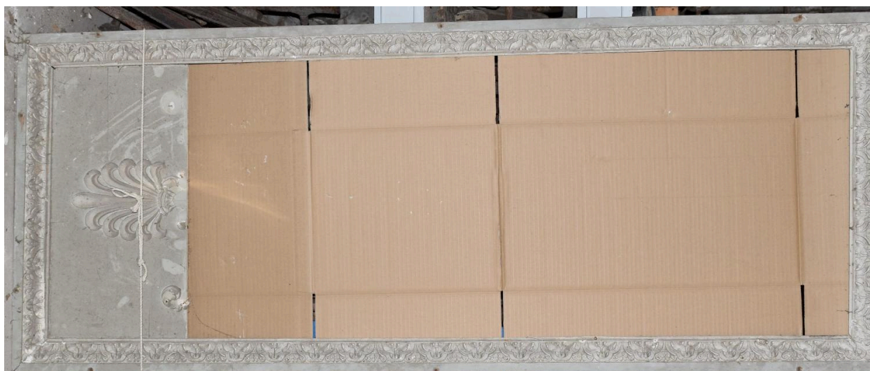
Vue générale - panneau 4