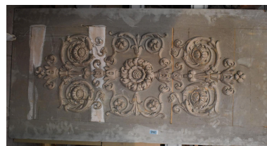
Vue générale - panneau 6 IVR84_20226300824NUCA