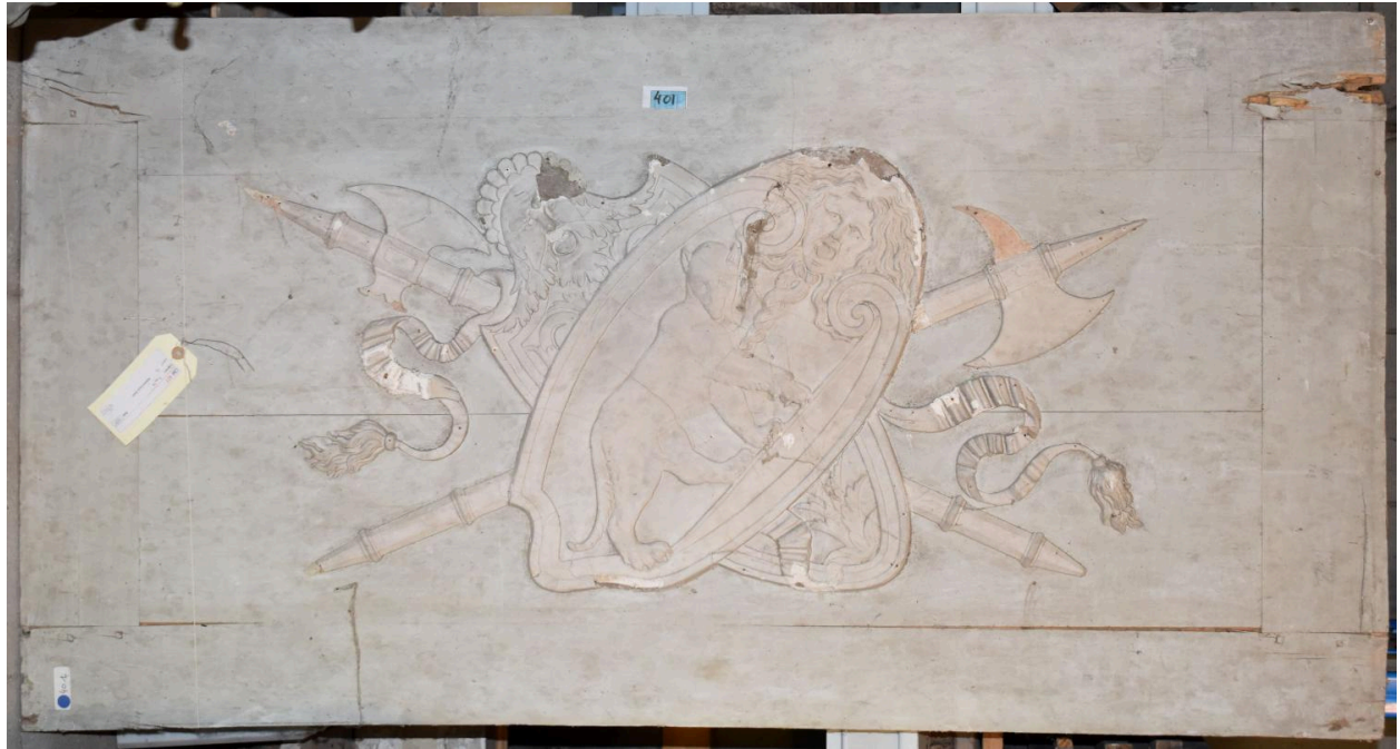
Vue générale - panneau 1