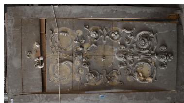
Vue générale - panneau 9 IVR84_20226300823NUCA