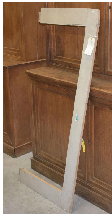
Vue générale - morceau de cadre IVR84_20226302452NUC4A