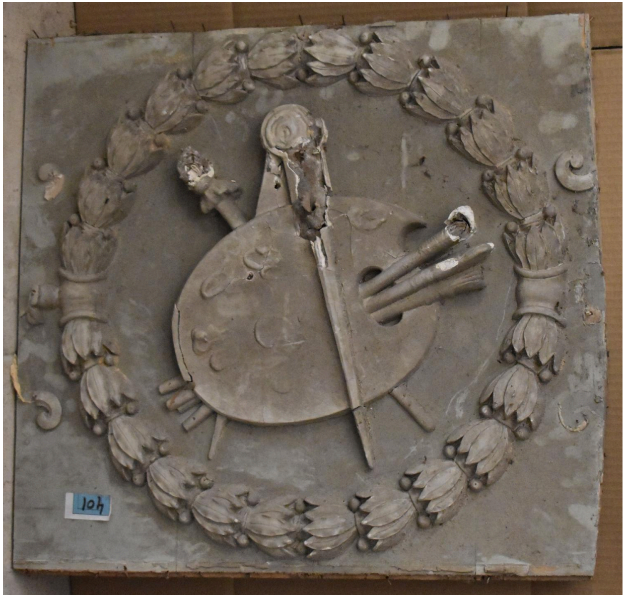
Morceau complémentaire 2 - panneau 4