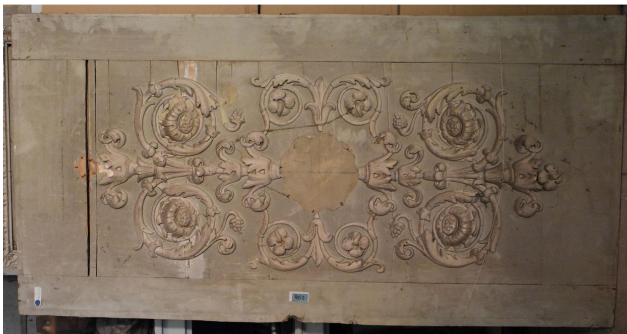
Vue générale - panneau 10