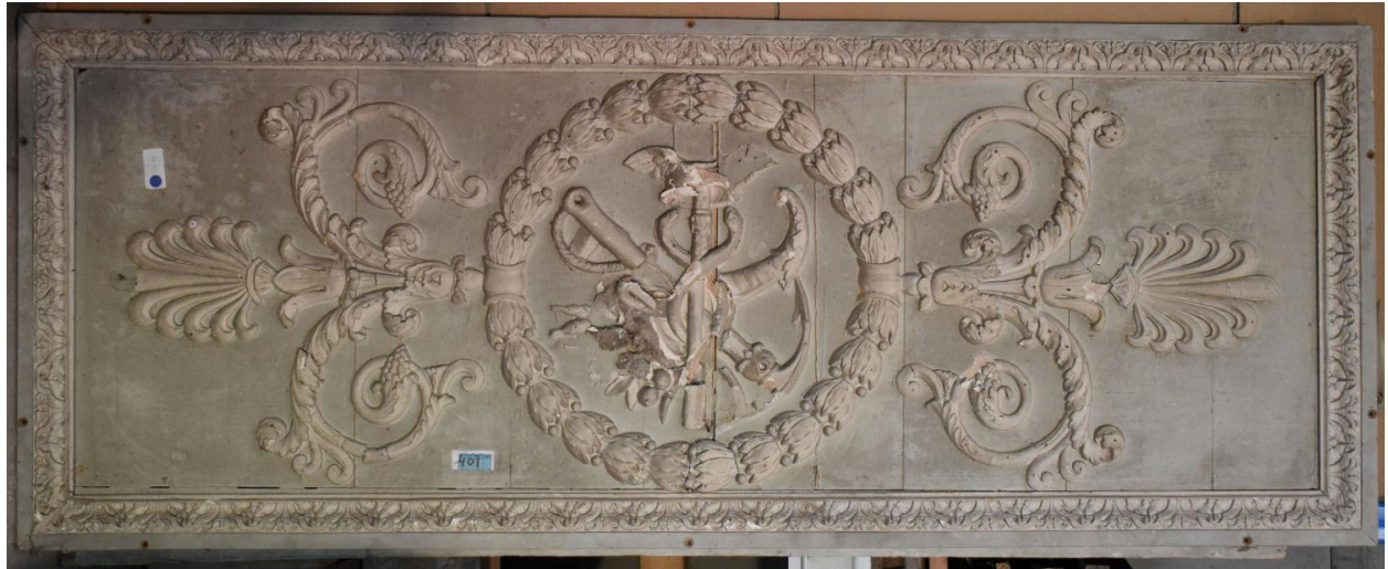
Vue générale - panneau 2