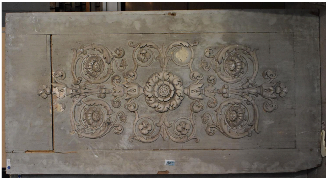
Vue générale - panneau 8