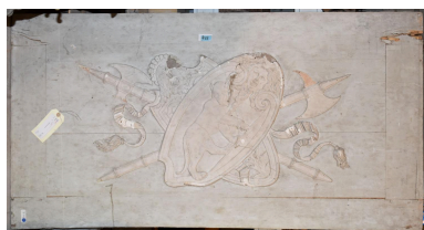
Vue générale - panneau 1 IVR84_20226300757NUCA