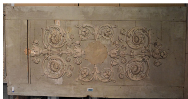
Vue générale - panneau 10 IVR84_20226300831NUCA