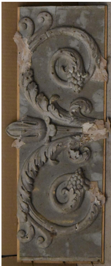
Morceau complémentaire 1 - panneau 4 IVR84_20226300830NUCA