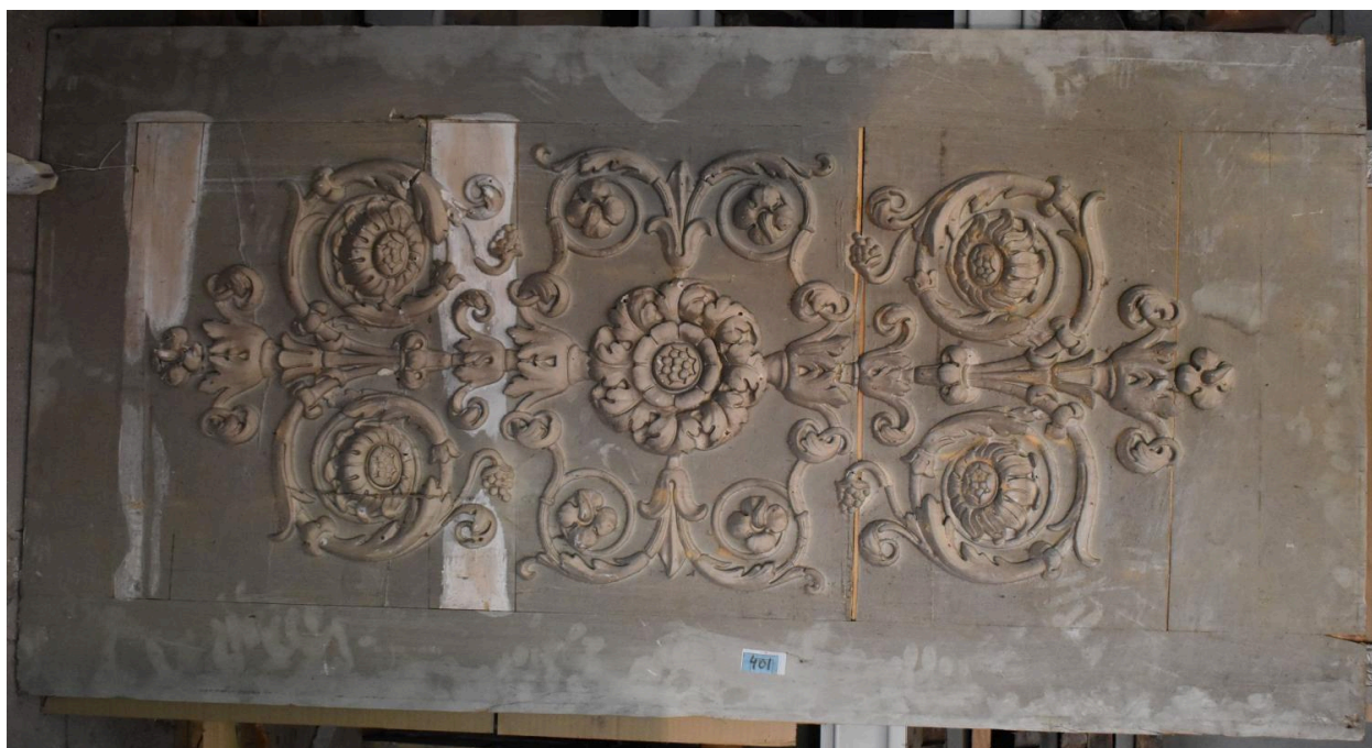
Vue générale - panneau 6