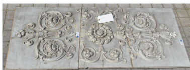
Vue générale - panneau 11 IVR84_20226300853NUCA