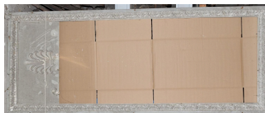
Vue générale - panneau 4 IVR84_20226300821NUCA