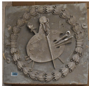
Morceau complémentaire 2 - panneau 4 IVR84_20226300829NUCA