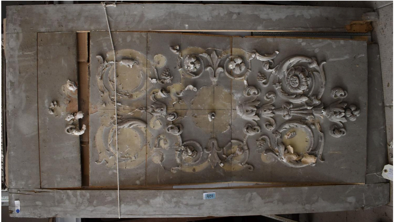
Vue générale - panneau 9