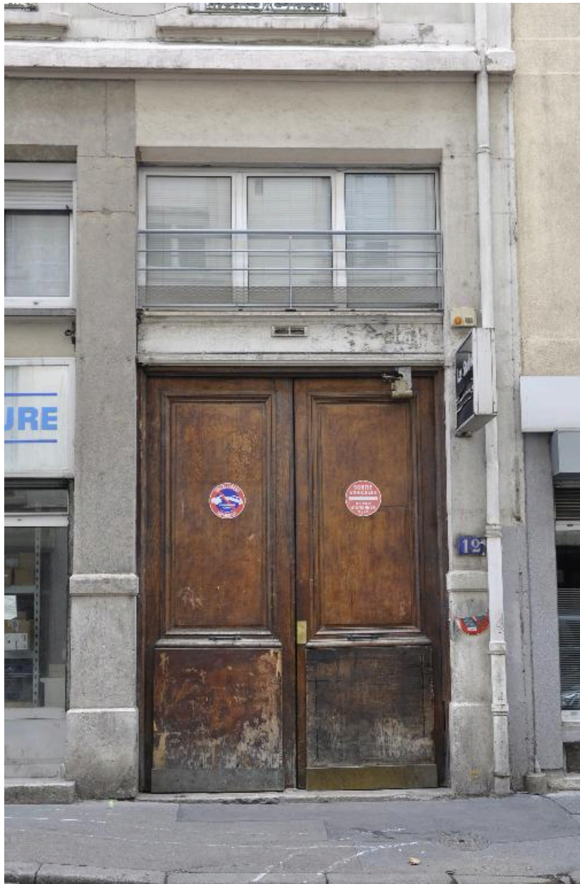
Elévation sur rue : porte cochère, entresol