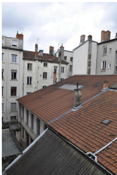
Vue générale du bâti d'activité en coeur d'îlot (aujourd'hui : studio de danse)