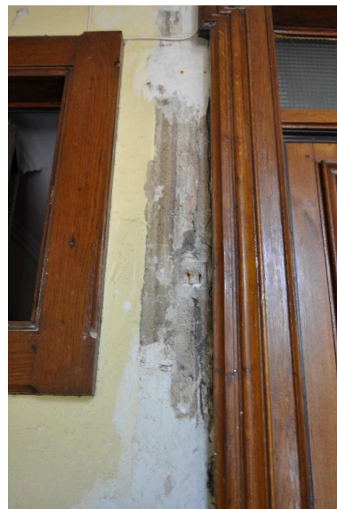
Vue intérieure : traces de décoration sous-jacente dans la cage d'escalier IVR82_20156901028NUCA