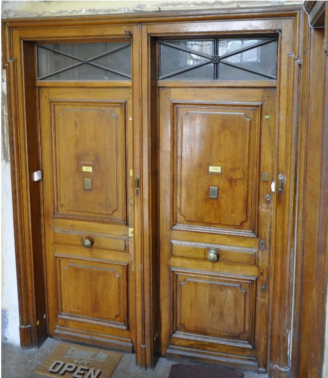
Vue intérieure : portes palières