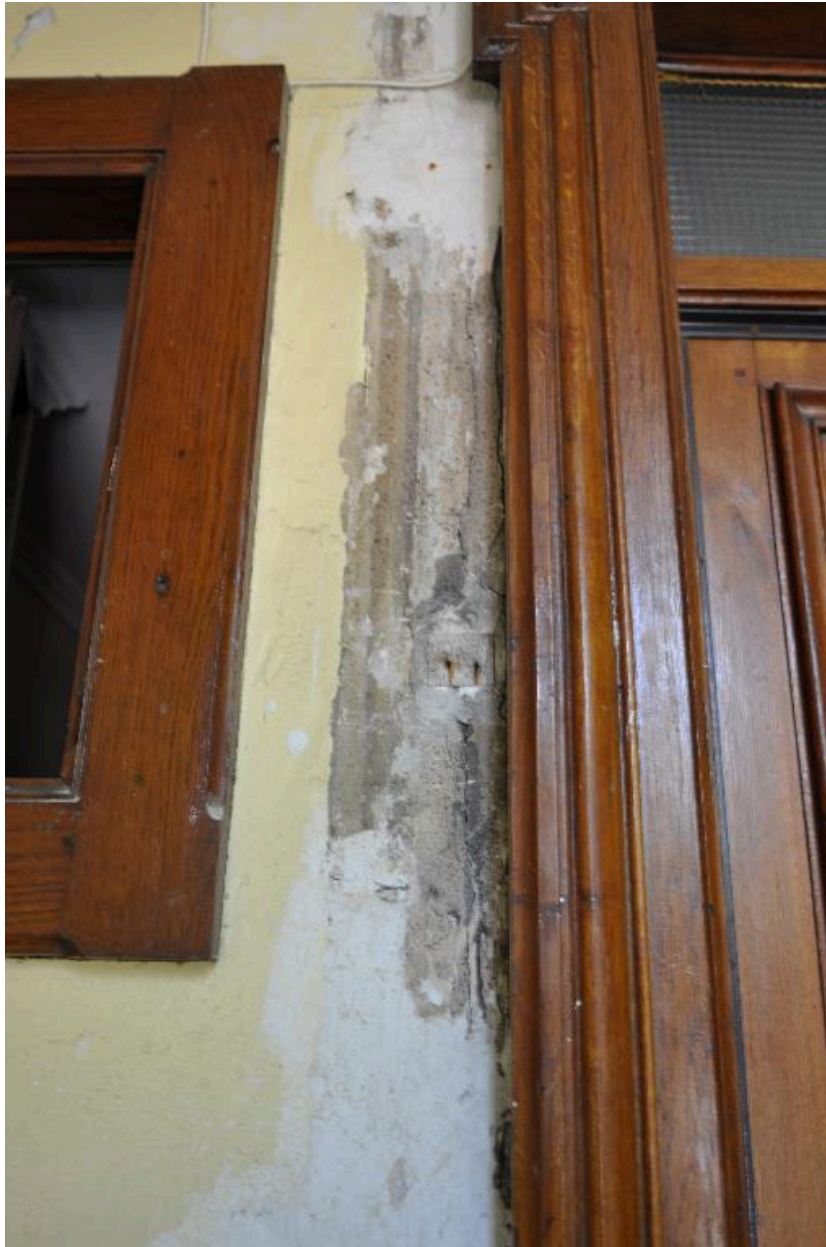
Vue intérieure : traces de décoration sous-jacente dans la cage d'escalier