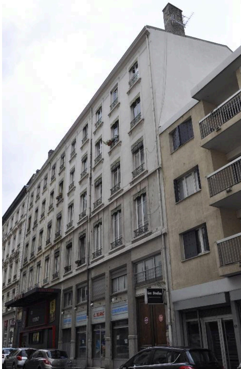
Vue d'ensemble des deux immeubles jumelés