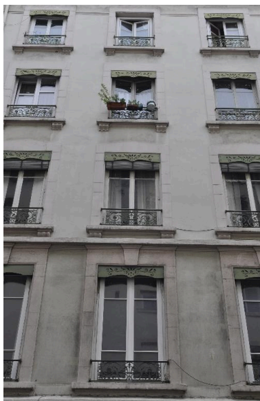
Elévation sur rue : décor des fenêtres des étages