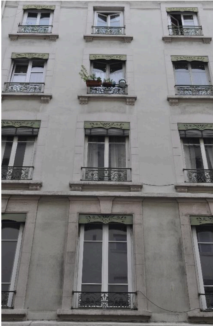
Elévation sur rue : décor des fenêtres des étages