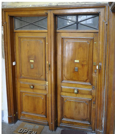
Vue intérieure : portes palières