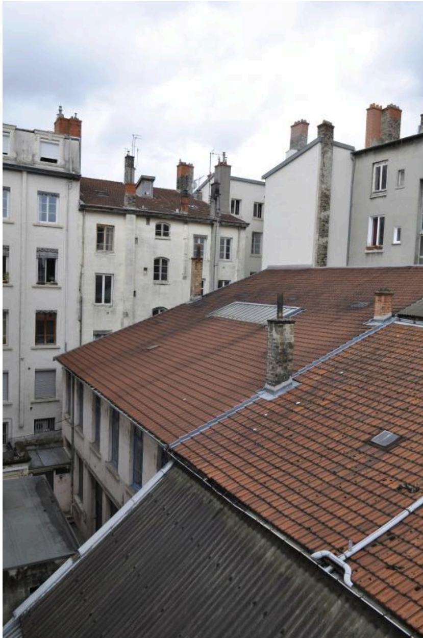
Vue générale du bâti d'activité en coeur d'îlot (aujourd'hui : studio de danse)