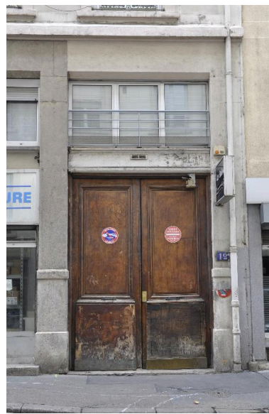
Elévation sur rue : porte cochère, entresol IVR82_20156901024NUCA