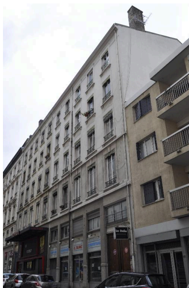
Vue d'ensemble des deux immeubles jumelés IVR82_20156901022NUCA