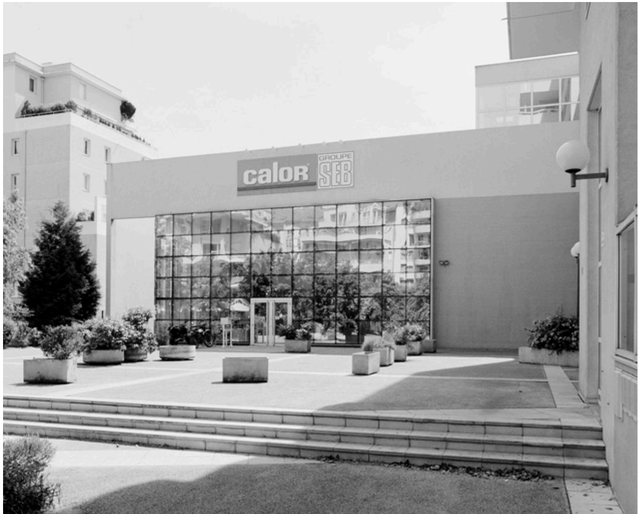
Vue générale du siège social, place Ambroise Courtois