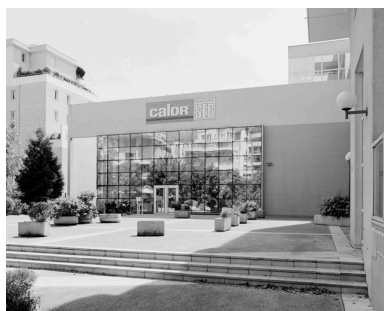
Vue générale du siège social, place Ambroise Courtois IVR82_20056900090X