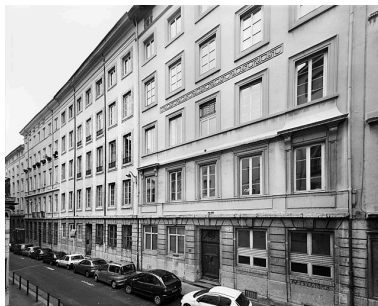
Vue générale de la rue Royale nord-est IVR82_20046902980V