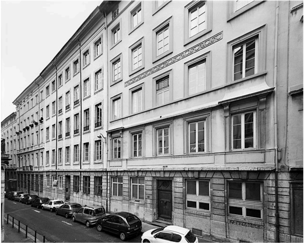
Vue générale de la rue Royale nord-est