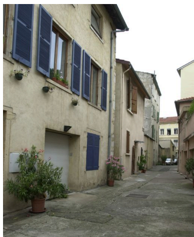
Élévation impasse Rival IVR82_20096901028NUCA