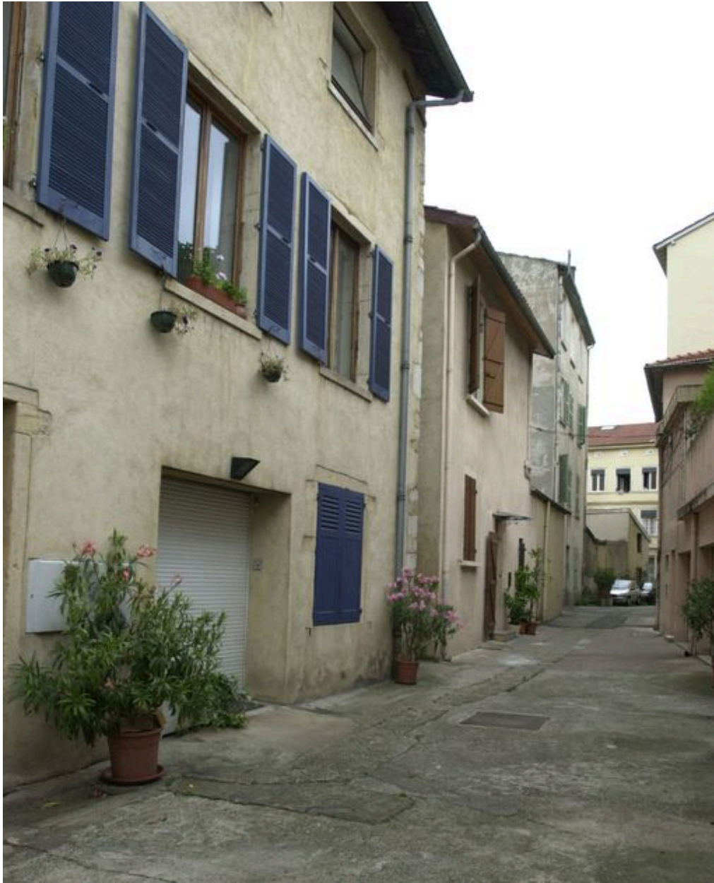
Elévation impasse Rival