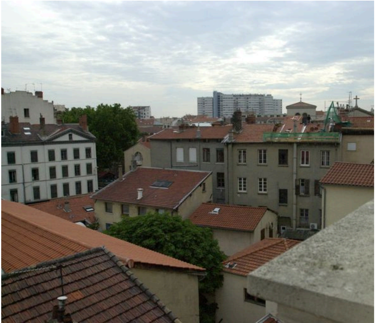
Vue de la toiture depuis le sud-ouest