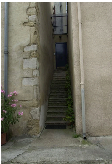
L'escalier entre l'immeuble et la maison voisine IVR82_20096901031NUCA