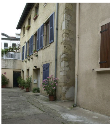
Vue générale depuis le sud IVR82_20096901030NUCA