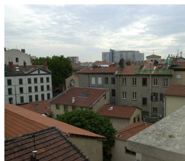
Vue de la toiture depuis le sud-ouest