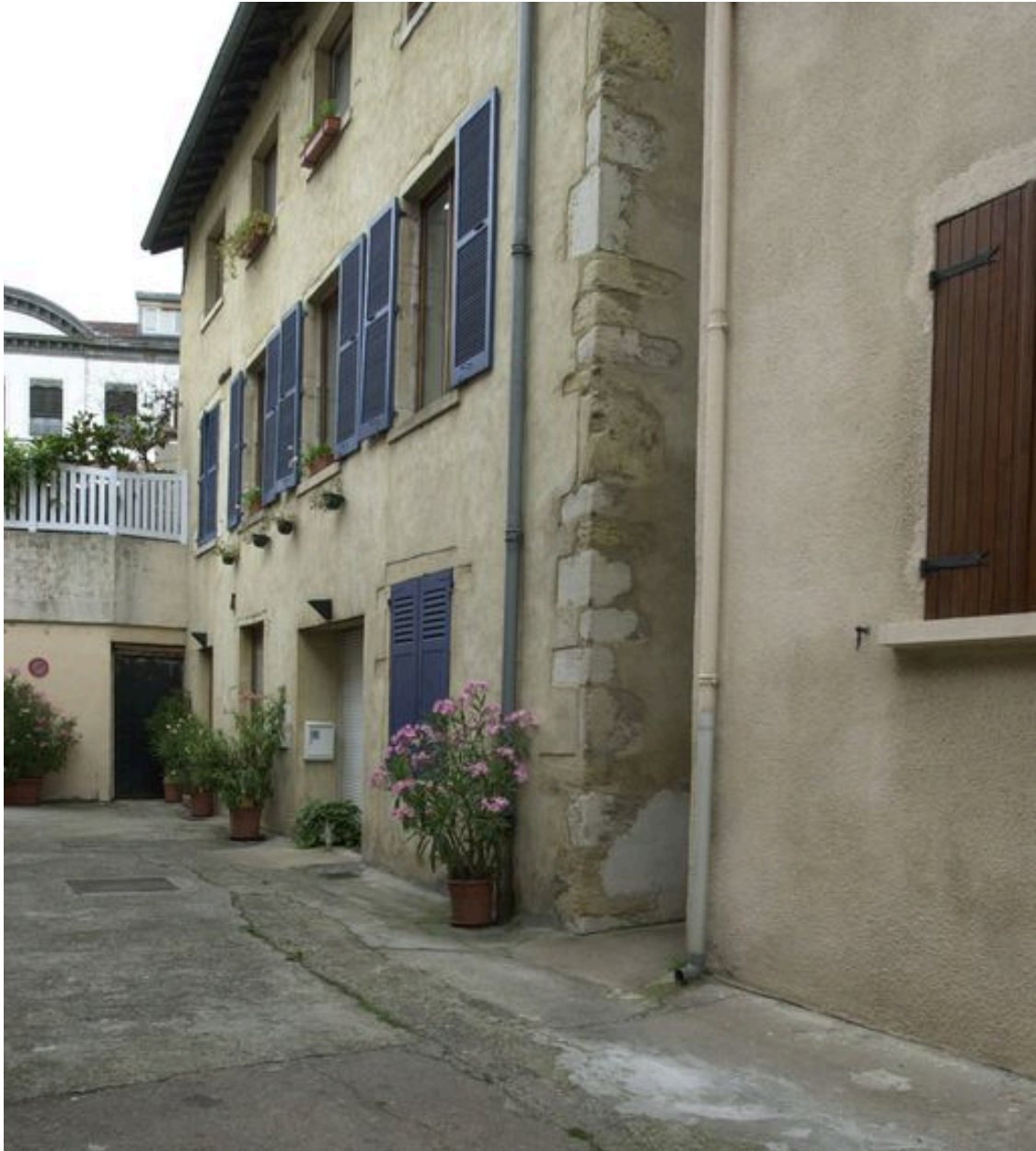
Vue générale depuis le sud