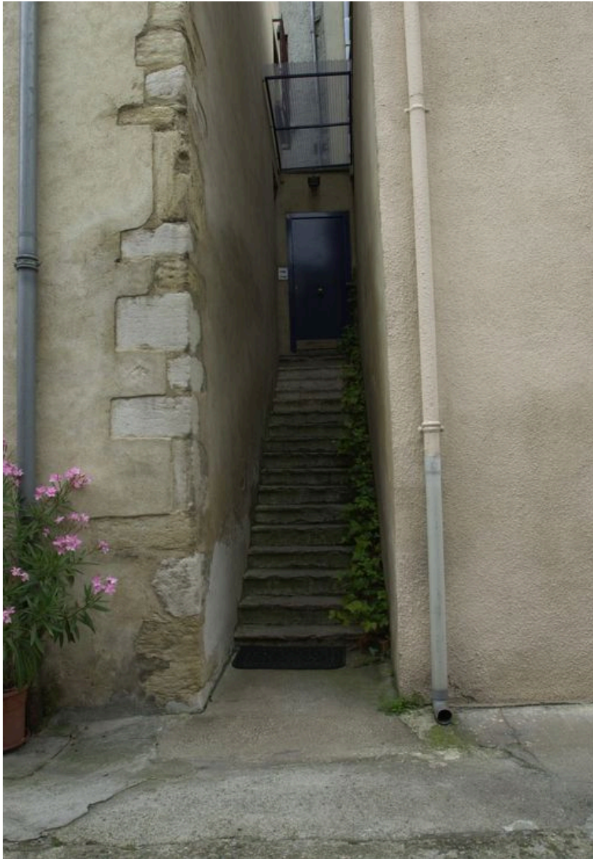
L'escalier entre l'immeuble et la maison voisine