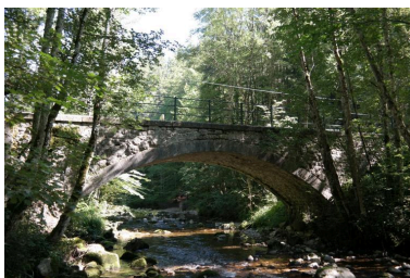
Vue générale du pont de la Cascade IVR84_20197401231NUCA