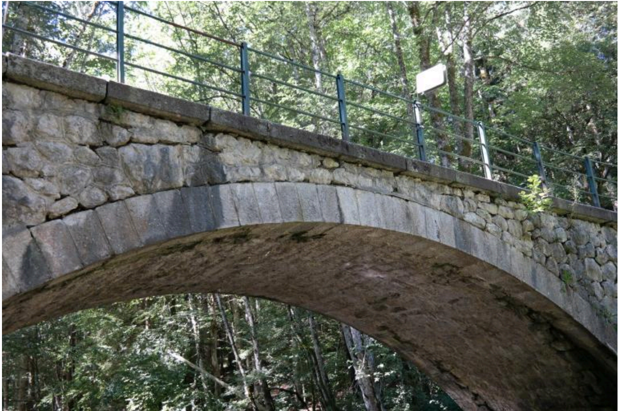
Pont de Pâques, vue de l'intrados