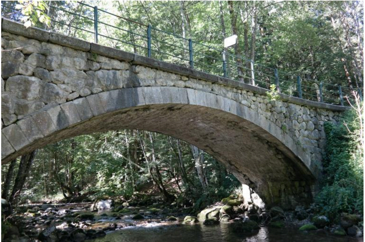
Pont de Pâques, vue de la face aval