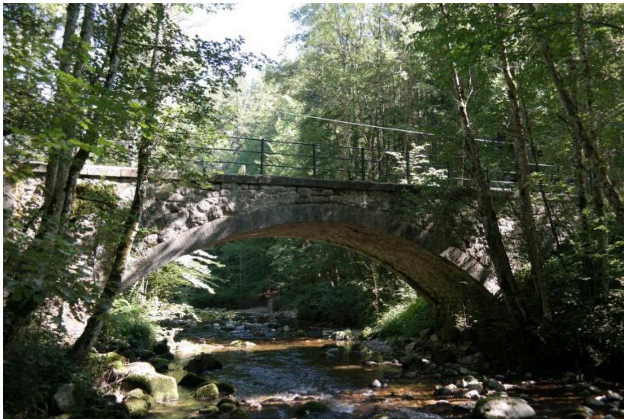
Vue générale du pont de la Cascade