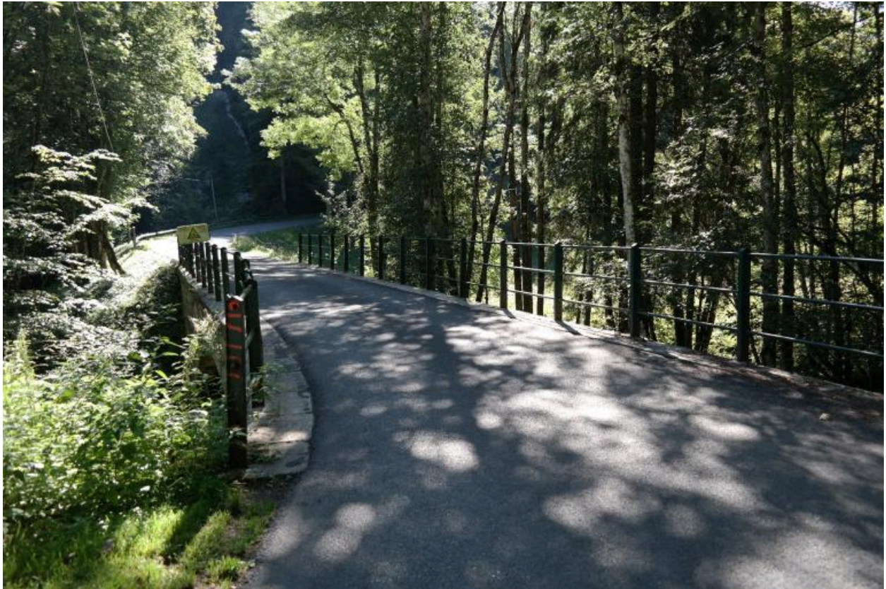
Pont de Pâques, vue de la chaussée et des garde-corps