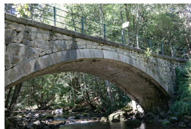
Pont de Pâques, vue de la face aval