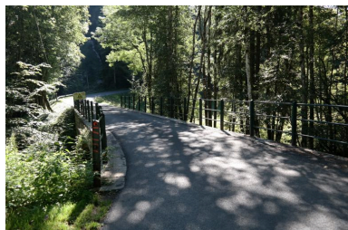
Pont de Pâques, vue de la chaussée et des garde-corps IVR84_20207401528NUCA