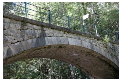
Pont de Pâques, vue de l'intrados