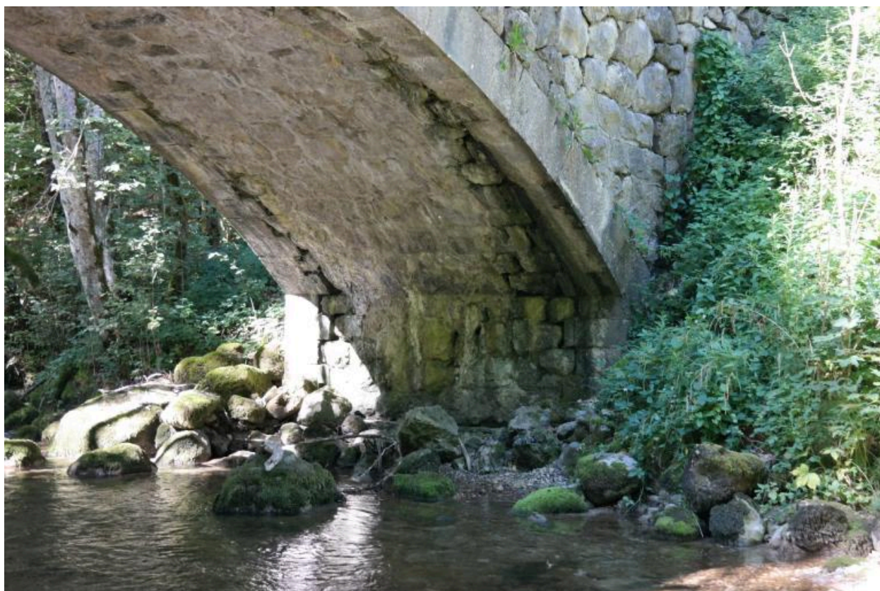
Pont de Pâques, vue de la pile rive gauche