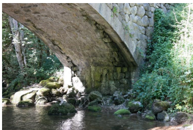
Pont de Pâques, vue de la pile rive gauche