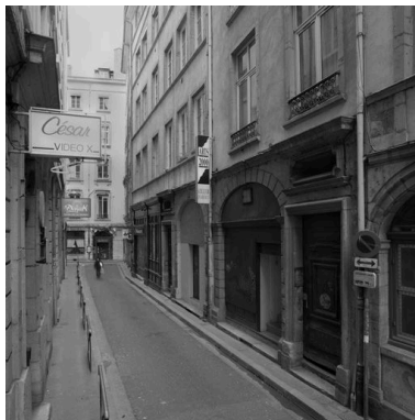
Vue générale des façades IVR82_20056900404NUC