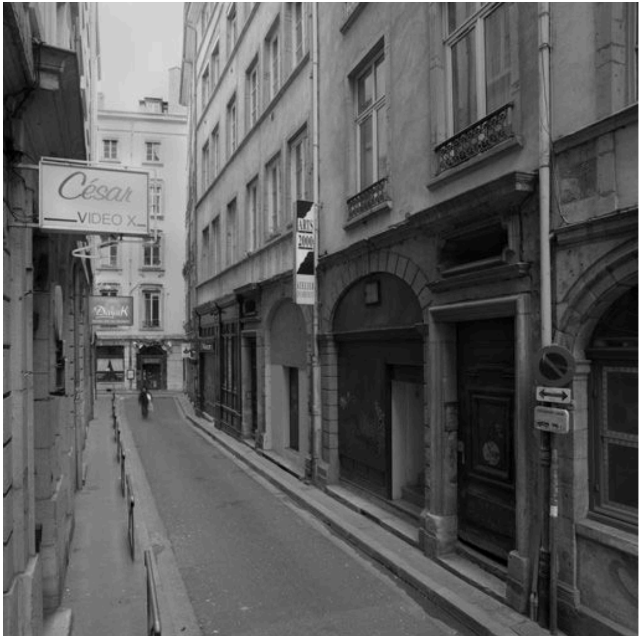
Vue générale des façades