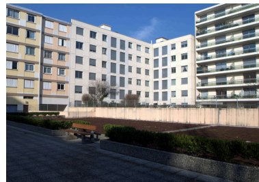
Elévation sur cour, vue partielle IVR82_20116904135NUCA