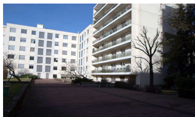
Elévation sur cour, depuis le sud-est IVR82_20116904139NUCA