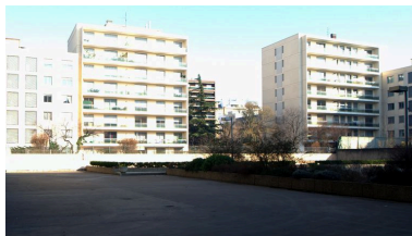
Elévation sur cour, depuis le sud