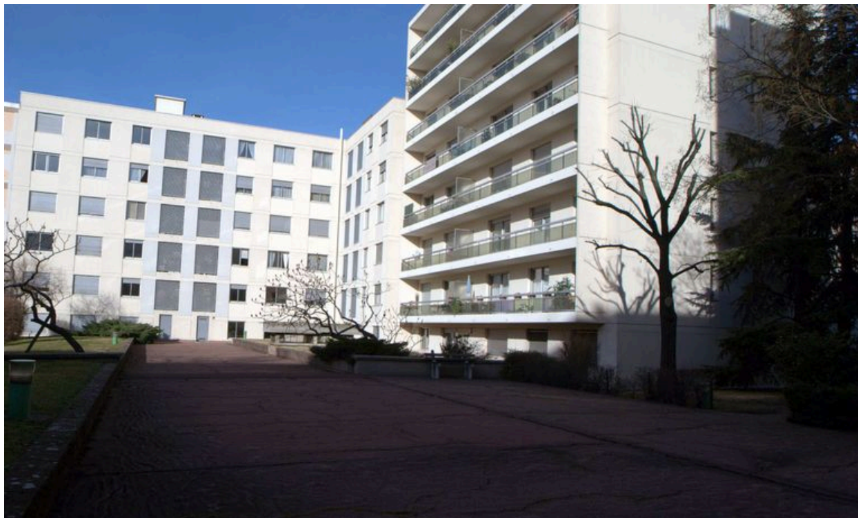
Elévation sur cour, depuis le sud-est