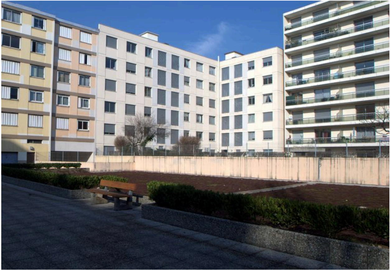
Elévation sur cour, vue partielle