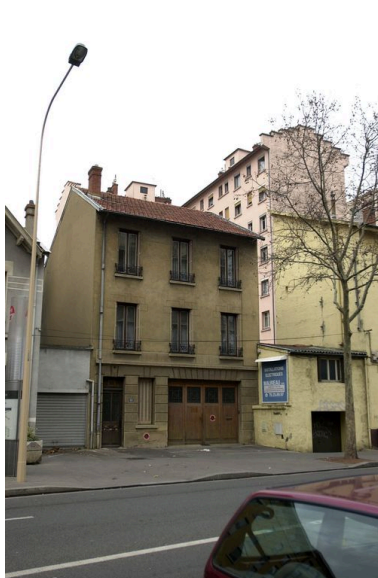
Immeuble, vue générale sur le boulevard