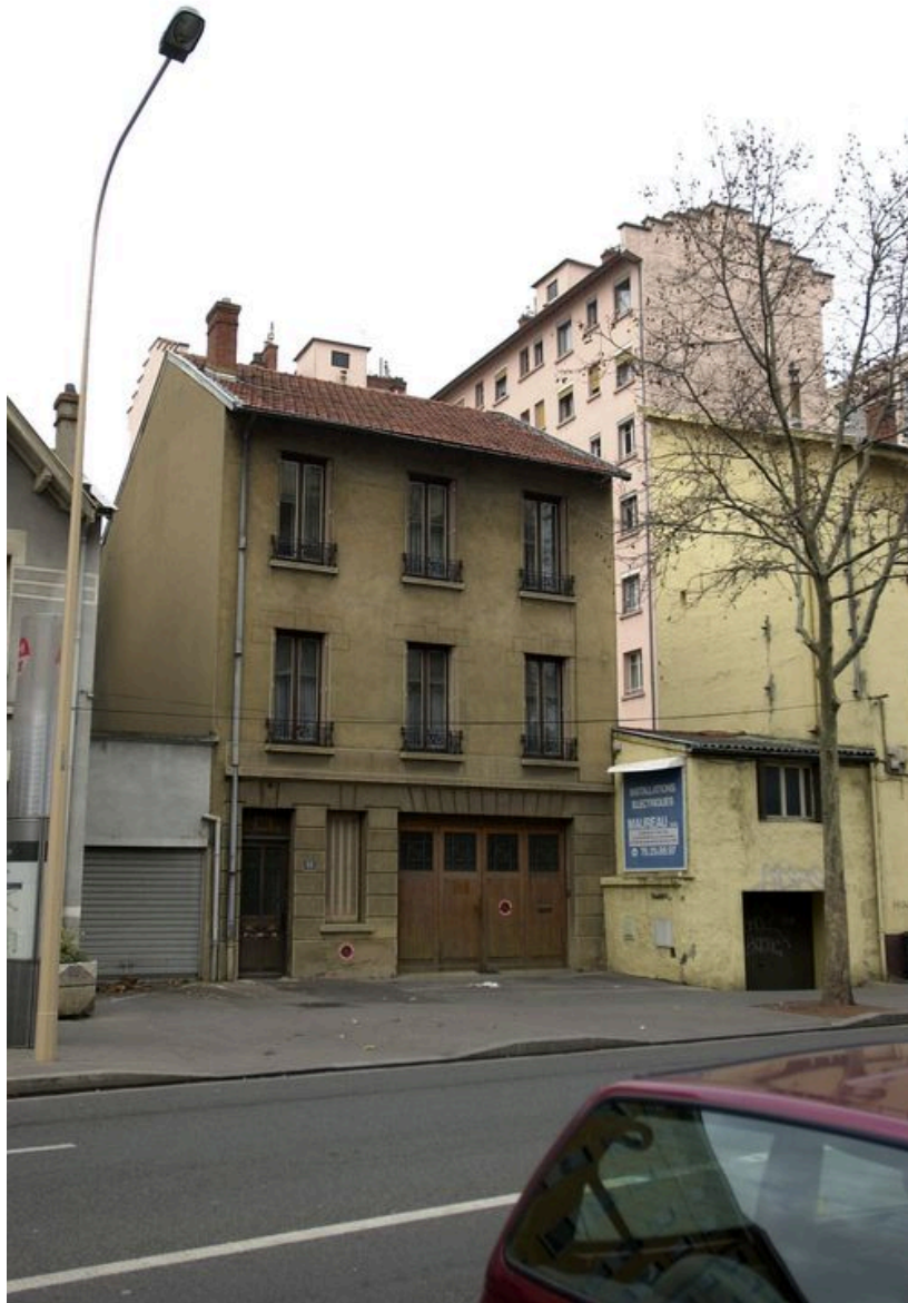
Immeuble, vue générale sur le boulevard