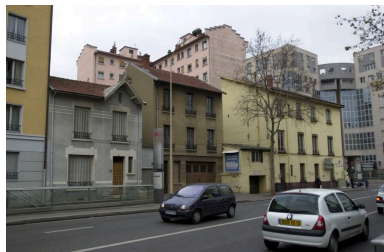
Vue générale parmi les autres constructions à démolir IVR82_20036902122NUCA