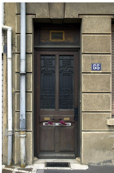
Immeuble, façade sur le boulevard, porte IVR82_20036902130NUCA