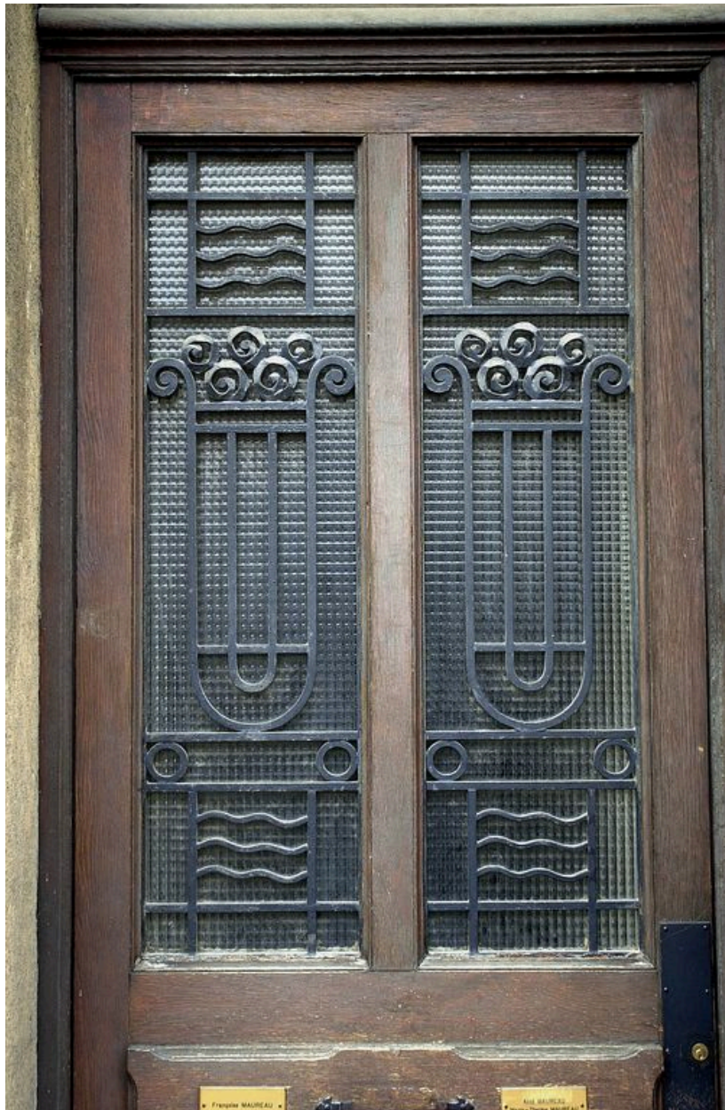
Immeuble, façade sur le boulevard, détail de la grille du vantail de la porte