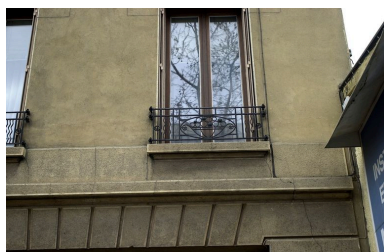
Immeuble, façade sur le boulevard, détail d'une fenêtre du 1er étage