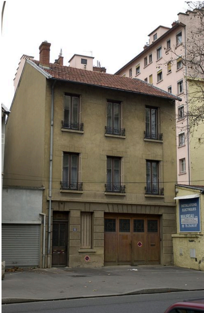
Immeuble, façade sur le boulevard