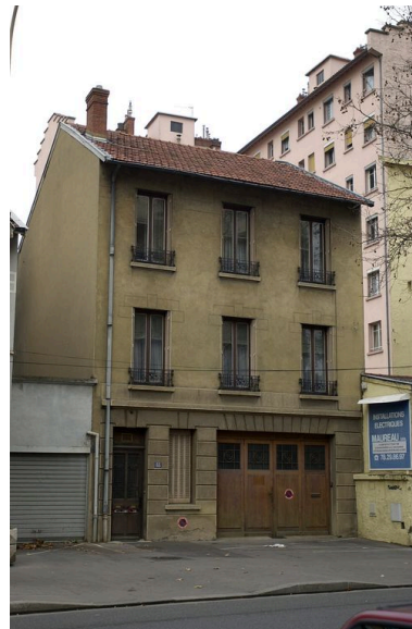
Immeuble, façade sur le boulevard