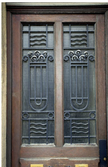
Immeuble, façade sur le boulevard, détail de la grille du vantail de la porte IVR82_20036902131NUCA