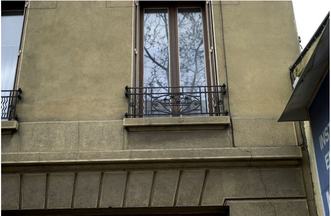
Immeuble, façade sur le boulevard, détail d'une fenêtre du 1er étage