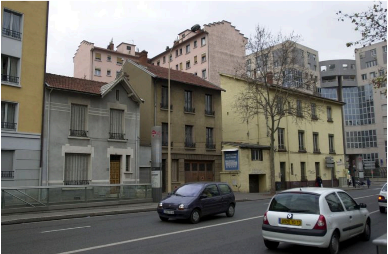
Vue générale parmi les autres constructions à démolir