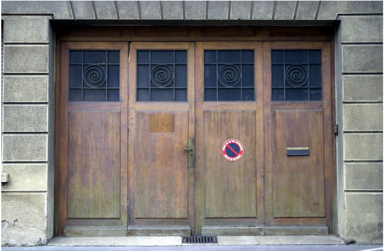
Immeuble, façade sur le boulevard, entrée de l'atelier