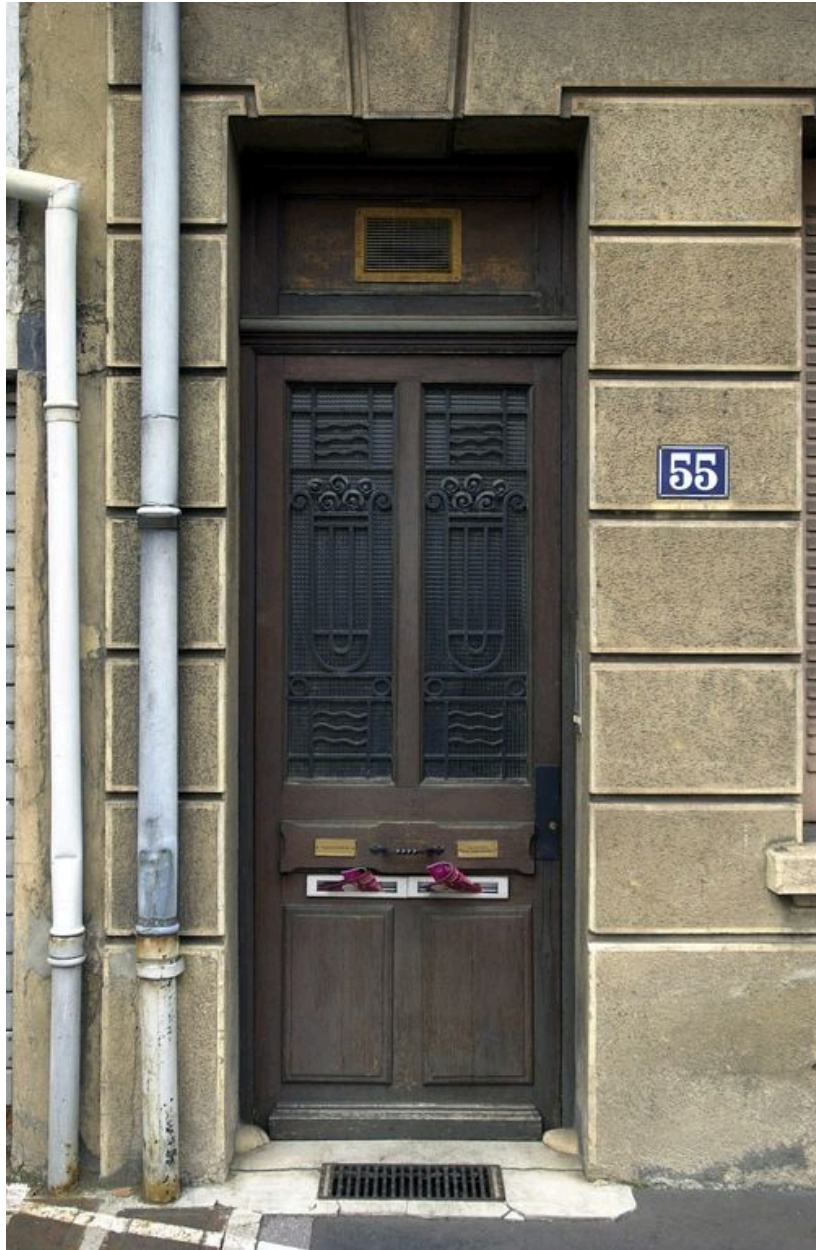
Immeuble, façade sur le boulevard, porte