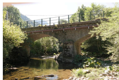
Pont des Doubines, vue de la face aval IVR84_20197401233NUCA