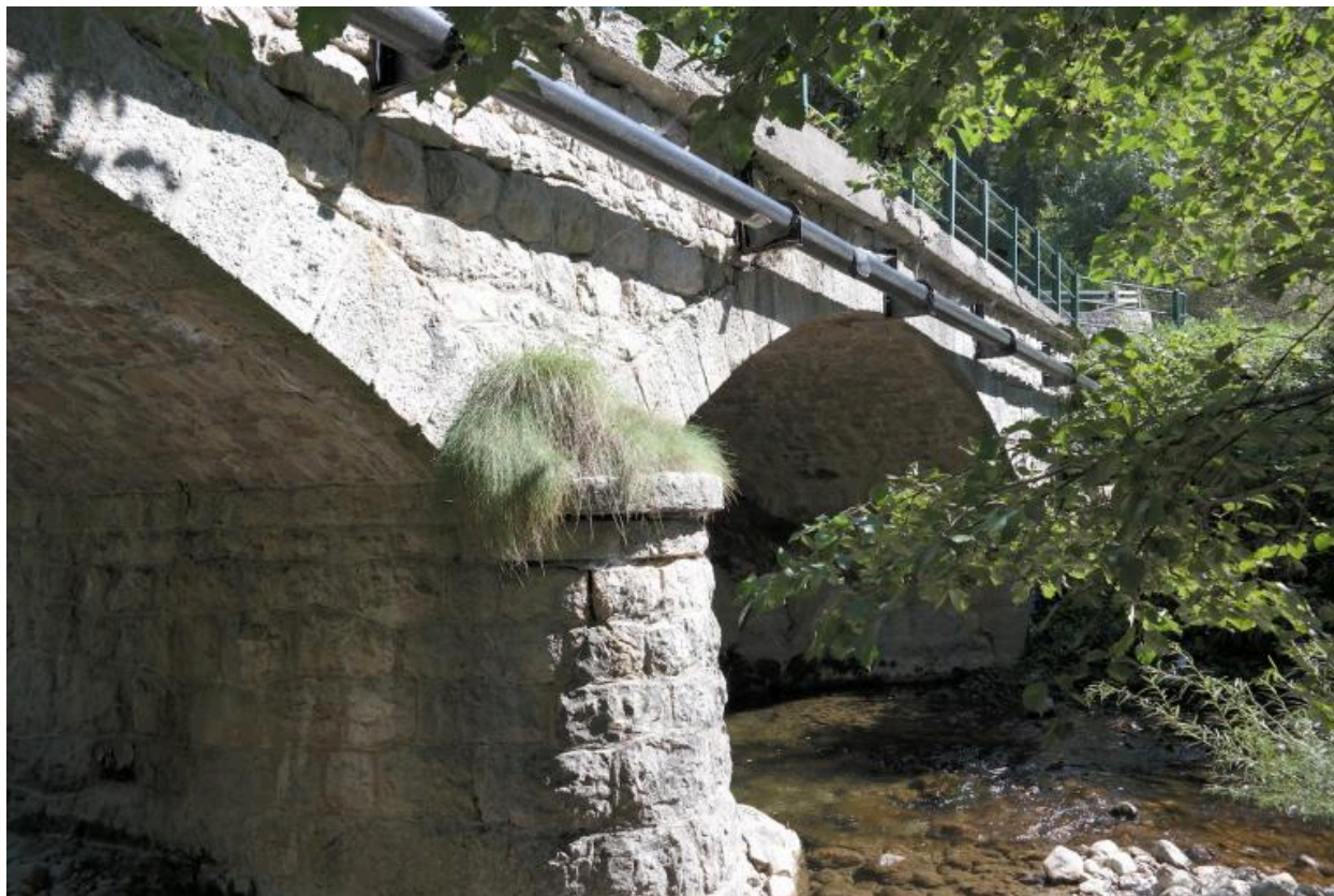
Pont des Doubines, vue de la face amont