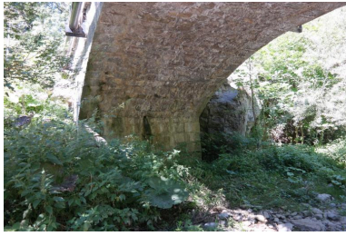
Pont des Doubines, détail culée rive gauche et intrados IVR84_20207401515NUCA