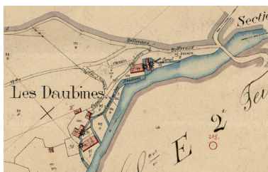
Extrait de la section A Feuille n°1 du cadastre de Bellevaux. 1874. IVR84_20207401511NUCA