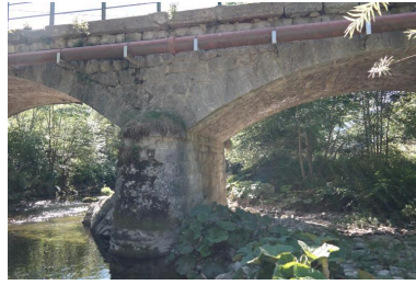
Pont des Doubines, détail de la pile centrale