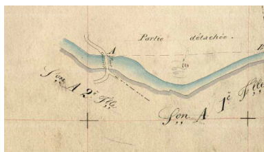
Extrait de la section E Feuille n°2 du cadastre de Bellevaux. 1874. IVR84_20207401510NUCA