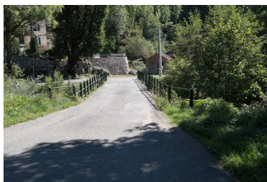
Pont des Doubines, vue de la chaussée et des garde-corps IVR84_20207401513NUCA