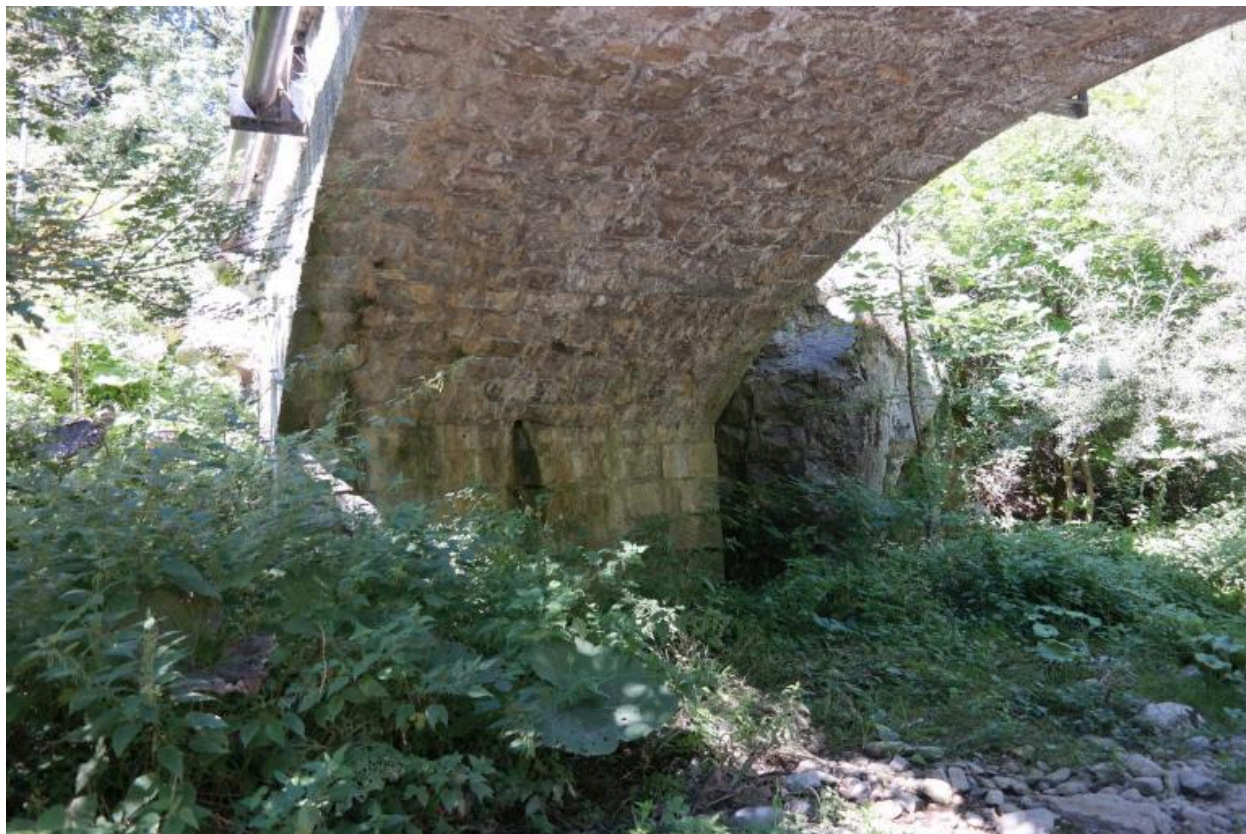
Pont des Doubine, détail culée rive gauche et intrados