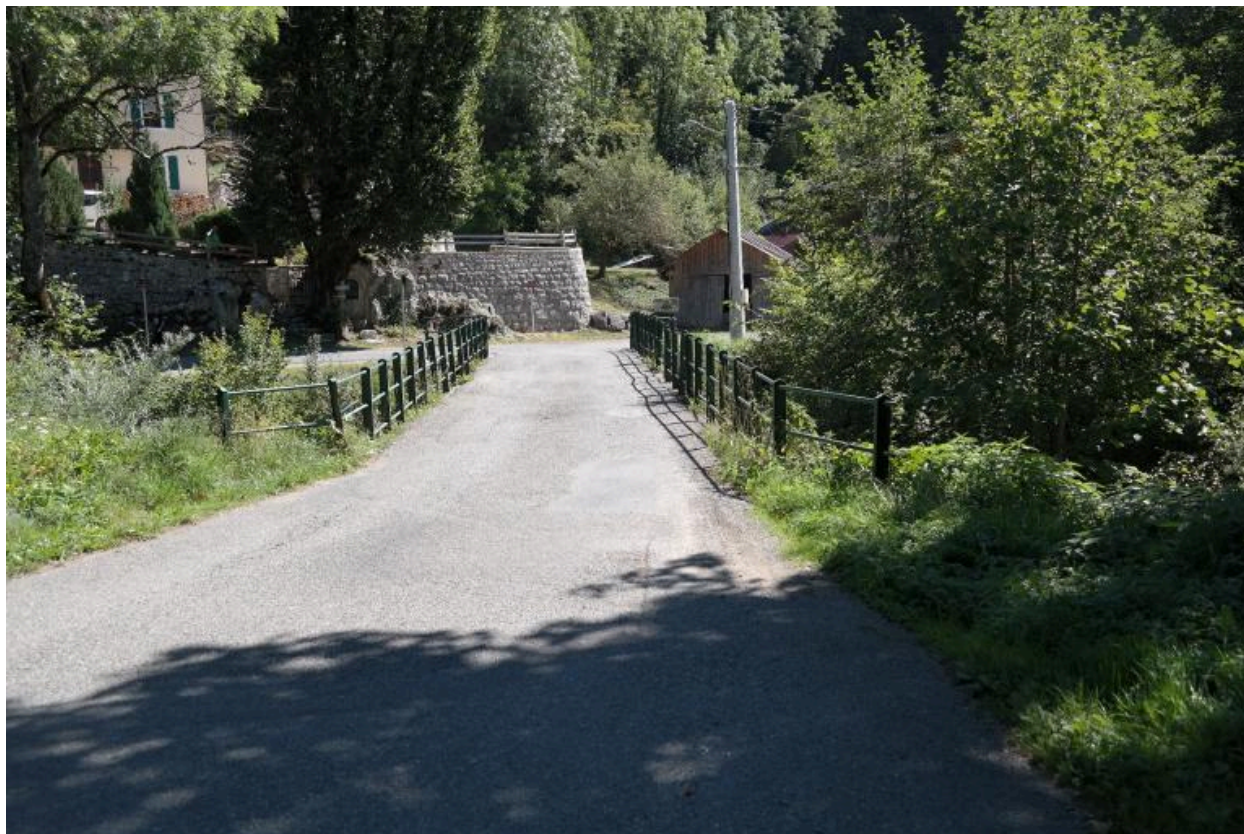
Pont des Doubines, vue de la chaussée et des garde-corps