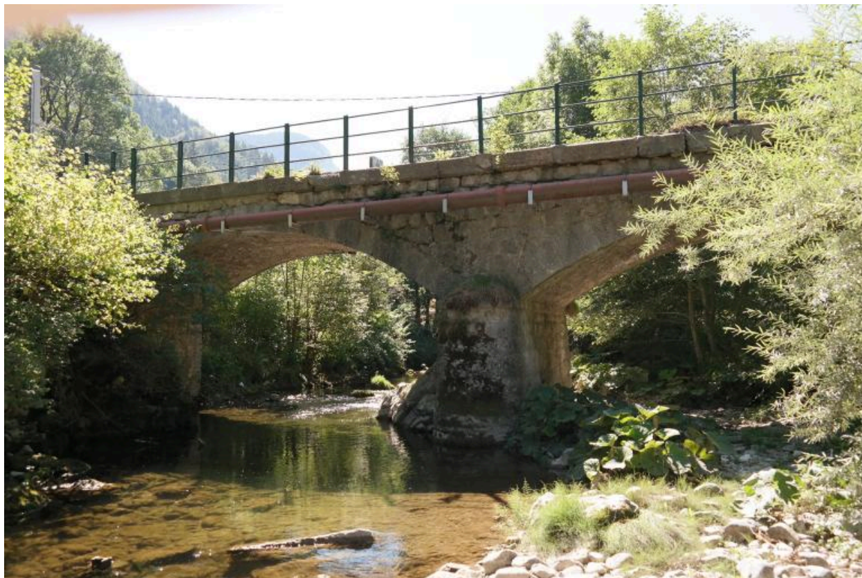
Pont des Doubines, vue de la face aval