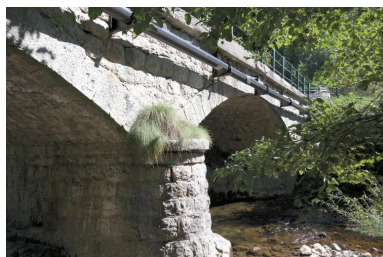
Pont des Doubines, vue de la face amont IVR84_20207401512NUCA