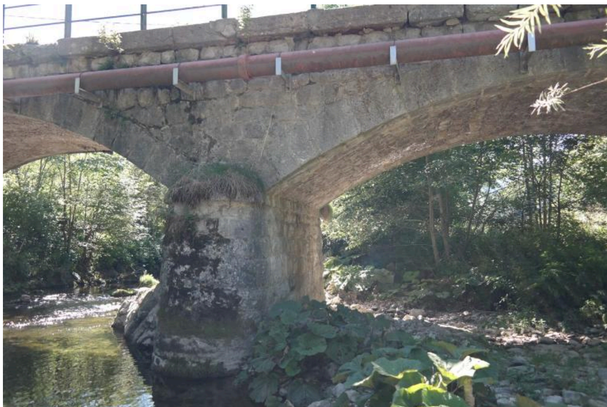
Pont des Doubines, détail de la pile centrale