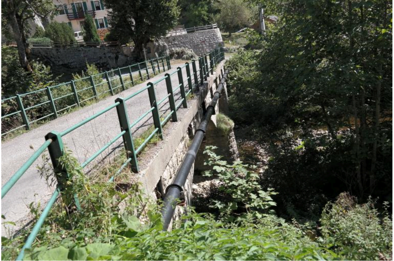
Pont des Doubines, vue générale