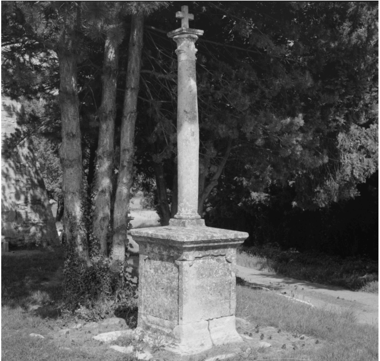
Vue d'ensemble de la croix datée 1818, placée au-devant de la chapelle Saint-Barthélémy.