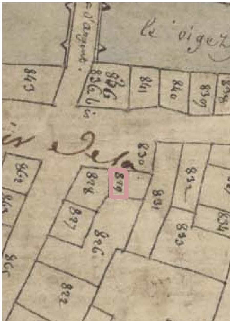
Extrait du plan cadastral de 1809, parcelle E 829.