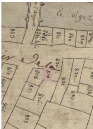
Extrait du plan cadastral de 1809, parcelle E 829.