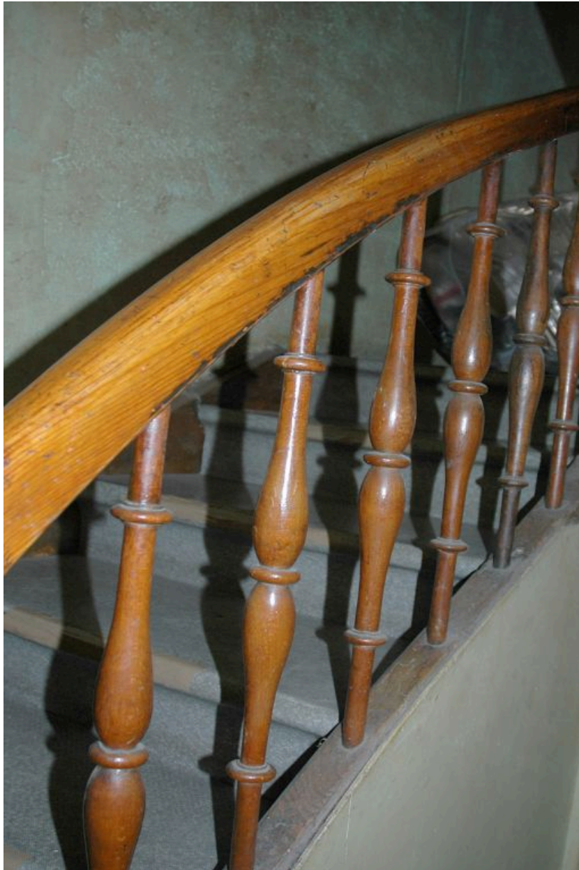
Rampe d'escalier avec garde-corps en bois tourné.