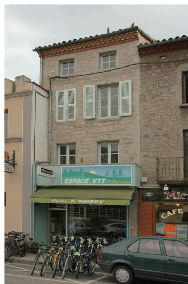
Vue générale IVR82_20114201346NUCA