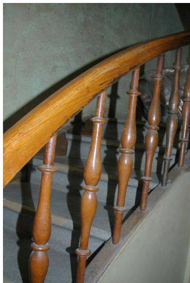
Rampe d'escalier avec garde-corps en bois tourné.