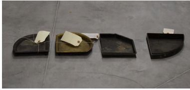
Vue générale IVR84_20226301093NUC4A