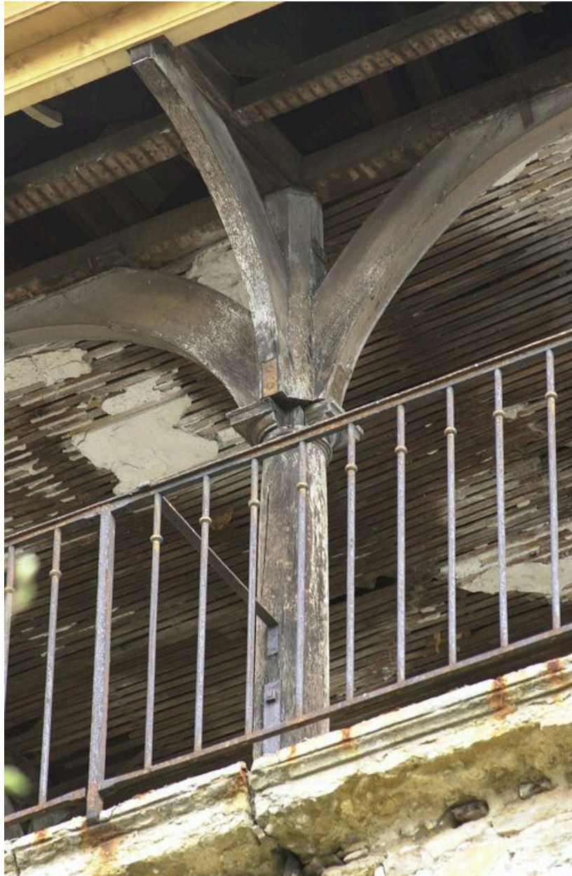
Détail d'une colonne en bois supportant la toiture