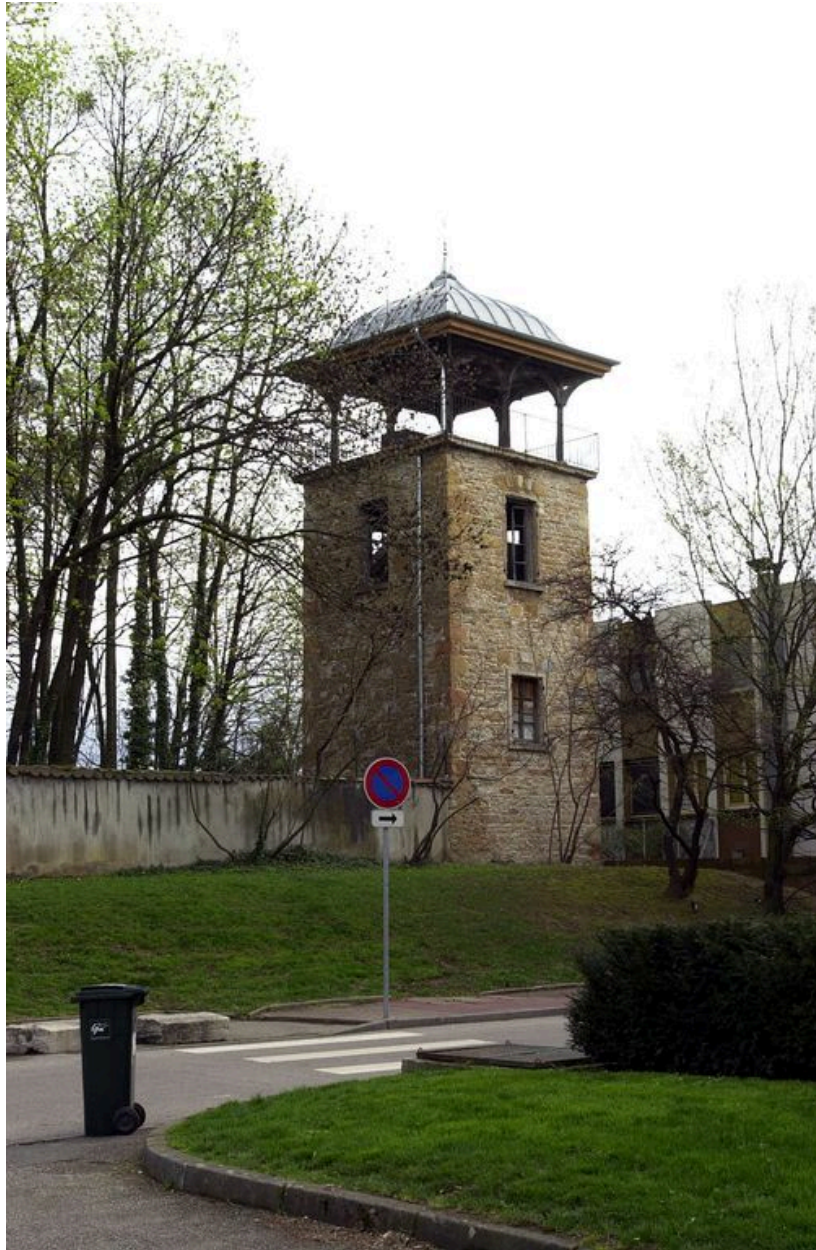
Vue générale de la tour-belvédère