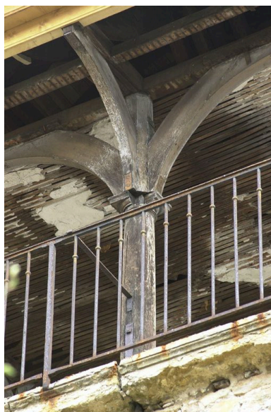
Détail d'une colonne en bois supportant la toiture IVR82_20026901535NUCA