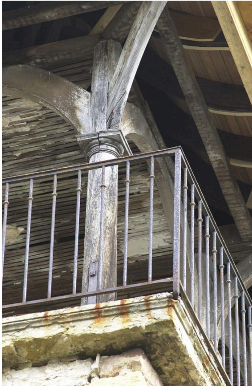
Détail de la colonne d'angle supportant la toiture