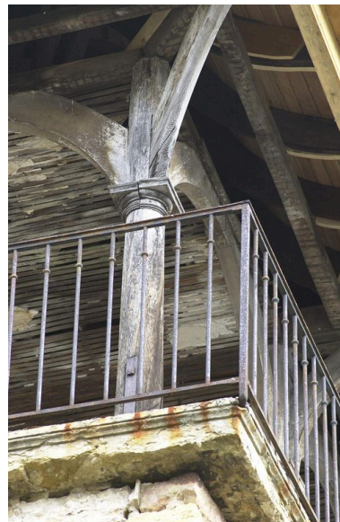
Détail de la colonne d'angle supportant la toiture