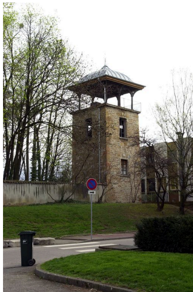
Vue générale de la tour-belvédère