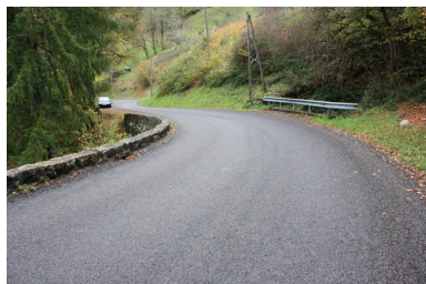
Ponceau des Mouilles, contexte chaussée et garde corps IVR84_20207401495NUCA