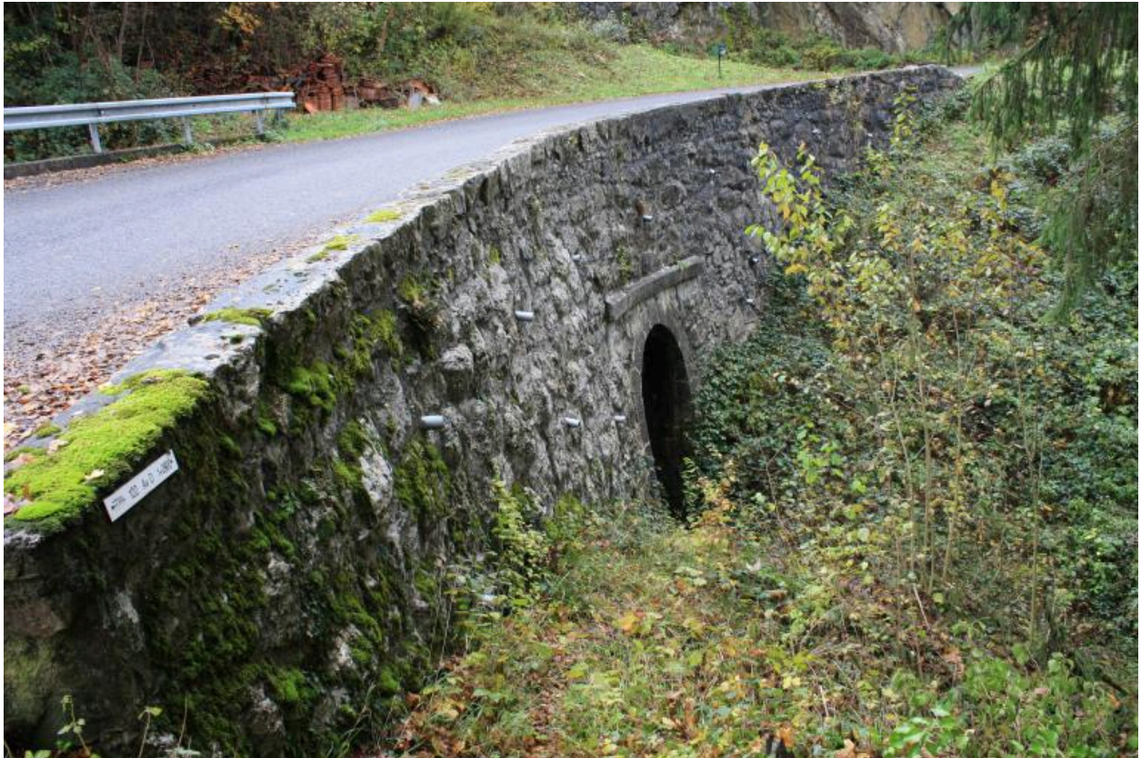
Ponceau des Mouilles, face en aval