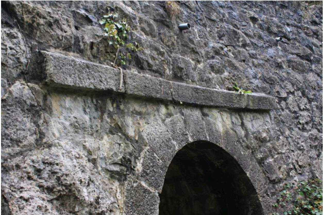
Ponceau des Mouilles, détail voûte