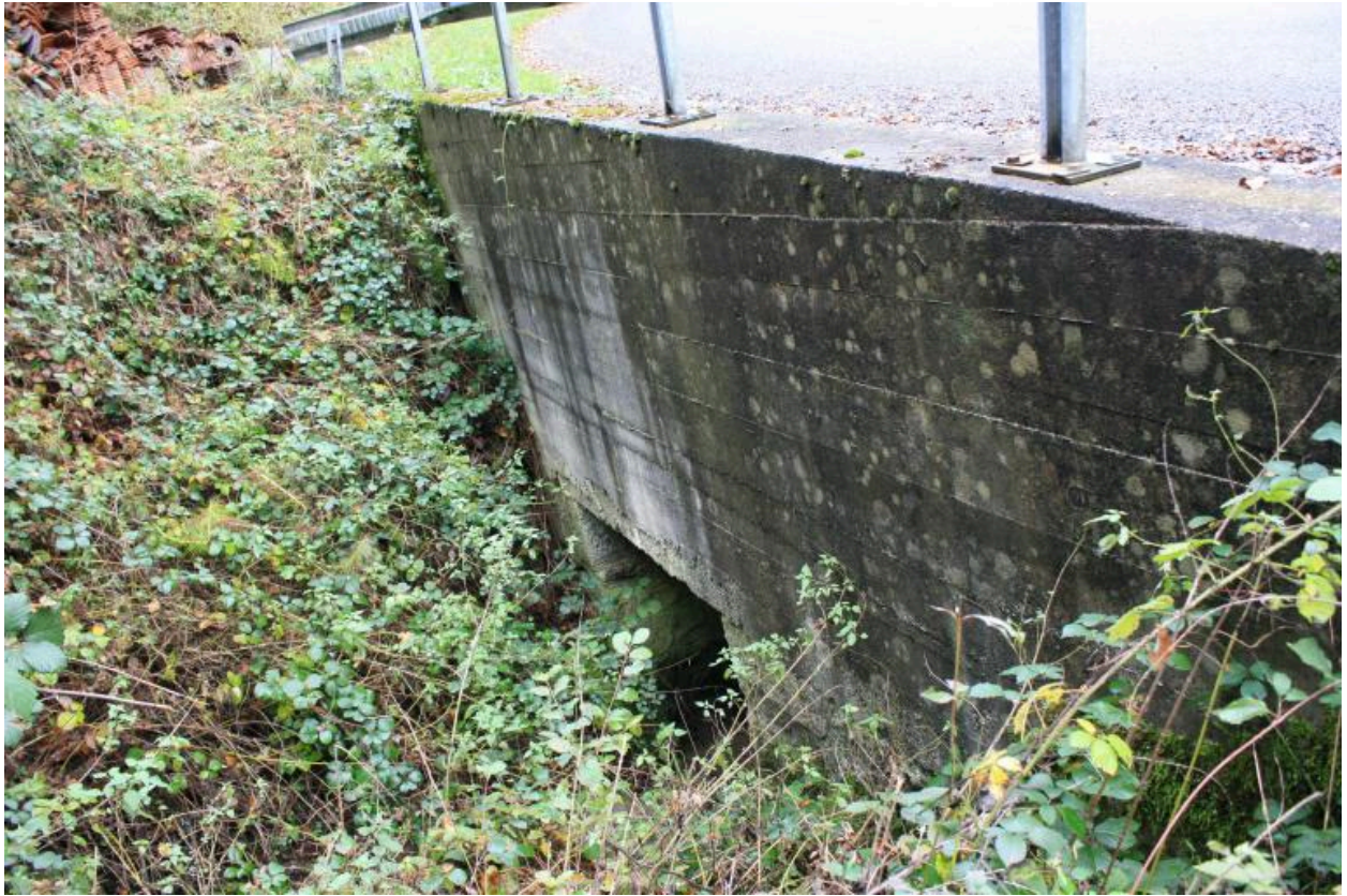
Ponceau des Mouilles, face amont