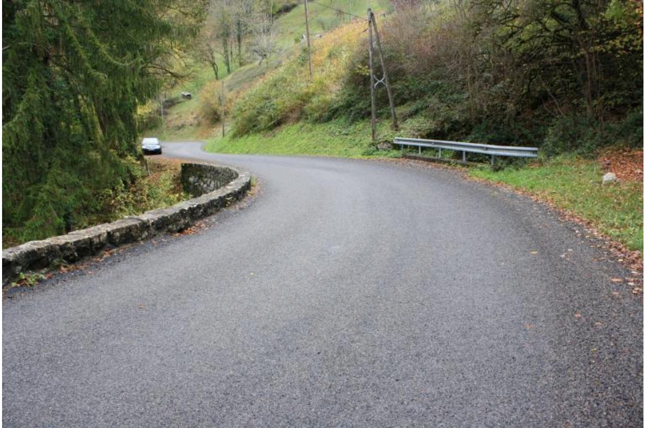
Ponceau des Mouilles, contexte chaussée et garde corps