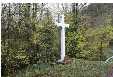
Ponceau des Mouilles, contexte