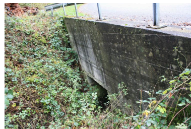
Ponceau des Mouilles, face amont IVR84_20207401497NUCA