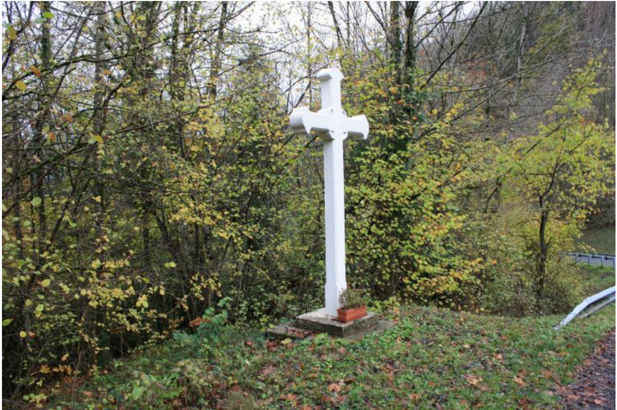
Ponceau des Mouilles, contexte