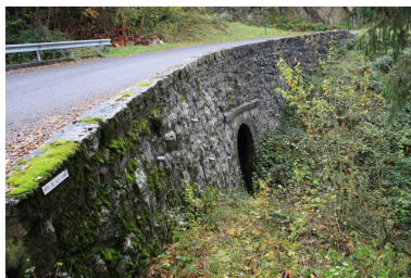
Ponceau des Mouilles, face en aval IVR84_20207401496NUCA