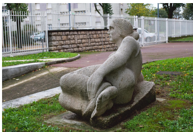
Vue de trois-quarts dos.