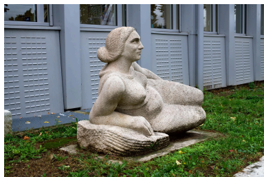
Vue de trois-quarts face.