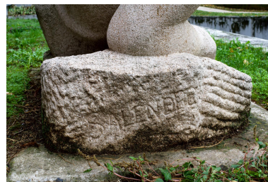
Signature. IVR84_20196900667NUCA