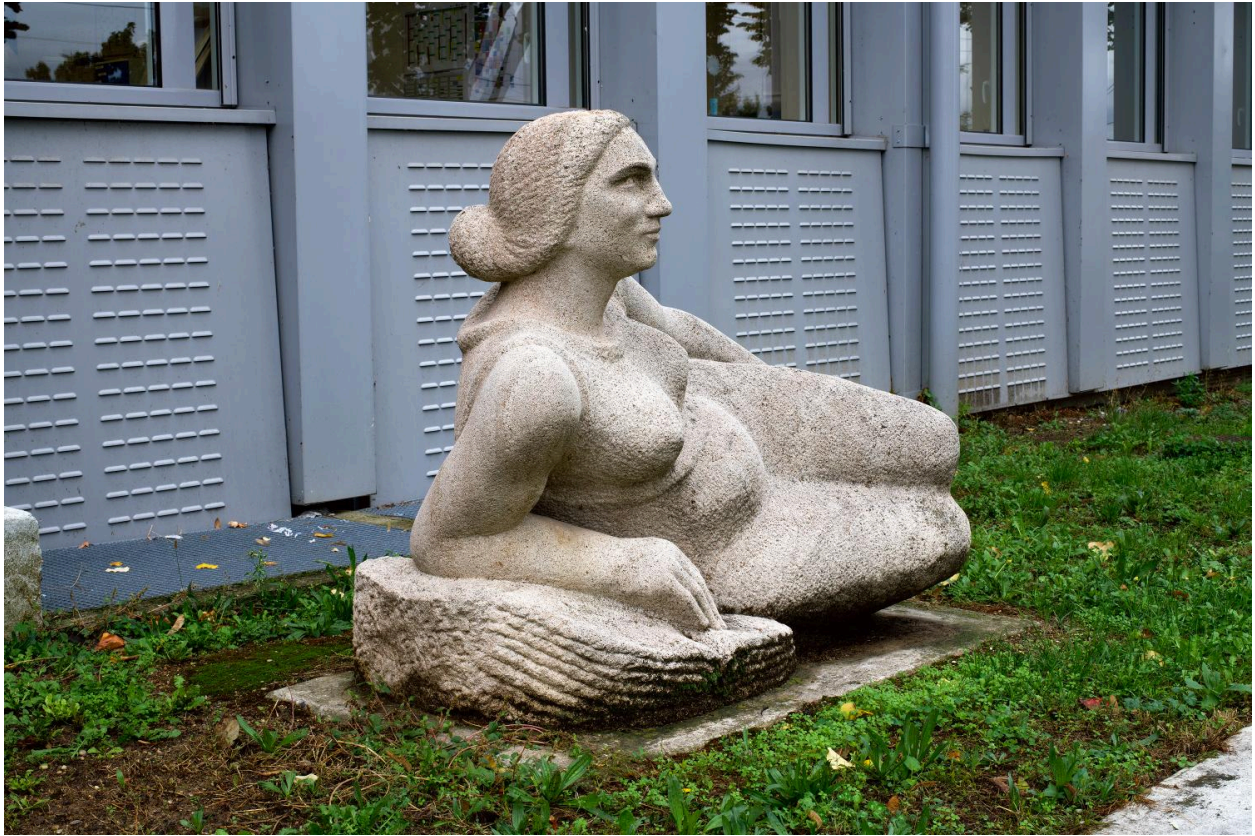
Vue de trois-quarts face.