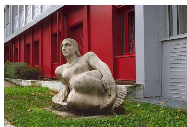
Vue de trois-quarts face.