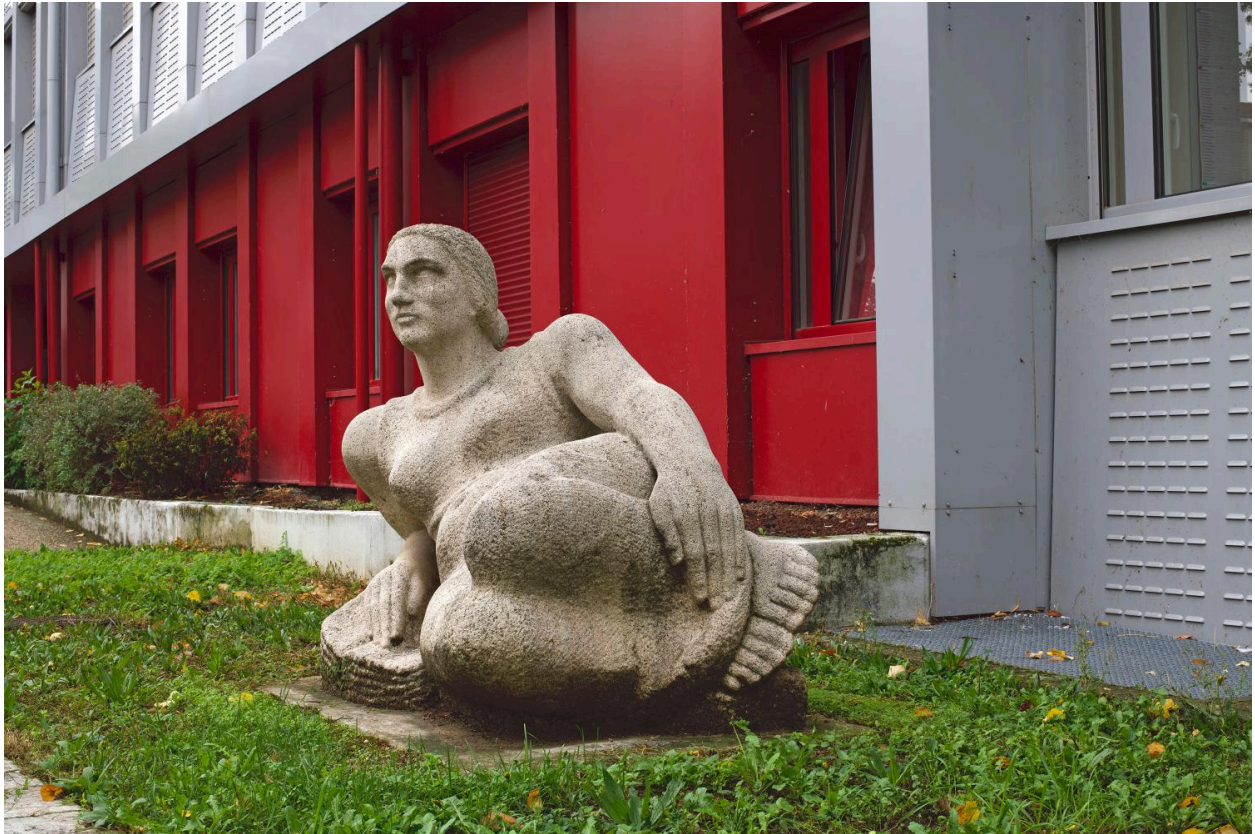
Vue de trois-quarts face.