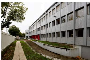
L'œuvre dans son contexte.