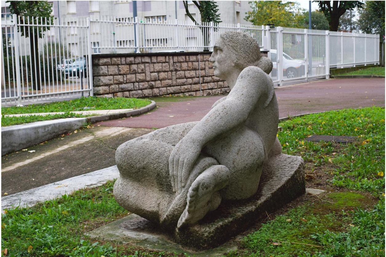
Vue de trois-quarts dos.