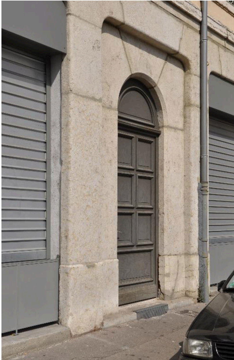
Elévation postérieure, la porte du 14 rue Saint-André