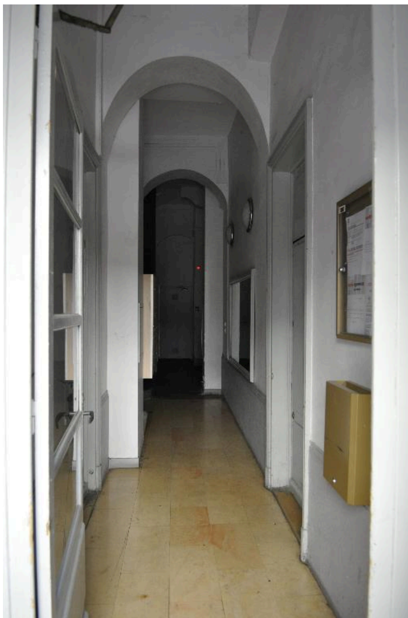
Vue intérieure : l'allée du 29 rue de Marseille