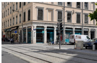
Elévation latérale, vue rapprochée du rez-de-chaussée IVR84_20166900692NUCA