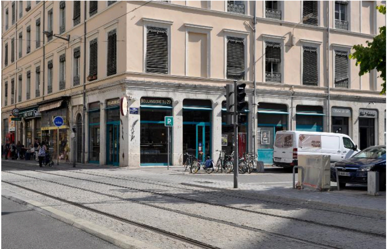
Elévation latérale, vue rapprochée du rez-de-chaussée