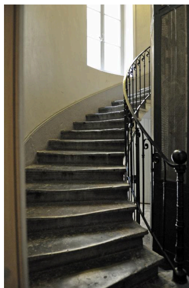
Vue intérieure : le départ de l'escalier du 29 rue de Marseille