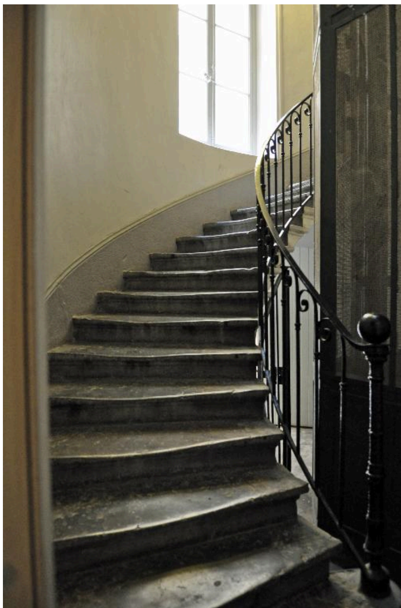
Vue intérieure : le départ de l'escalier du 29 rue de Marseille