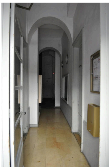
Vue intérieure : l'allée du 29 rue de Marseille IVR84_20166900696NUCA