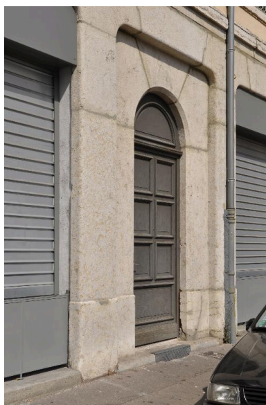
Elévation postérieure, la porte du 14 rue Saint-André