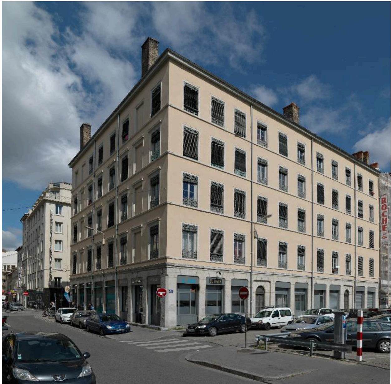
Vue d'ensemble, depuis le sud-est : élévations postérieure et latérale