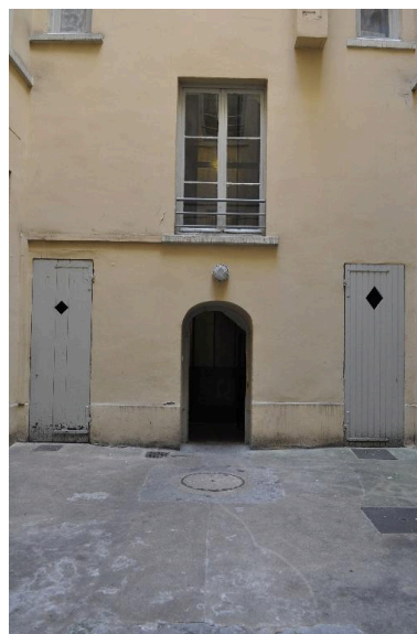
Vue de la cour IVR84_20166900694NUCA