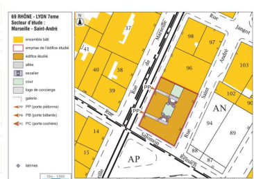
Plan masse et schéma de distribution IVR84_20196900034NUDA