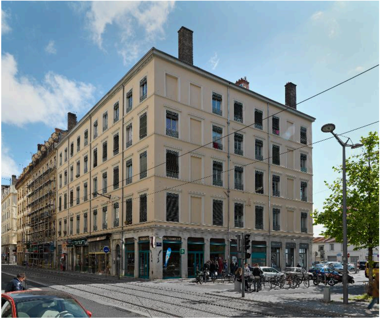
Vue d'ensemble, depuis le sud-ouest : élévations antérieure et latérale