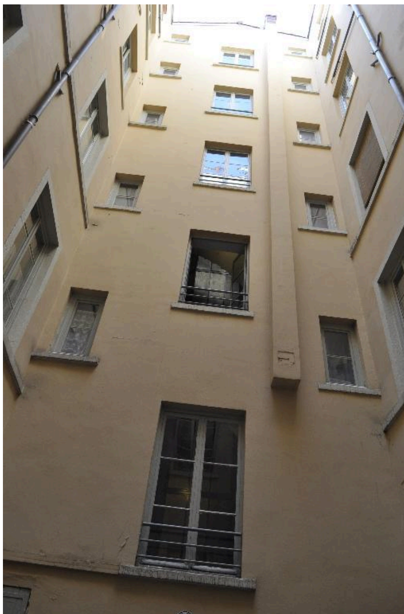
Elévations sur cour, vue de la cage d'escalier