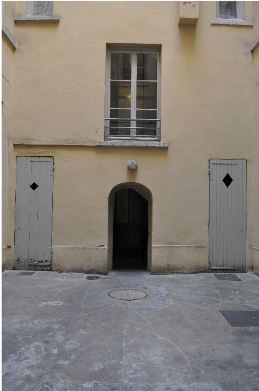
Vue de la cour