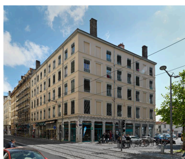
Vue d'ensemble, depuis le sud-ouest : élévations antérieure et latérale