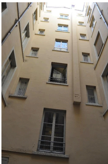
Elévations sur cour, vue de la cage d'escalier