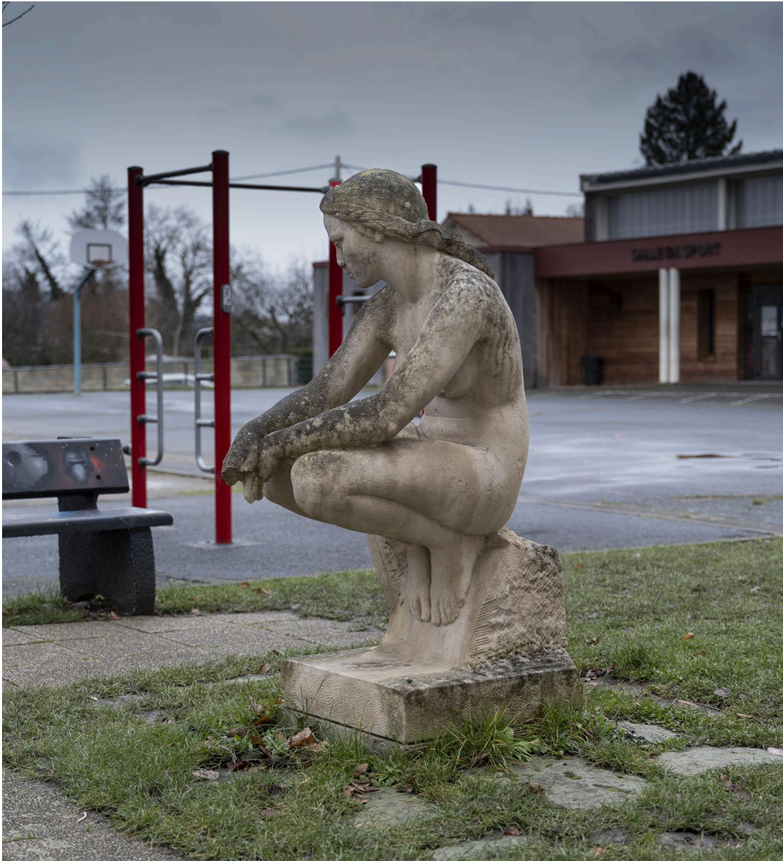
Vue de profil gauche