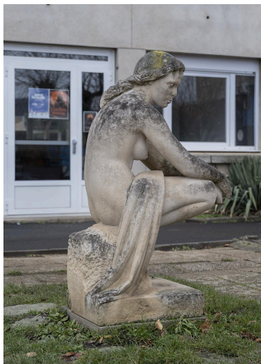
Vue de profil droit IVR84_20266300212NUCA