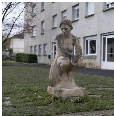
Vue de face IVR84_20266300209NUCA