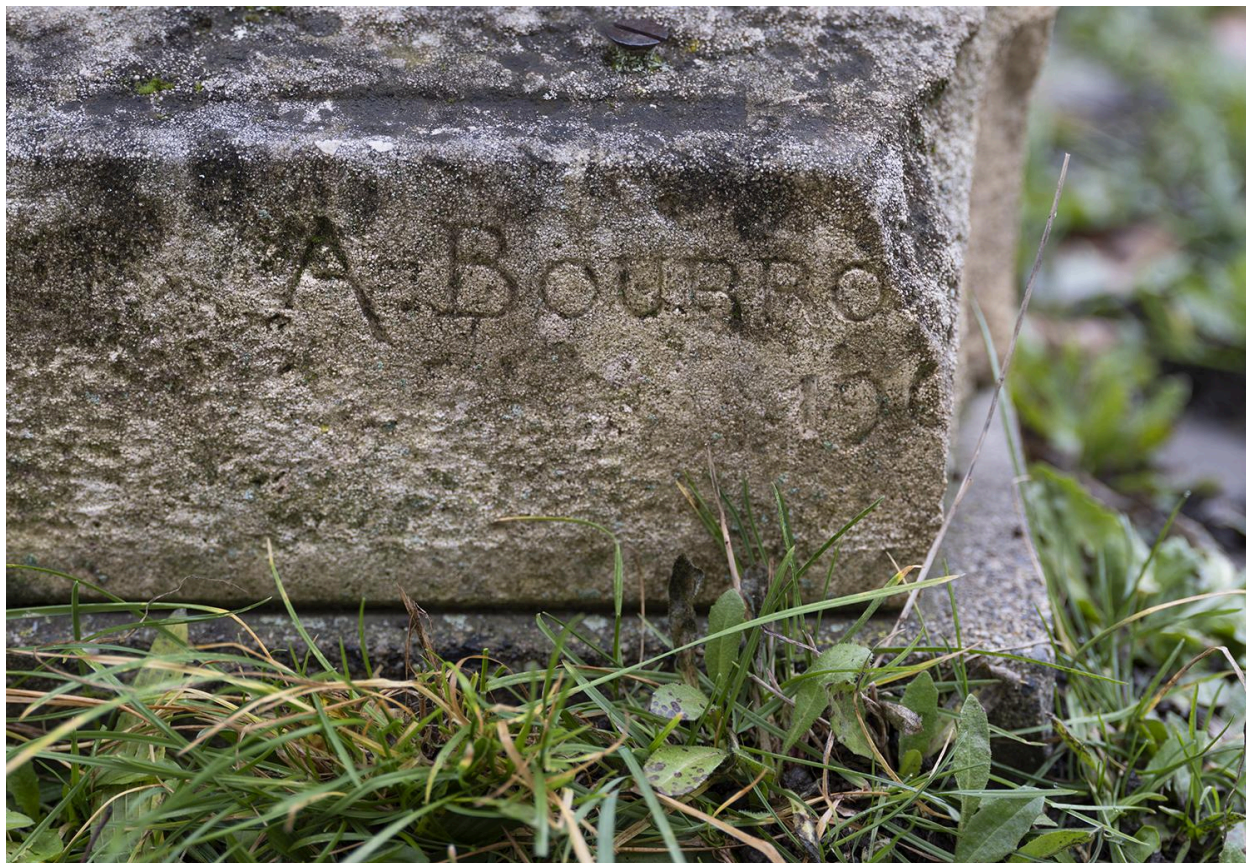
Détail : signature