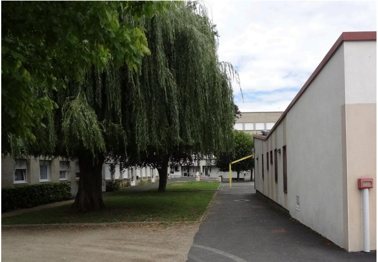
Vue de la statue dans son environnement