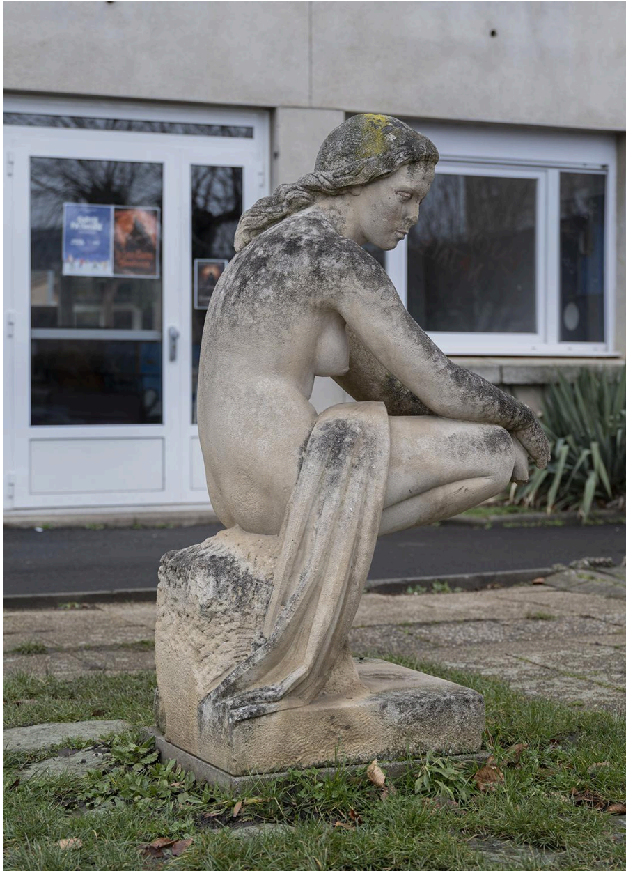
Vue de profil droit