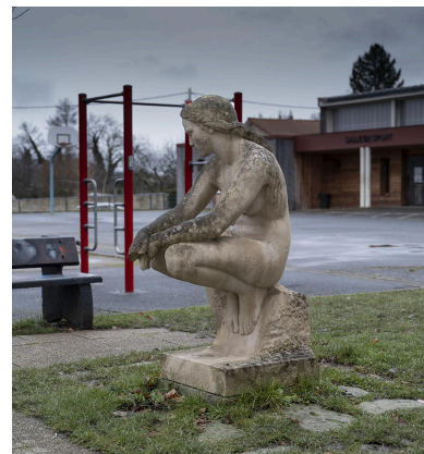
Vue de profil gauche IVR84_20266300210NUCA