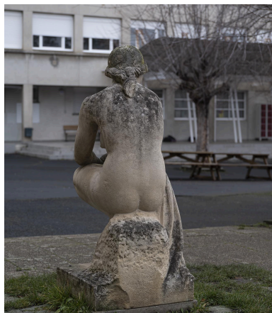
Vue de dos IVR84_20266300211NUCA