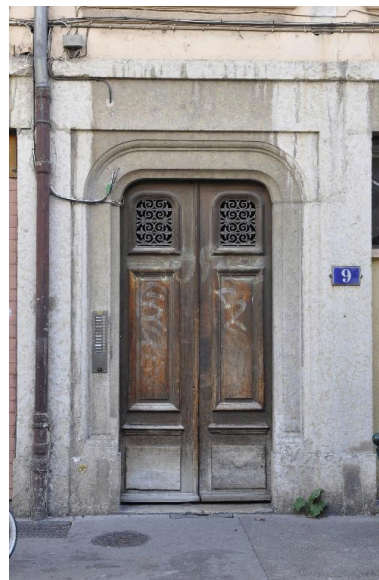
Porte d'entrée IVR84_20166902142NUCA