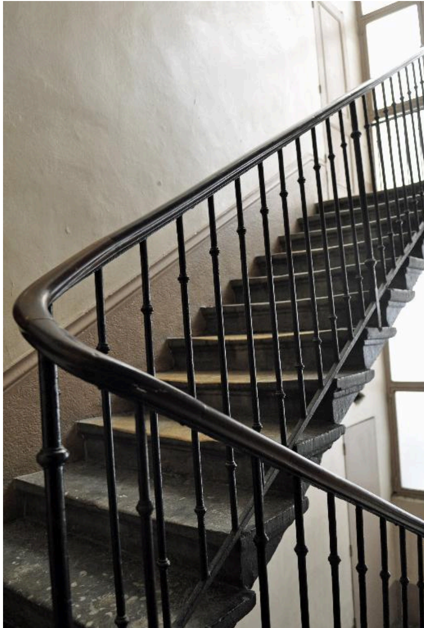
Vue intérieure : l'escalier, anciennement à cage ouverte