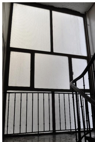
Vitrage fermant la cage d'escalier IVR84_20166902145NUCA