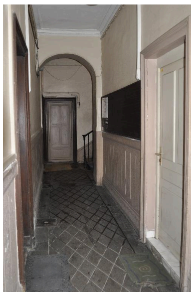
Vue intérieure : l'allée IVR84_20166902143NUCA