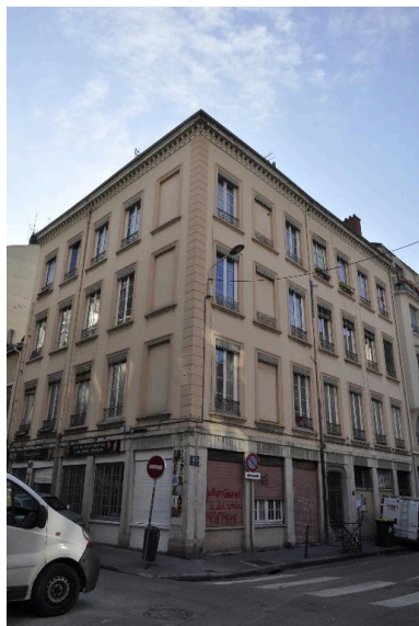
Vue d'ensemble IVR84_20166902140NUCA