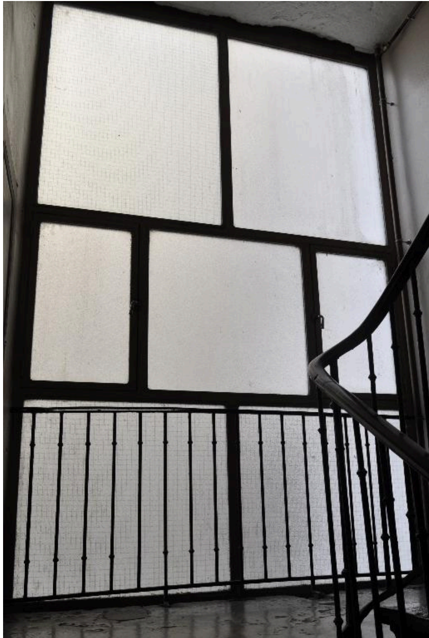
Vitrage fermant la cage d'escalier