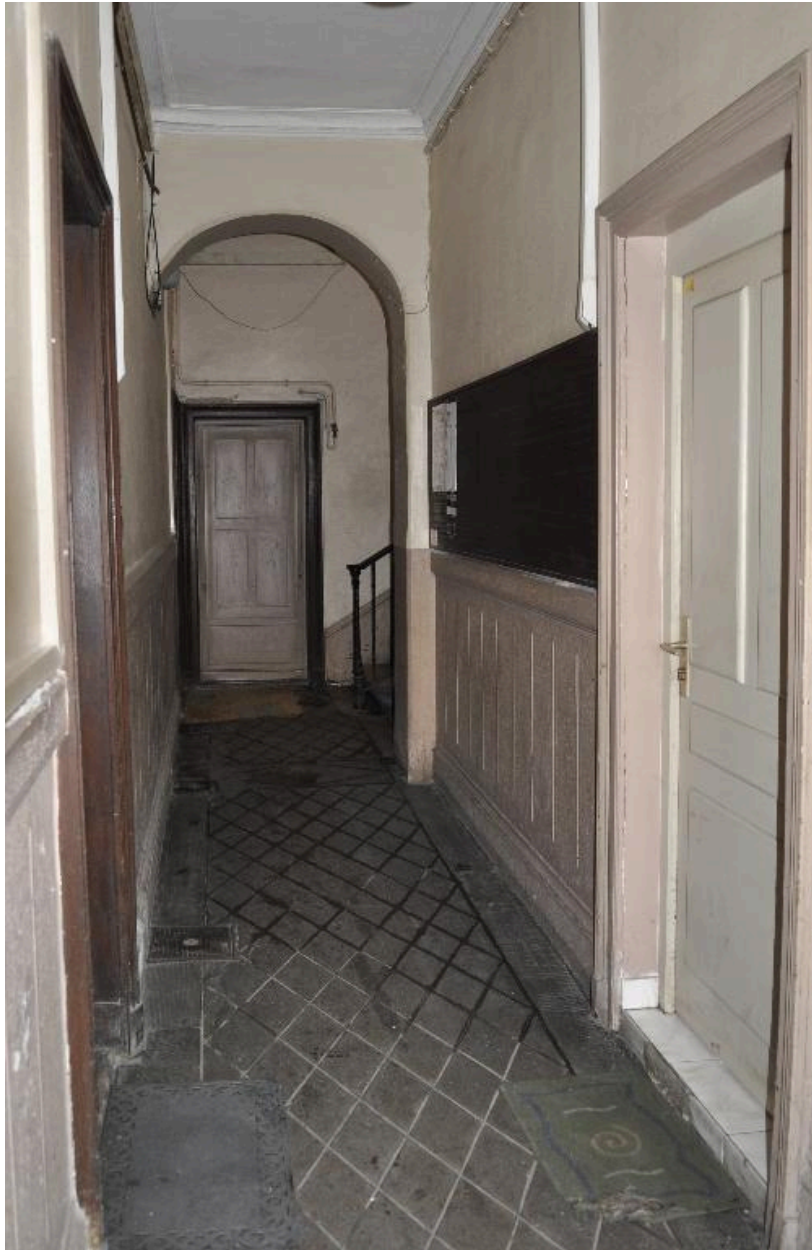
Vue intérieure : l'allée