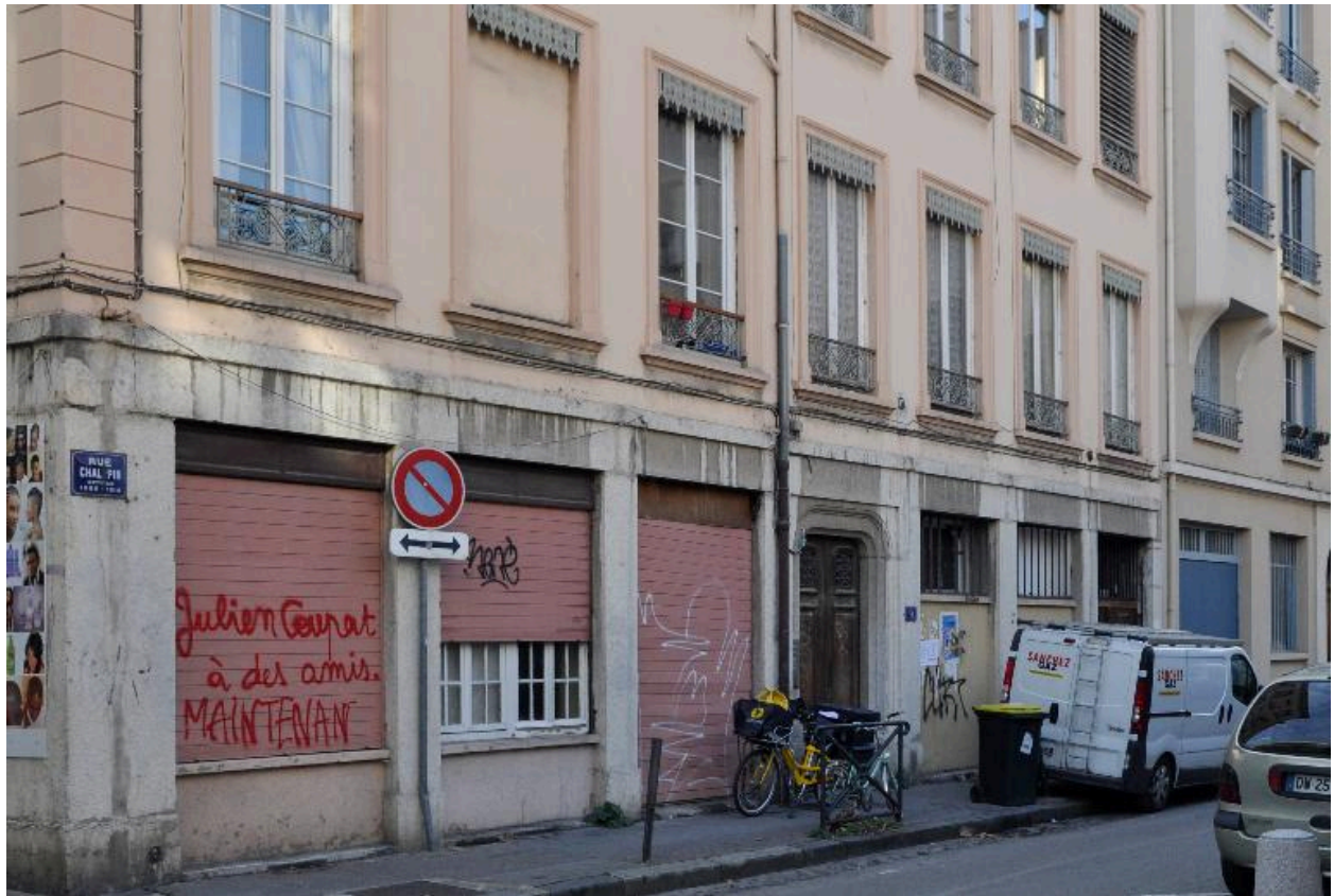
Anciennes boutiques au rez-de-chaussée