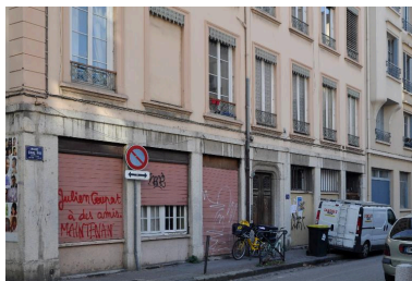
Anciennes boutiques au rez-de-chaussée IVR84_20166902141NUCA