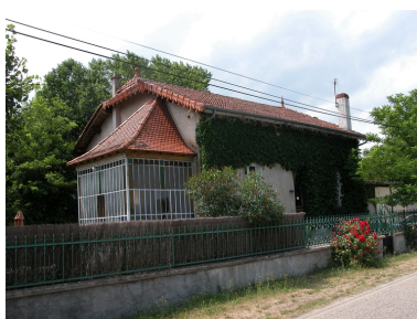
Vue générale. IVR82_20134200932NUCA