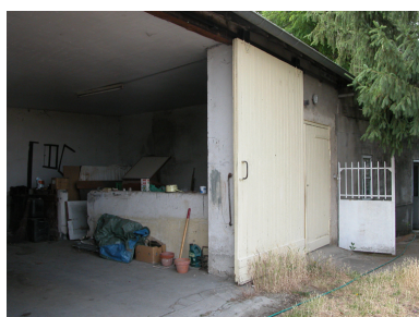
Vue de la porcherie.