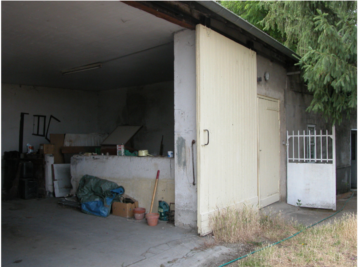
Vue de la porcherie.