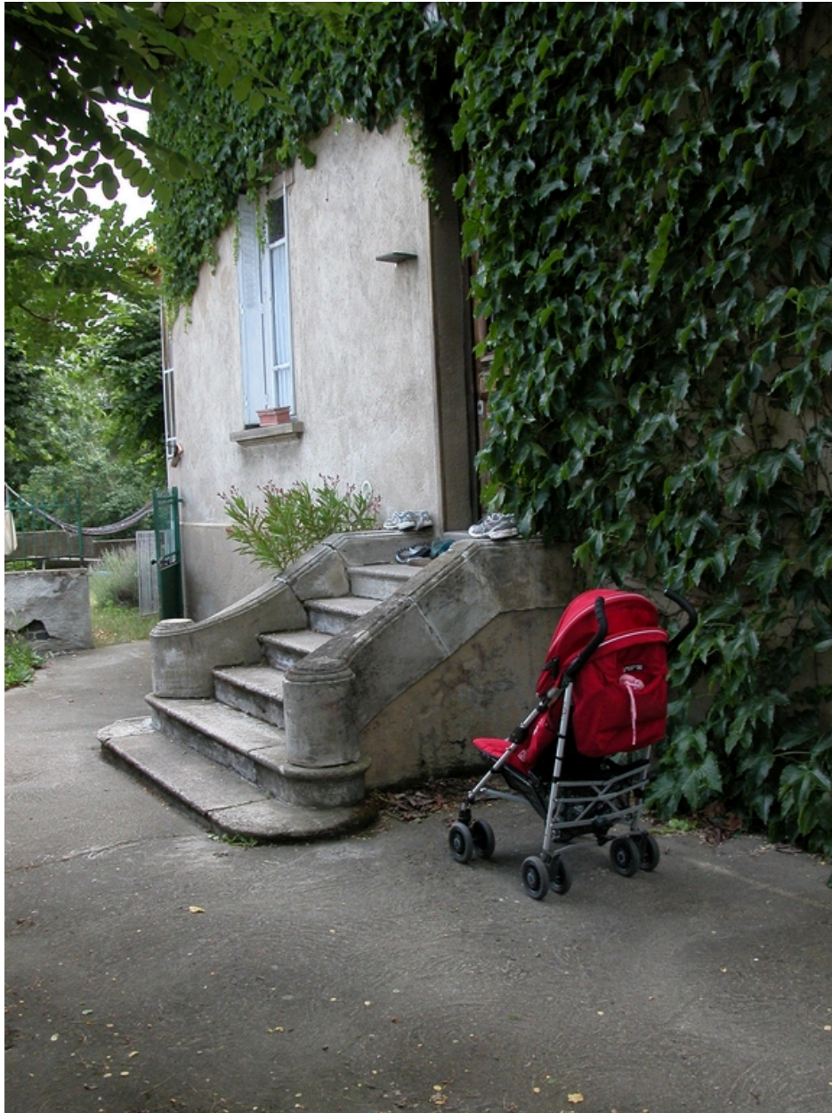
Détail du perron.