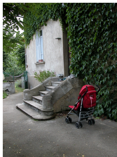
Détail du perron.