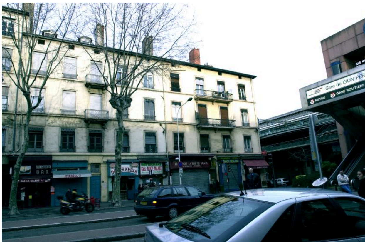
Vue générale, cours Charlemagne