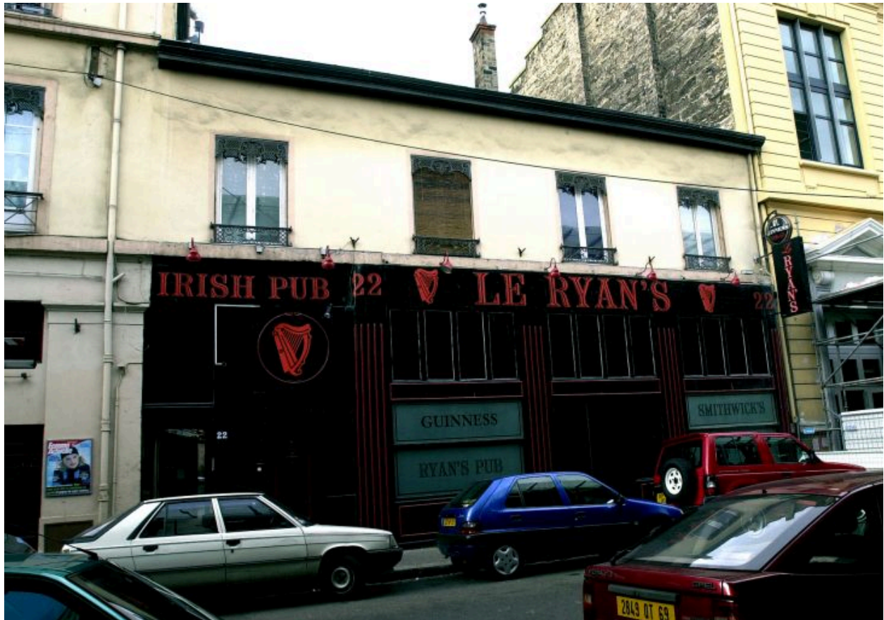
Elévation 22 rue Dugas-Montbel