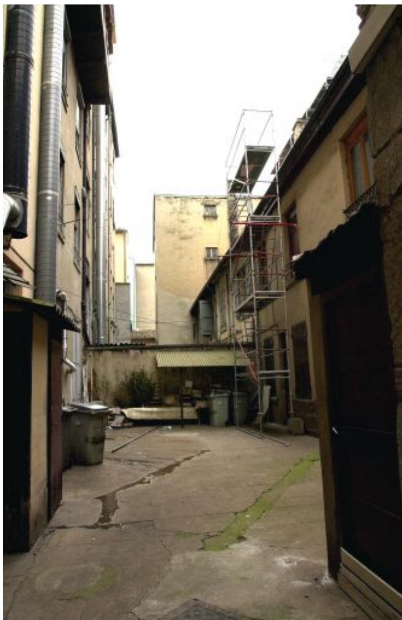
Vue d'ensemble de la cour depuis le nord