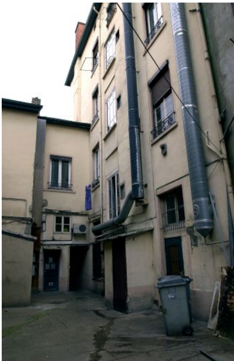
Elévation sur cour