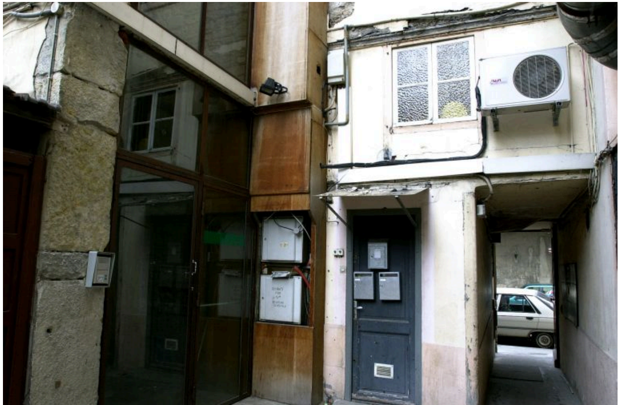
Vue du passage depuis la cour vers la rue Dugas-Montbel