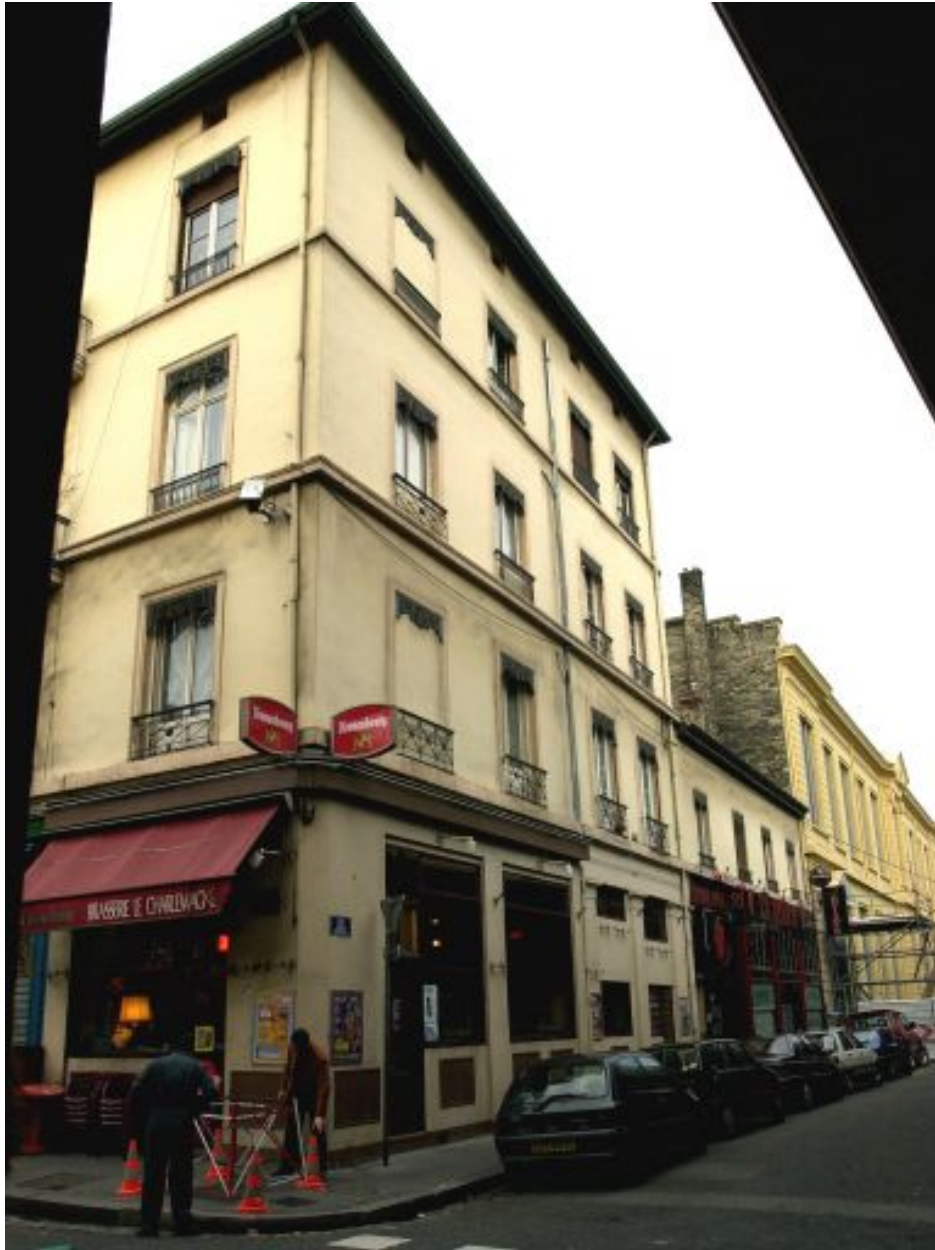
Angle du cours Charlemagne et de la rue Dugas-Montbel