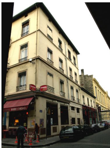
Angle du cours Charlemagne et de la rue Dugas-Montbel