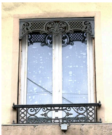
Détail d'un lambrequin, rue Dugas-Montbel IVR82_20016900225NUCA