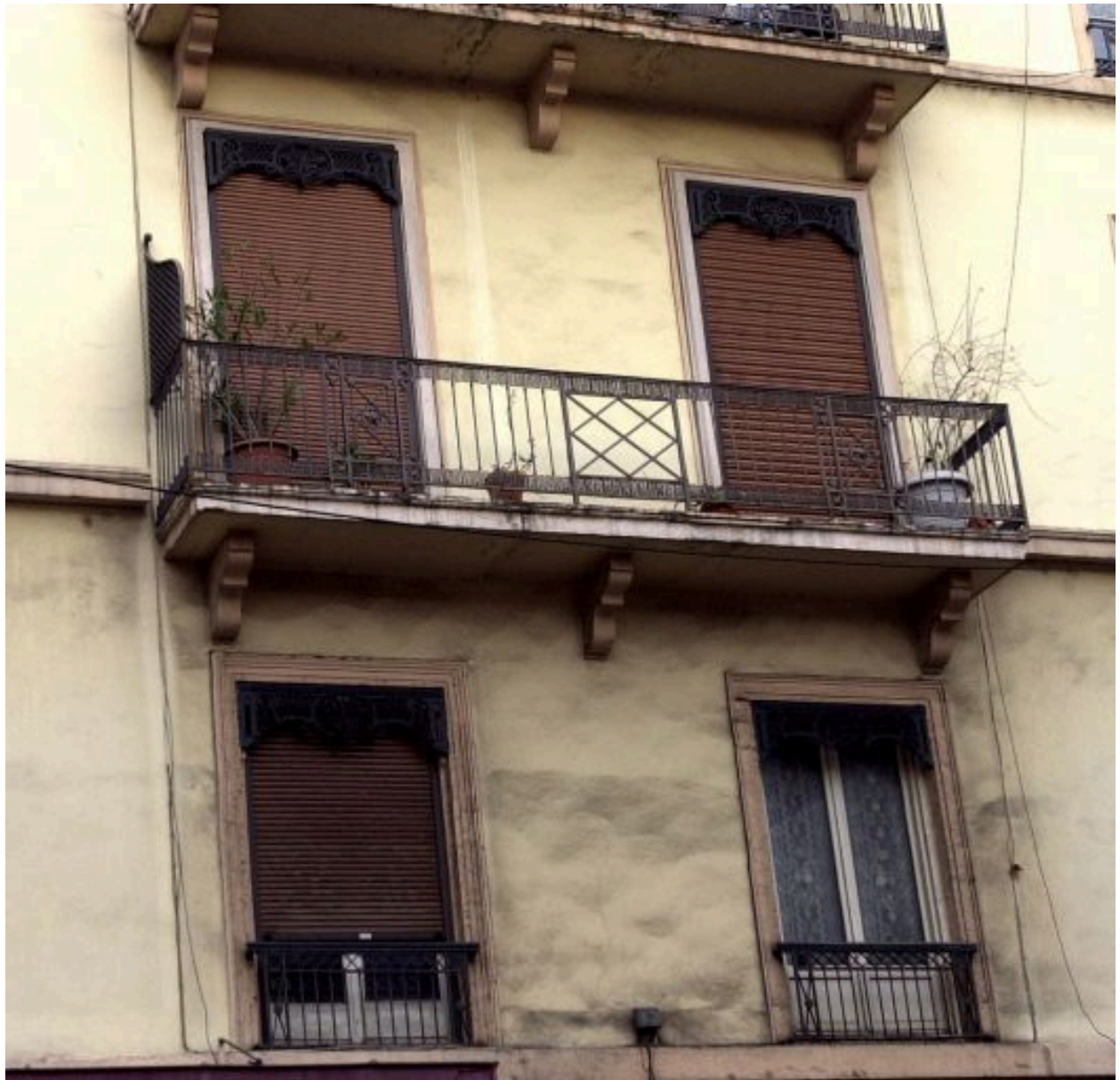
Détail de la travée centrale, 2 cours Charlemagne