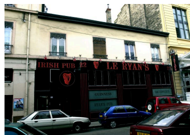
Élévation 22 rue Dugas-Montbel IVR82_20016900221NUCA