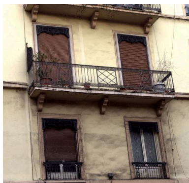
Détail de la travée centrale, 2 cours Charlemagne