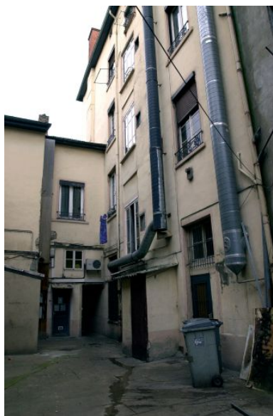
Elévation sur cour IVR82_20016900218NUCA