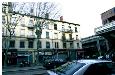
Vue générale, cours Charlemagne IVR82_20016900213NUCA