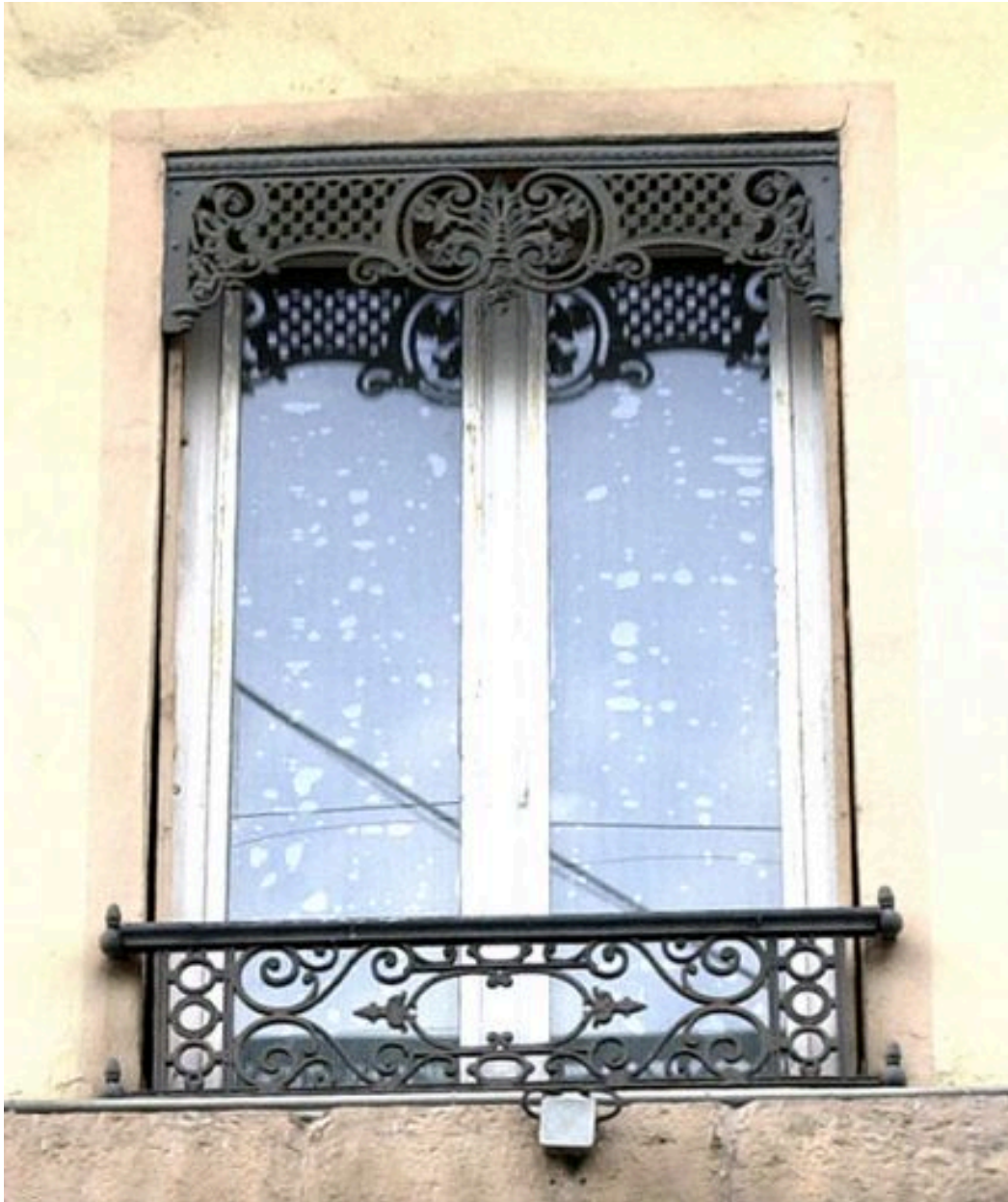
Détail d'un lambrequin, rue Dugas-Montbel