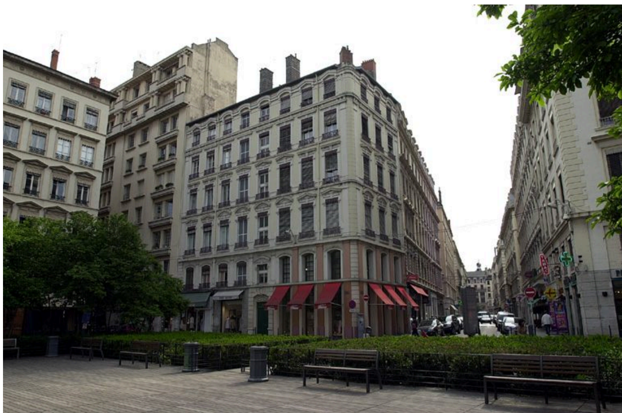
Vue de situation depuis la place des Célestins