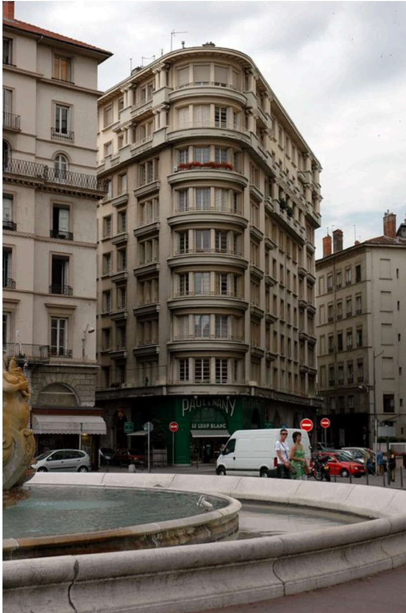
Vue générale depuis la place des Jacobins