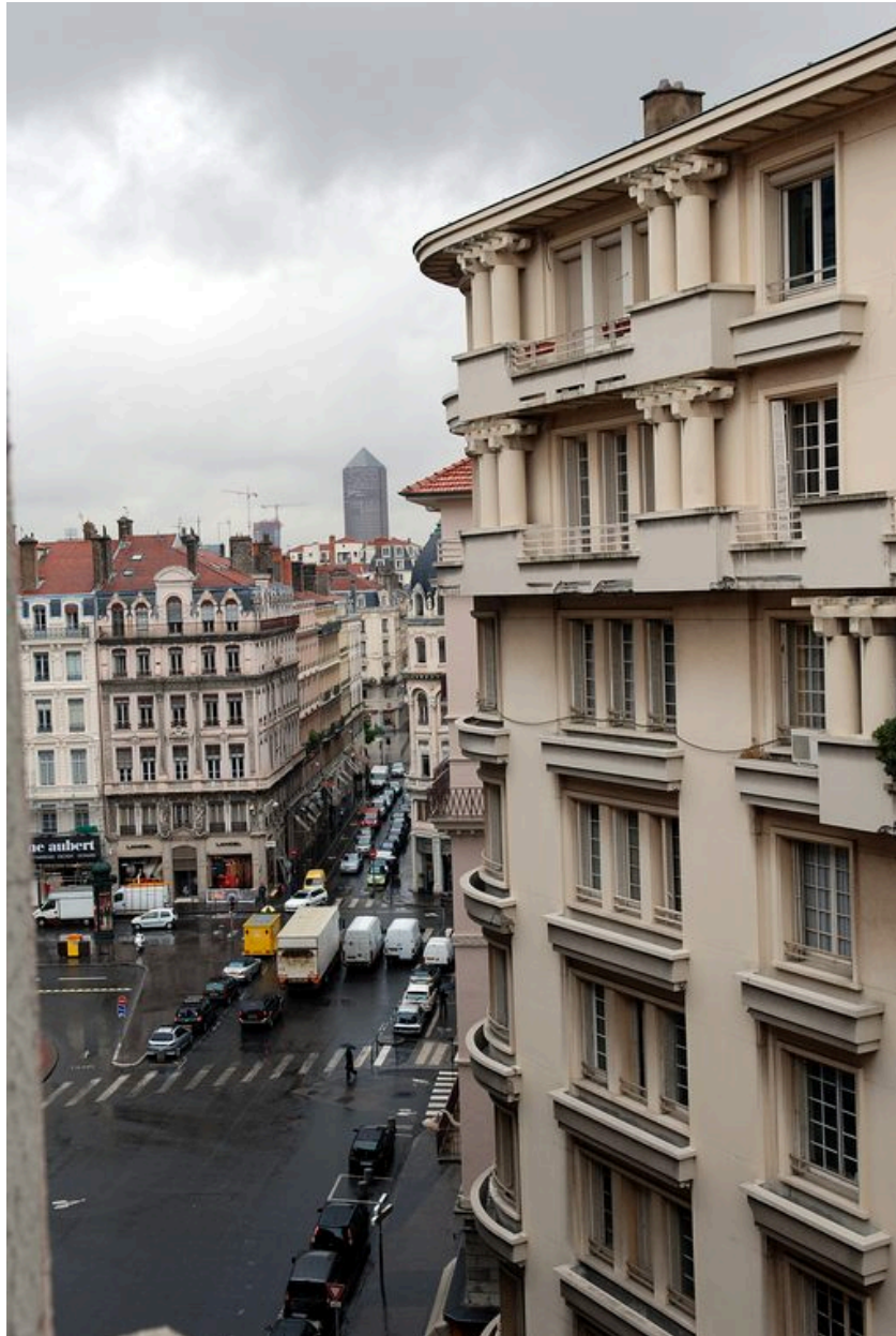
Au premier plan, vue partielle depuis le groupe scolaire Lamartine