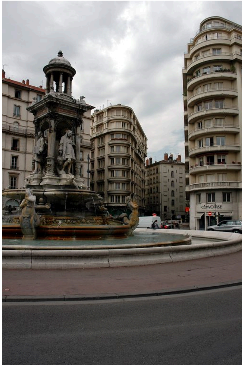
Vue de situation depuis la place des Jacobins : l'immeuble se trouve au milieu