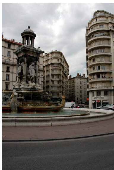
Vue de situation depuis la place des Jacobins : l'immeuble se trouve au milieu