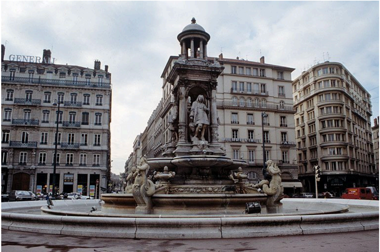
Vue de situation depuis la place des Jacobins