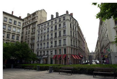
Vue de situation depuis la place des Célestins