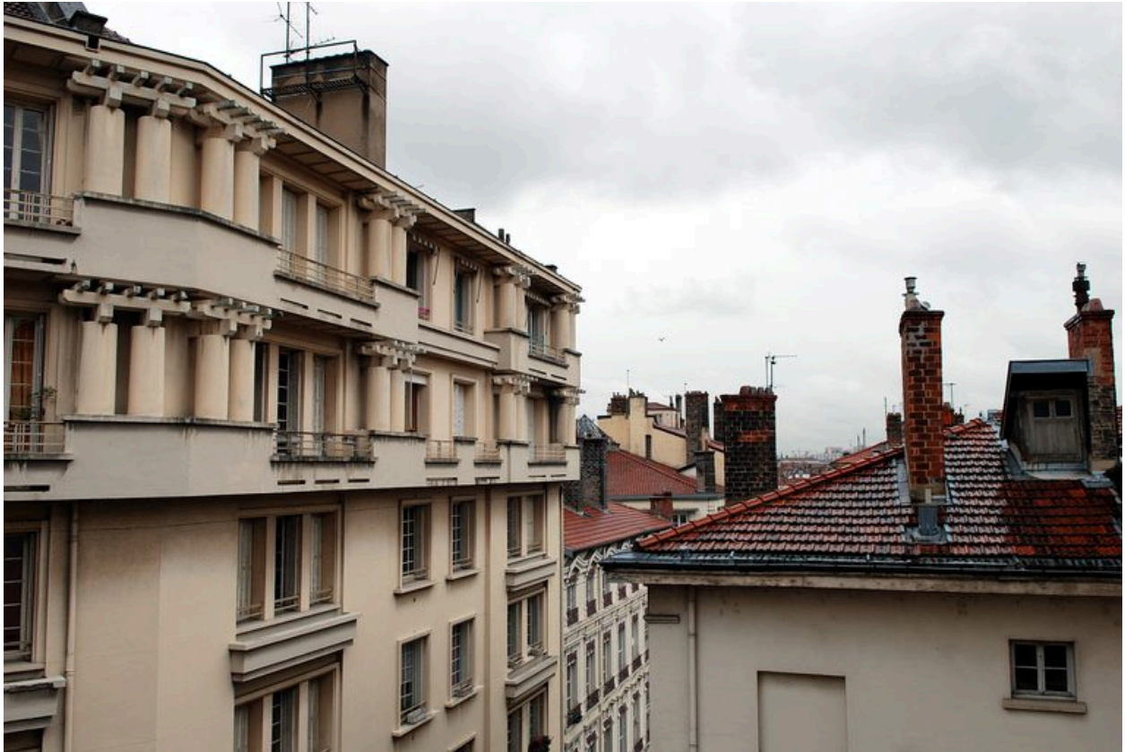
Vue partielle depuis le groupe scolaire Lamartine