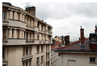
Vue partielle depuis le groupe scolaire Lamartine IVR82_20096903121NUCA