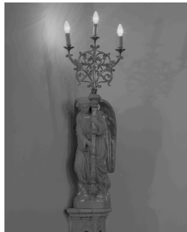
Ange lampadophore, de la paire ornant le chœur. IVR82_19982600326X