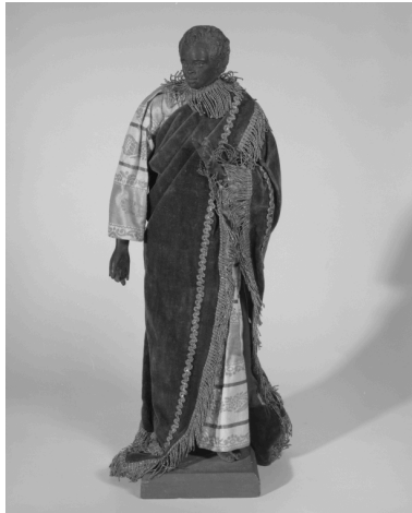
Santon : le roi mage Gaspard.