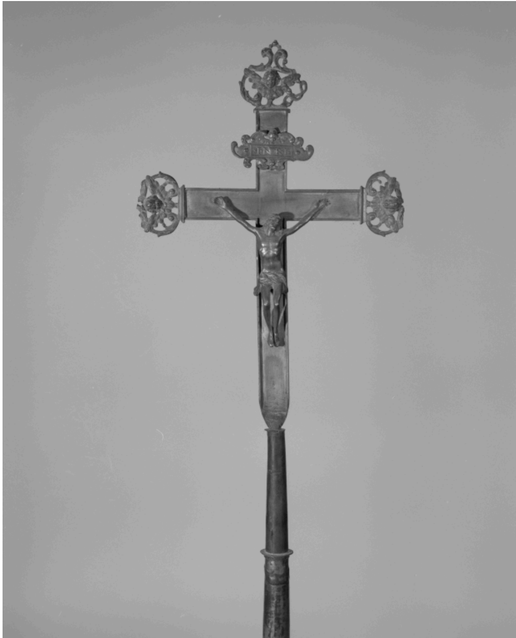
Croix de procession n° 2, vue partielle.