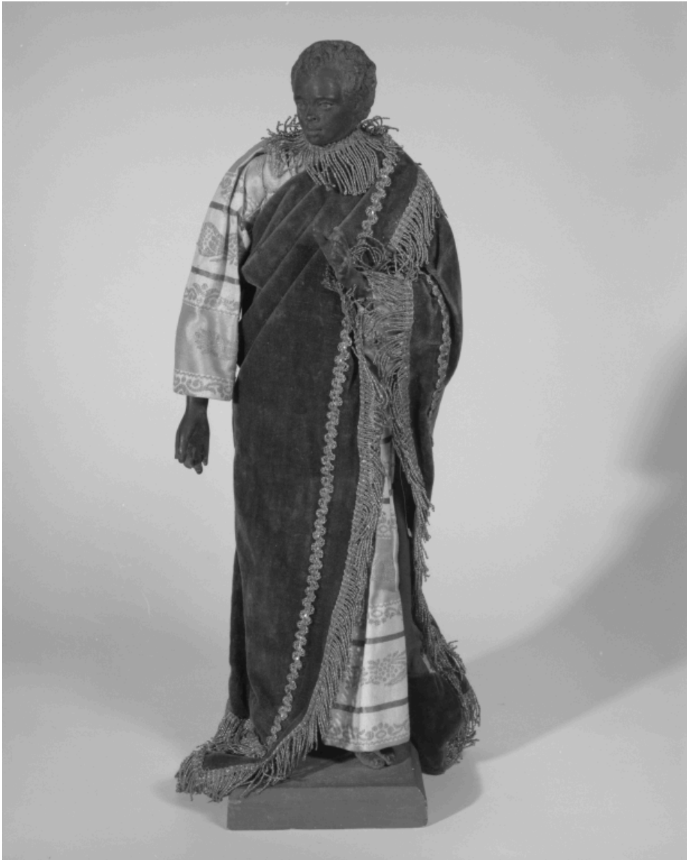
Santon : le roi mage Gaspard.