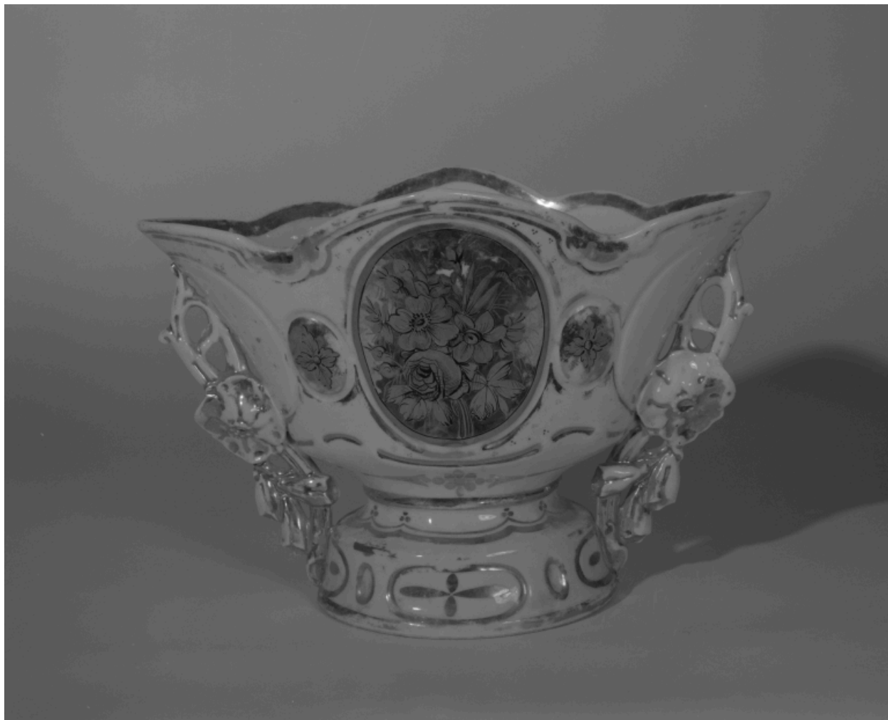
Vase d'autel n° 1.