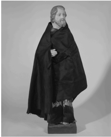
Santon : saint Joseph. IVR82_19982600333X