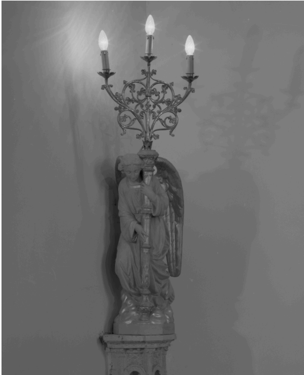
Ange lampadophore, de la paire ornant le chœur.