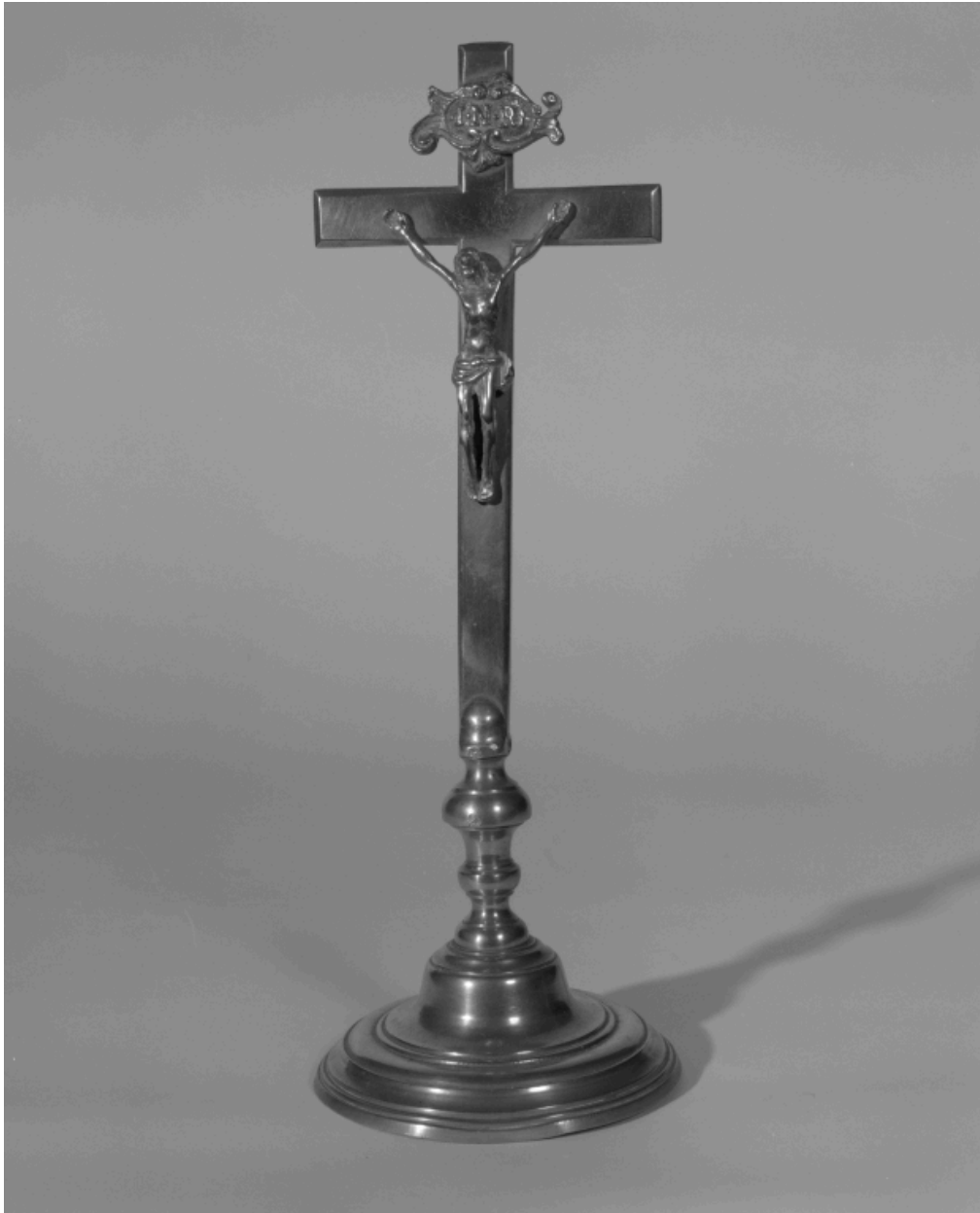
Croix de sacristie n° 1.