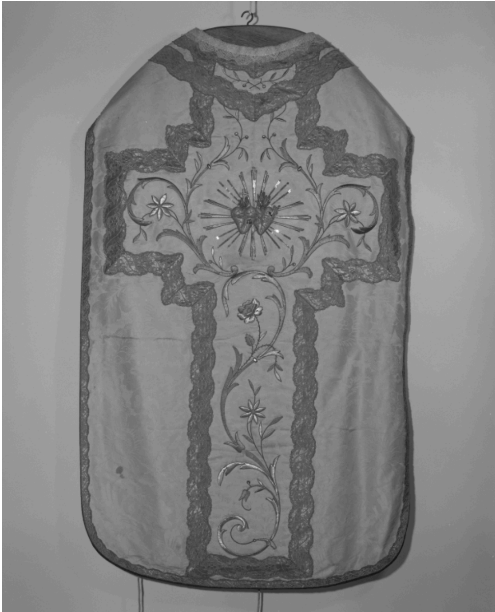
Chasuble blanche, vue de dos.