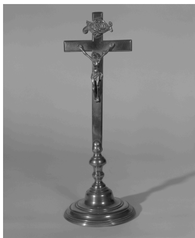
Croix de sacristie n° 1. IVR82_19982600327X