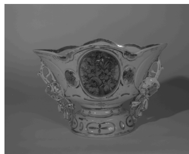
Vase d'autel n° 1. IVR82_19982600329X