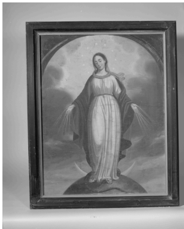
Tableau : Immaculée Conception.