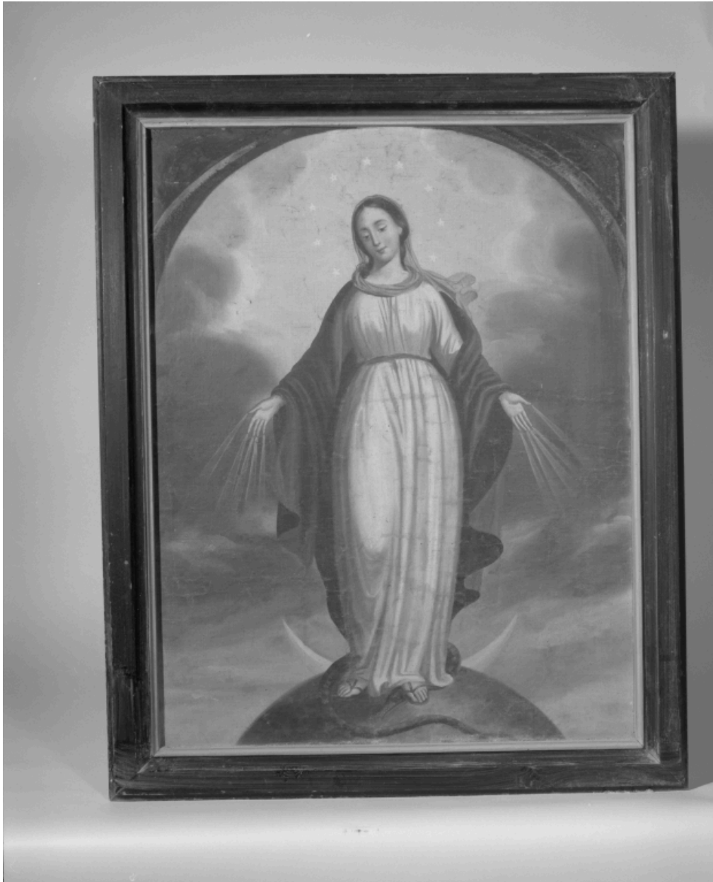
Tableau : Immaculée Conception.