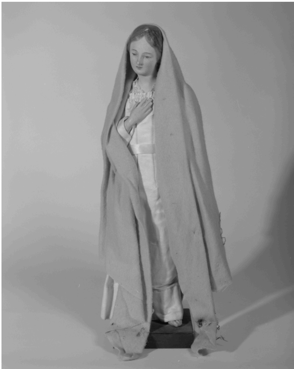
Santon : la Vierge.