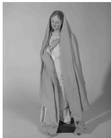
Santon : la Vierge.