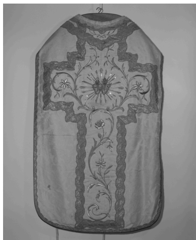
Chasuble blanche, vue de dos. IVR82_19982600330X