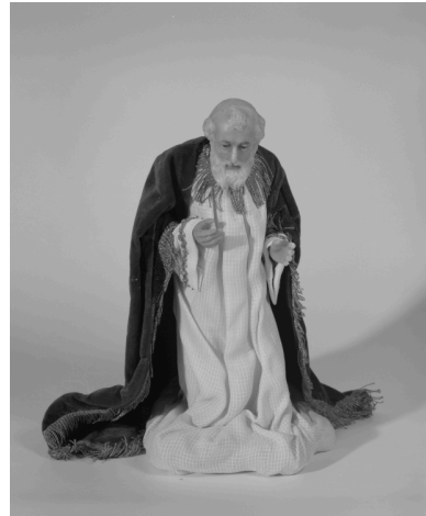
Santon en cire : Melchior ou Balthazar, roi mage. IVR82_19982600335X