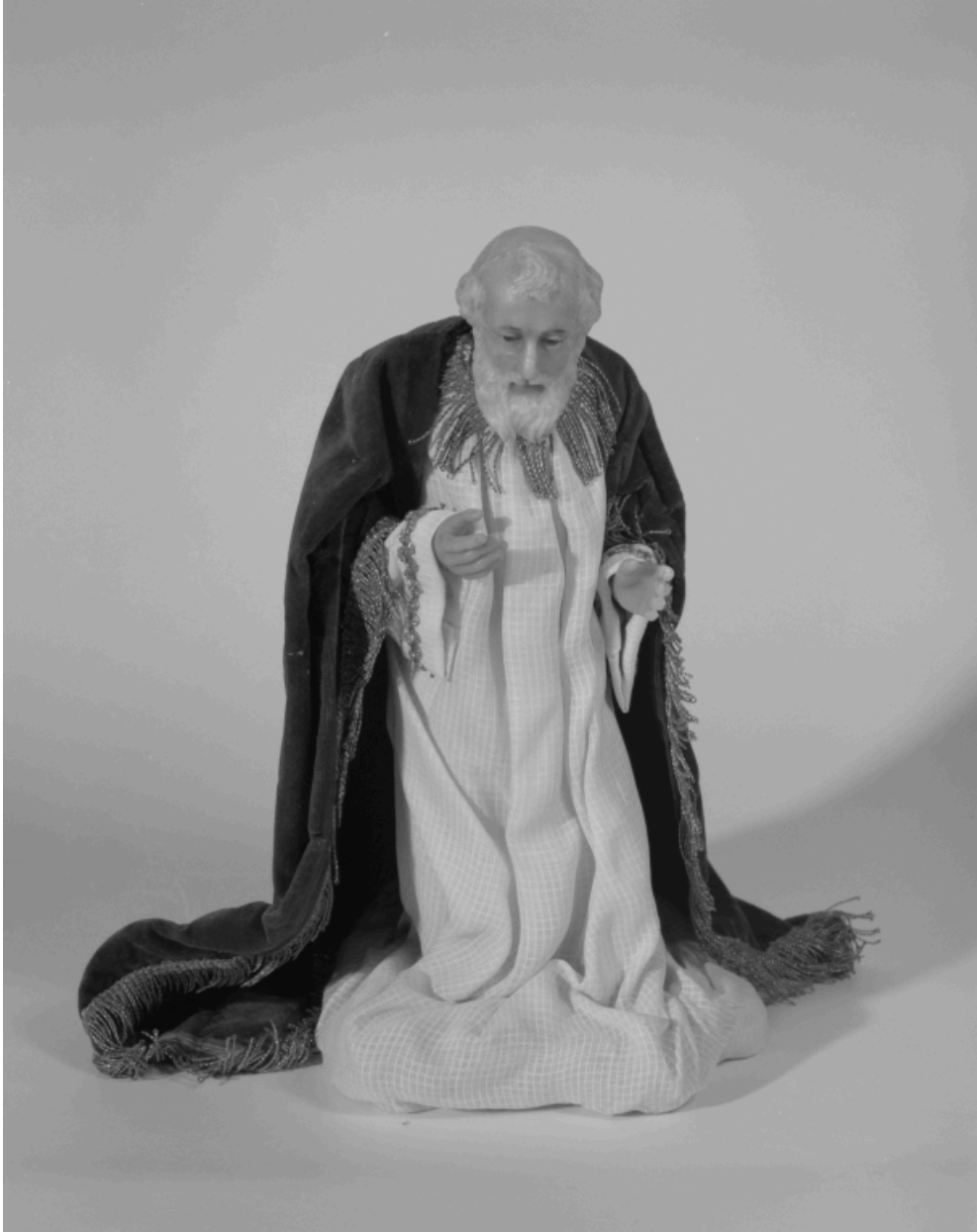
Santon en cire : Melchior ou Balthazar, roi mage.