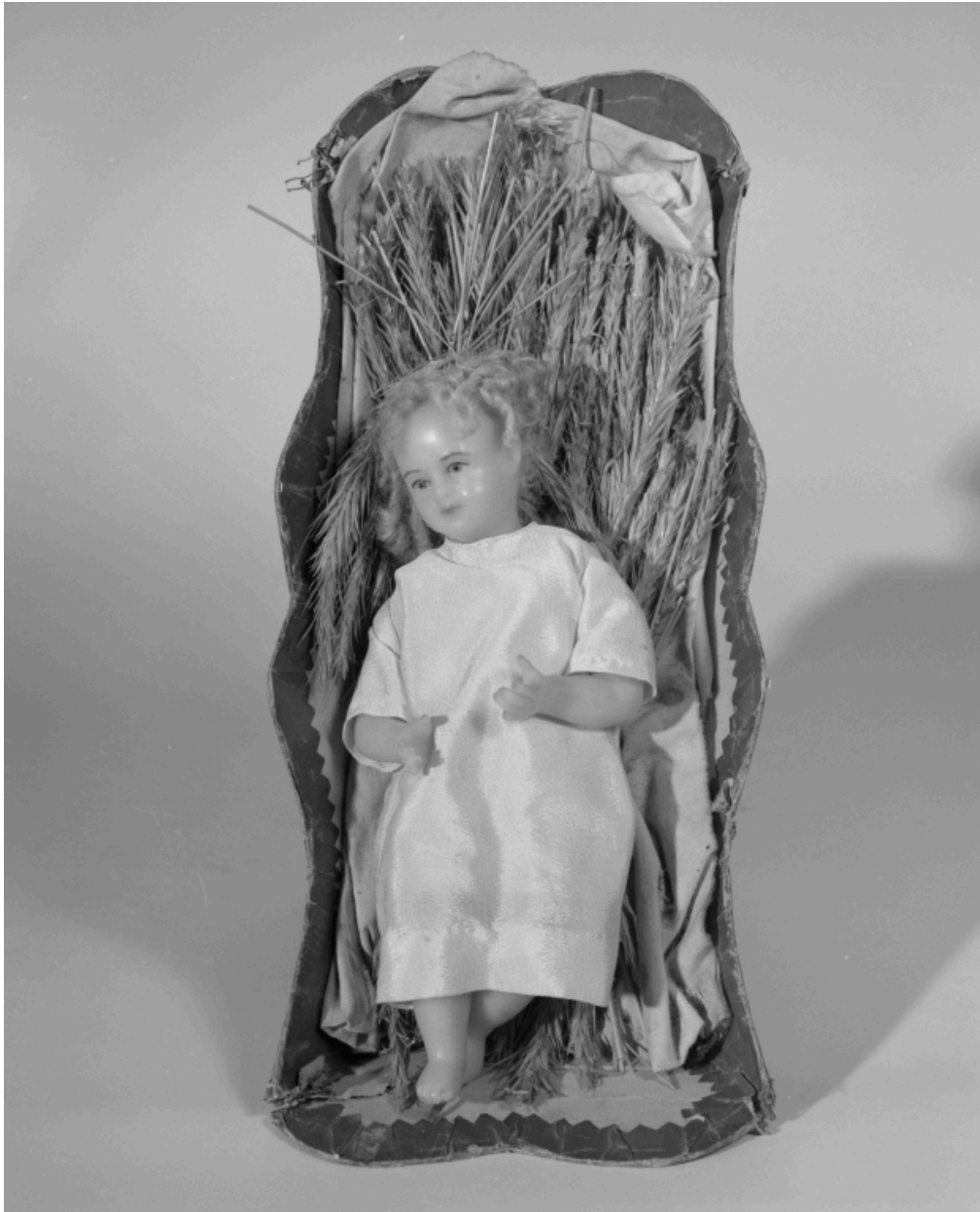
Santon en cire : l'Enfant Jésus.