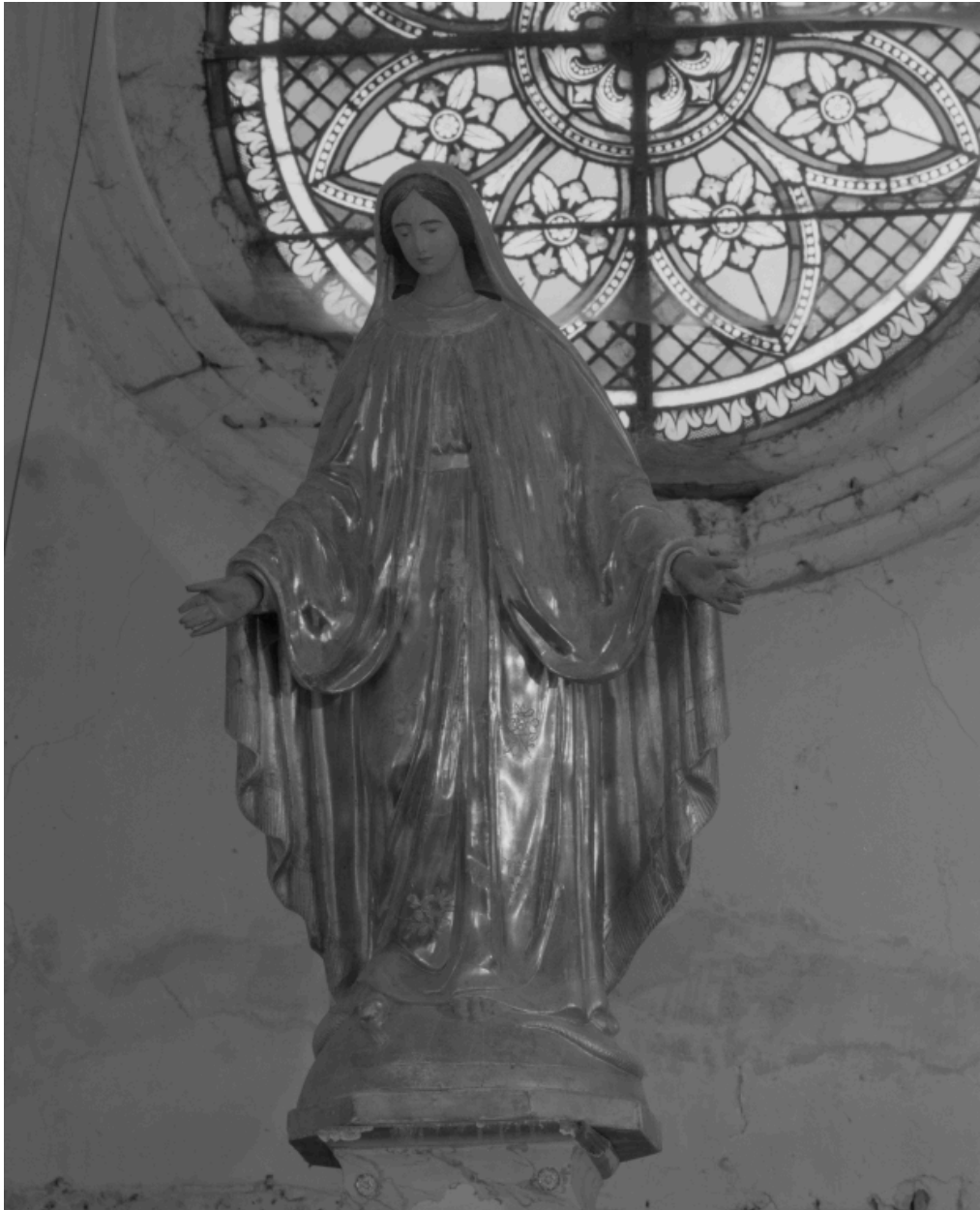
Statue : Immaculée Conception, vue d'ensemble.