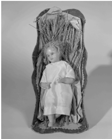
Santon en cire : l'Enfant Jésus.