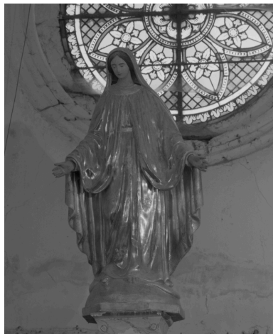
Statue : Immaculée Conception, vue d'ensemble.