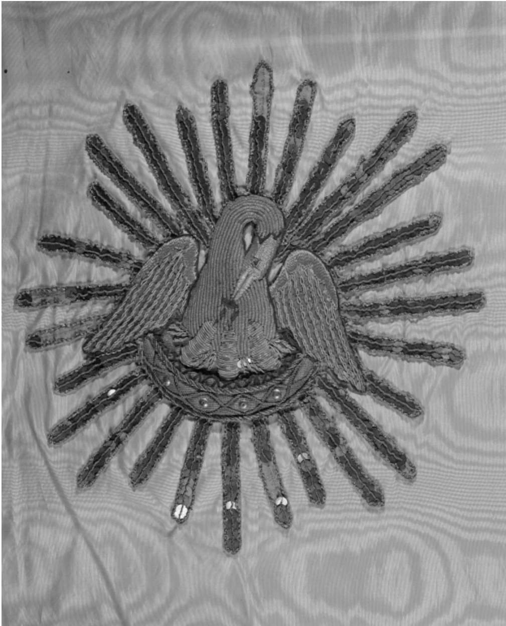
Voile huméral du Saint-Sacrement (?), détail de la broderie rapportée.