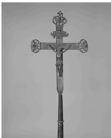
Croix de procession n° 2, vue partielle.