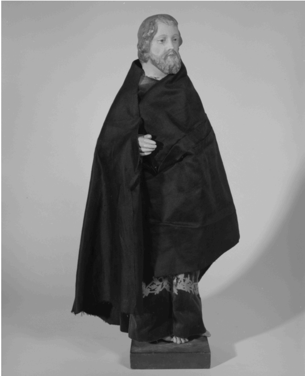
Santon : saint Joseph.