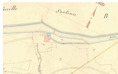
Premier cadastre français, Flumet, 1942, Section C, feuille 2 (FR.AD073, 3P 7428). IVR84_20177300856NUCA