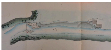
Plan du site, 1865 (FR.AD073, 82S14). IVR84_20177300858NUCA