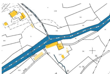
Cadastre actuel, 2016. IVR84_20177300857NUCA