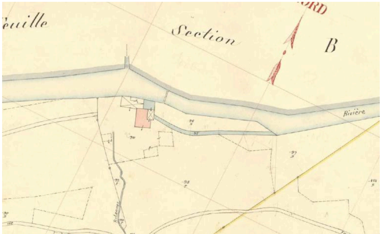
Premier cadastre français, Flumet, 1942, Section C, feuille 2 (FR.AD073, 3P 7428).