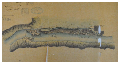
Plan du site, 1861 (FR.AD073, 43SPC4). IVR84_20177300859NUCA