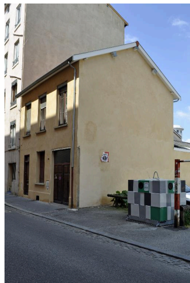
Vue d'ensemble de la maison, depuis le nord-est