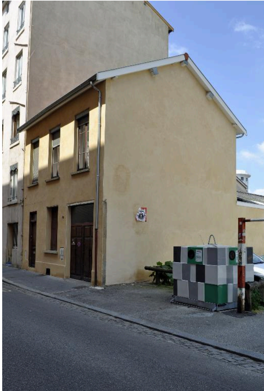
Vue d'ensemble de la maison, depuis le nord-est