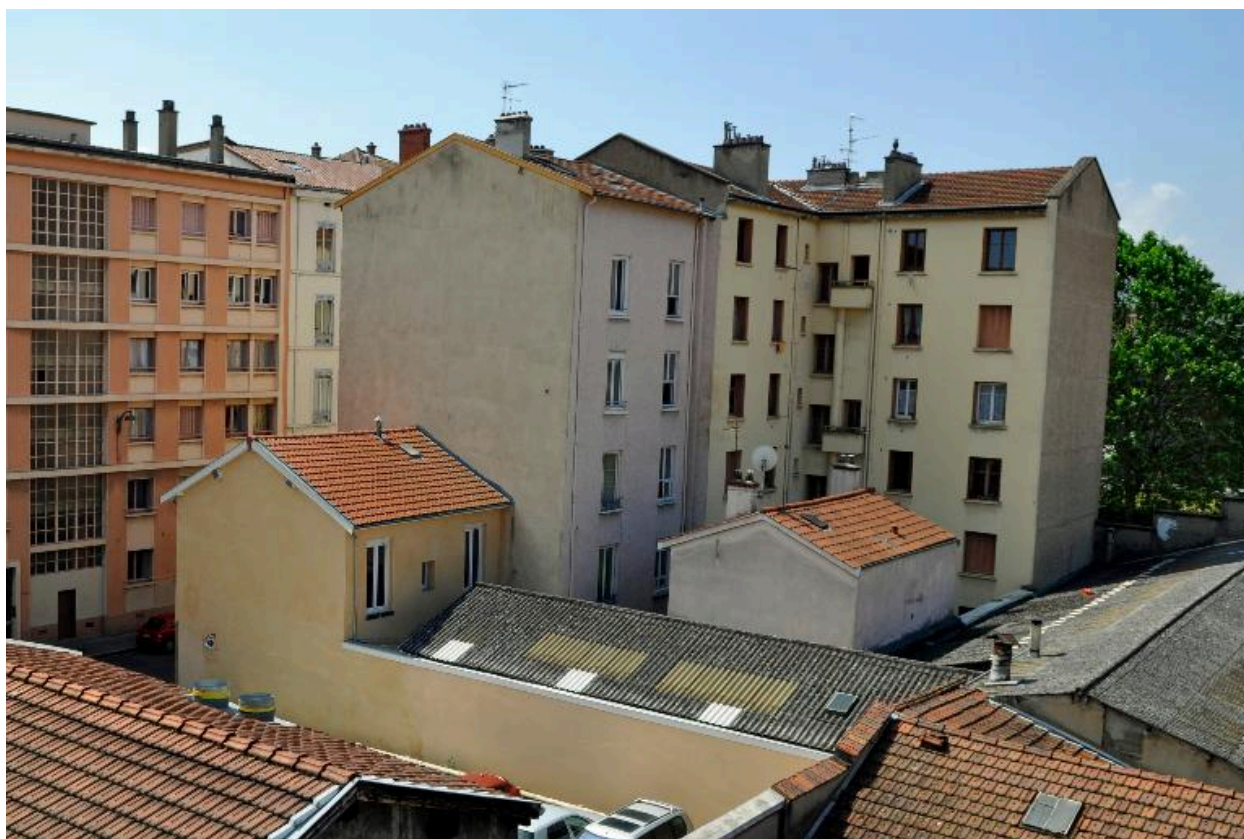
Vue de situation, depuis le nord