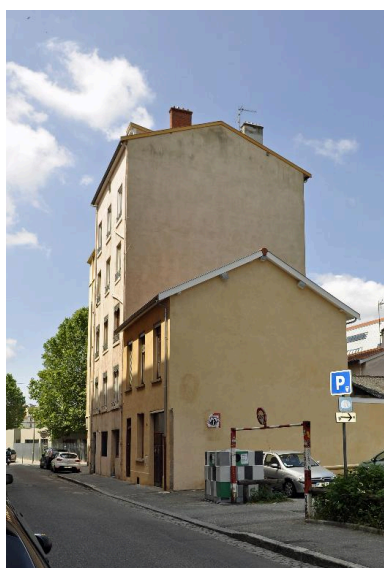
Vue latérale IVR84_20166900727NUCA