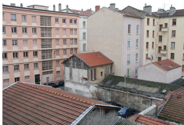
Vue de situation en 2013, laissant voir les matériaux de construction (mâchefer et brique) IVR82_20136900123NUCA