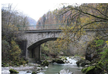
Pont de la Forclaz, face en aval