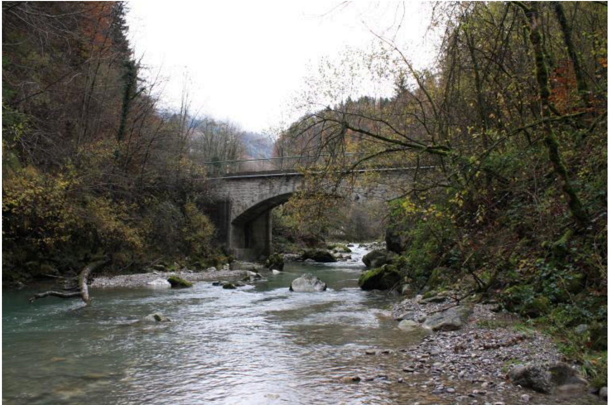
Pont de la Forclaz, Contexte