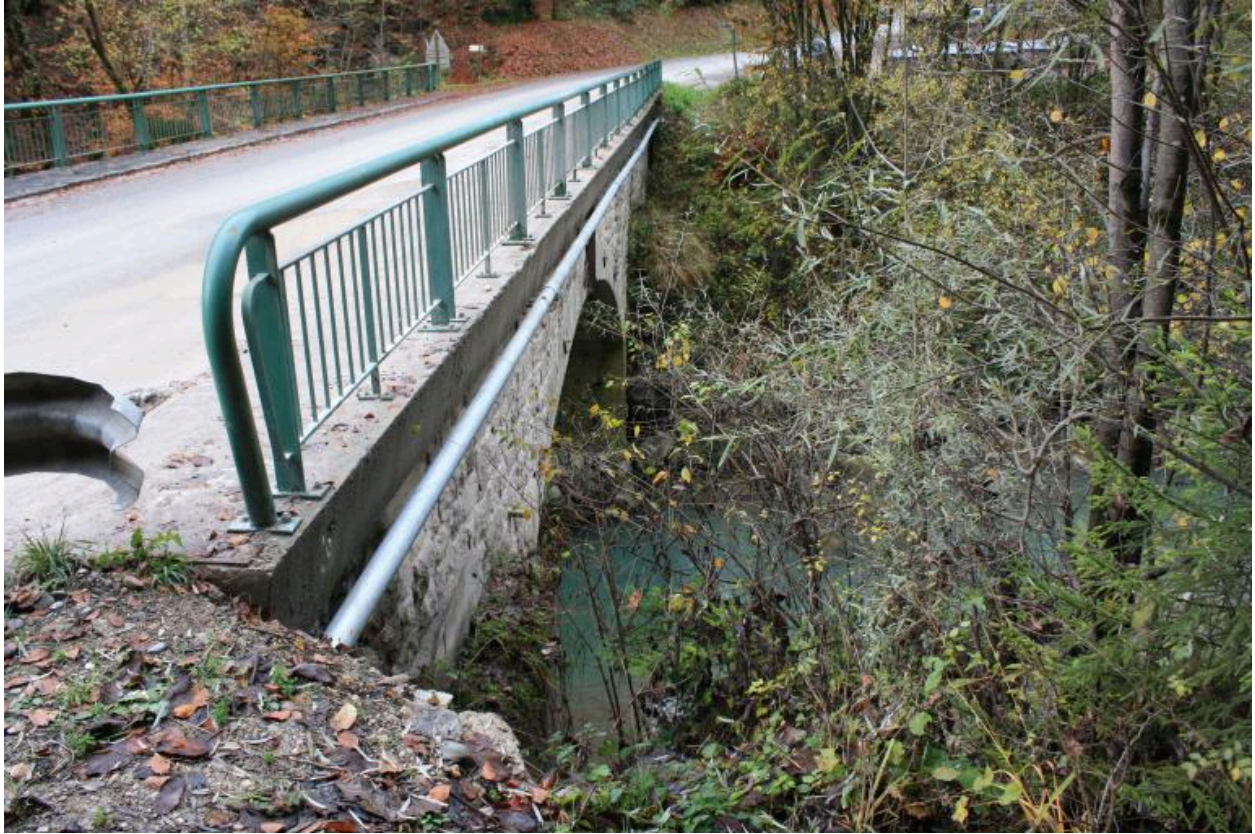
Pont de la Forclaz, détails gardes corps et plinthes