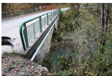
Pont de la Forclaz, détails gardes corps et plinthes IVR84_20207401493NUCA