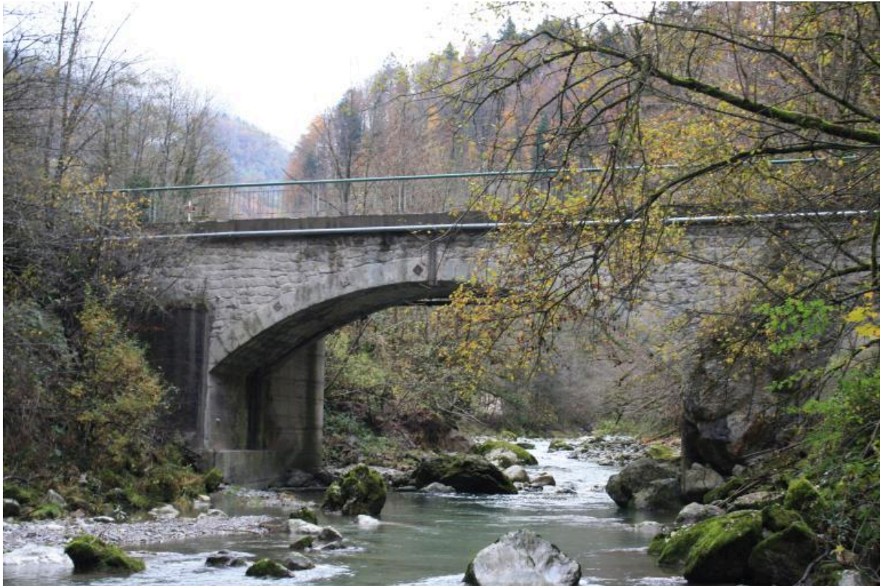
Pont de la Forclaz, face en aval