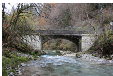
Pont de la Forclaz, face amont