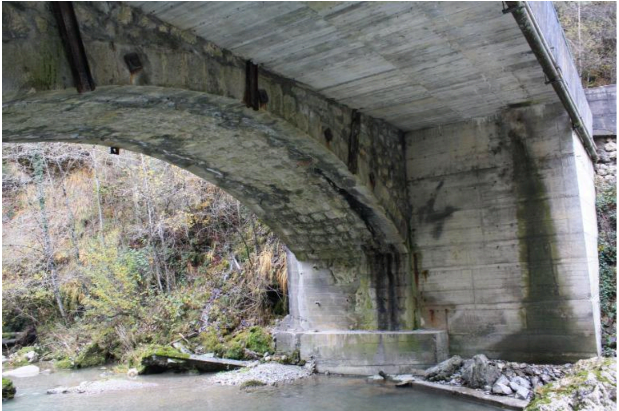
Pont de la Forclaz, détail voûte et culée