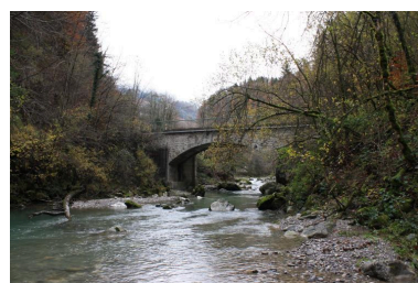
Pont de la Forclaz, Contexte IVR84_20207401488NUCA