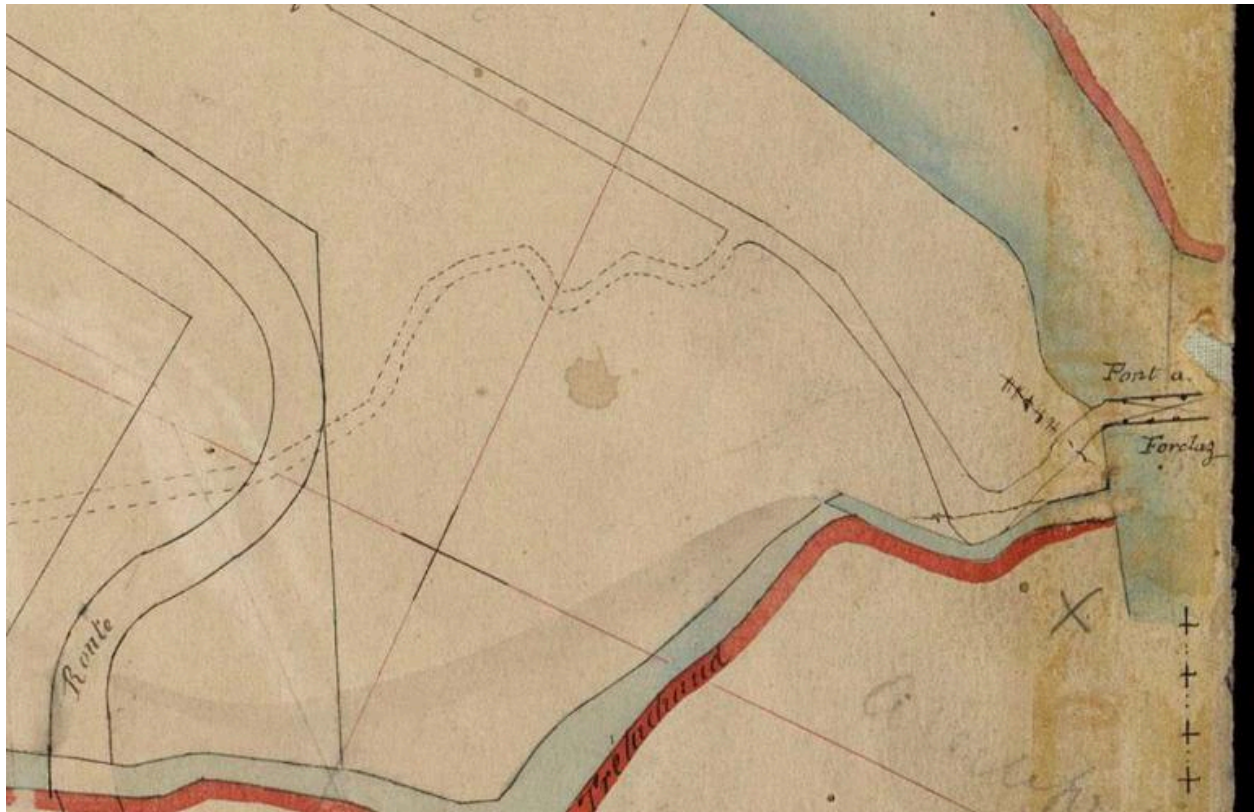
Pont de la Forclaz, extrait cadastre La Vernaz 15/09/1868