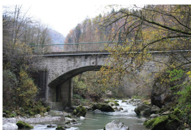
Pont de la Forclaz, face en aval