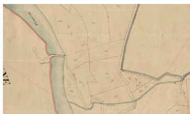
Pont de la Forclaz, extrait cadastre La Forclaz 05/03/1868 IVR84_20207401487NUCA