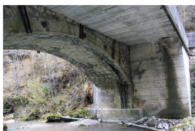
Pont de la Forclaz, détail voûte et culée