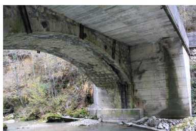
Pont de la Forclaz, détail voûte et culée IVR84_20207401492NUCA