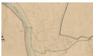
Pont de la Forclaz, extrait cadastral La Forclaz 05/03/1868 IVR84_20207401487NUCA