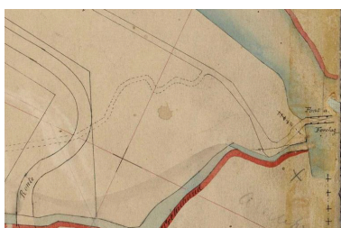
Pont de la Forclaz, extrait cadastral La Vernaz 15/09/1868 IVR84_20207401494NUCA