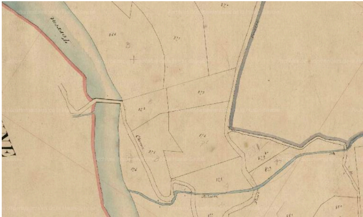
Pont de la Forclaz, extrait cadastre La Forclaz 05/03/1868