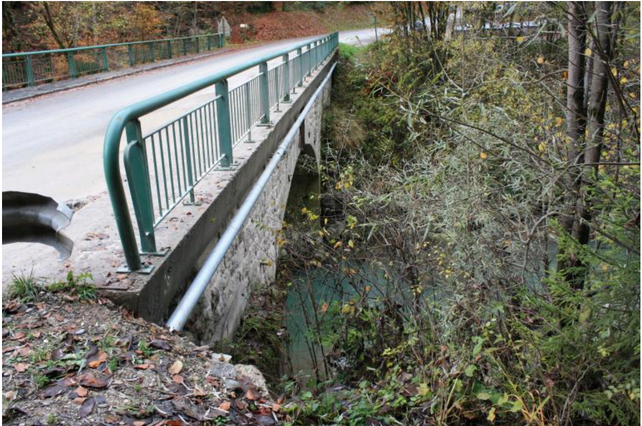
Pont de la Forclaz, détails gardes corps et plinthes