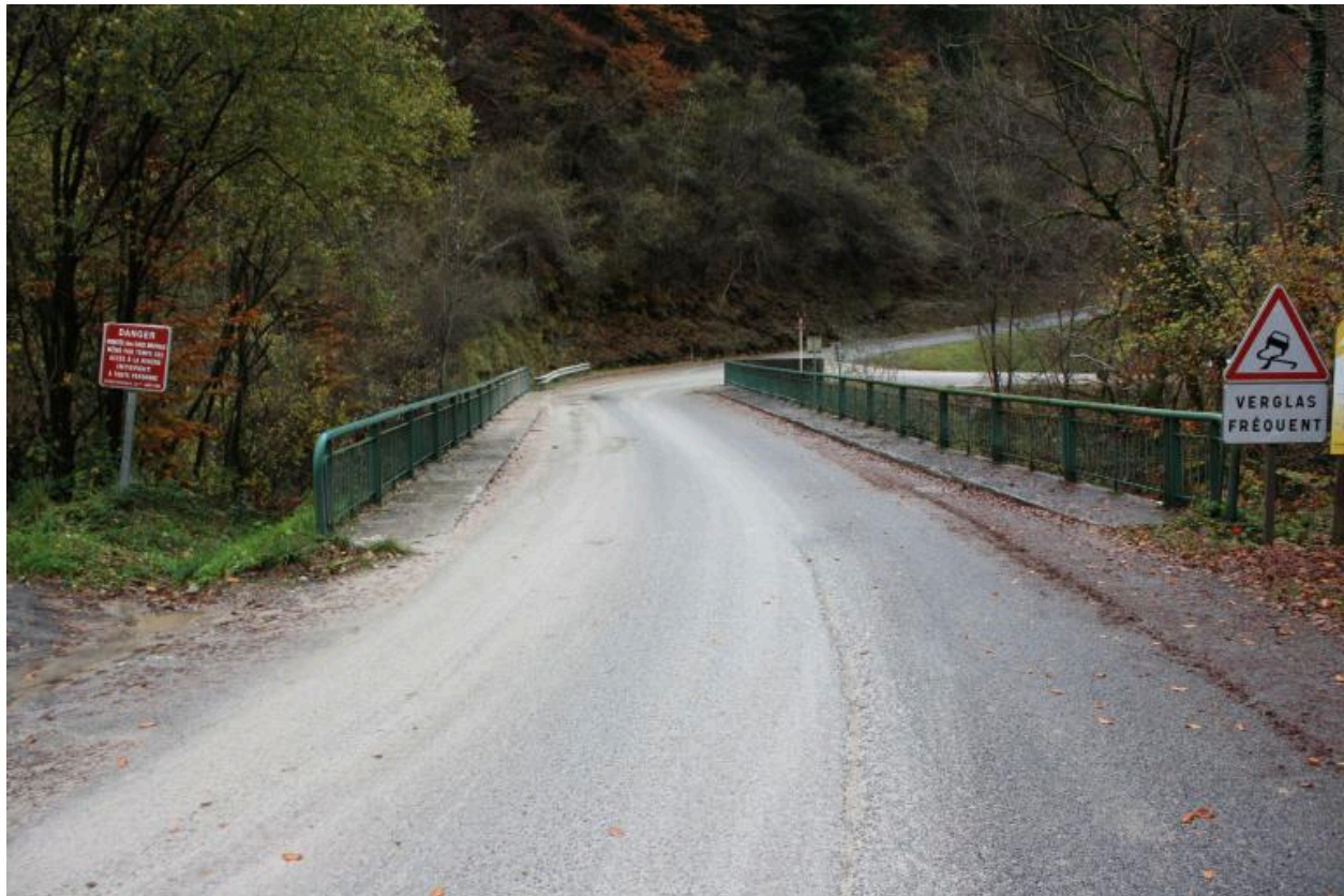
Pont de la Forclaz, chaussée et gardes corps