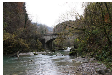
Pont de la Forclaz, Contexte IVR84_20207401488NUCA