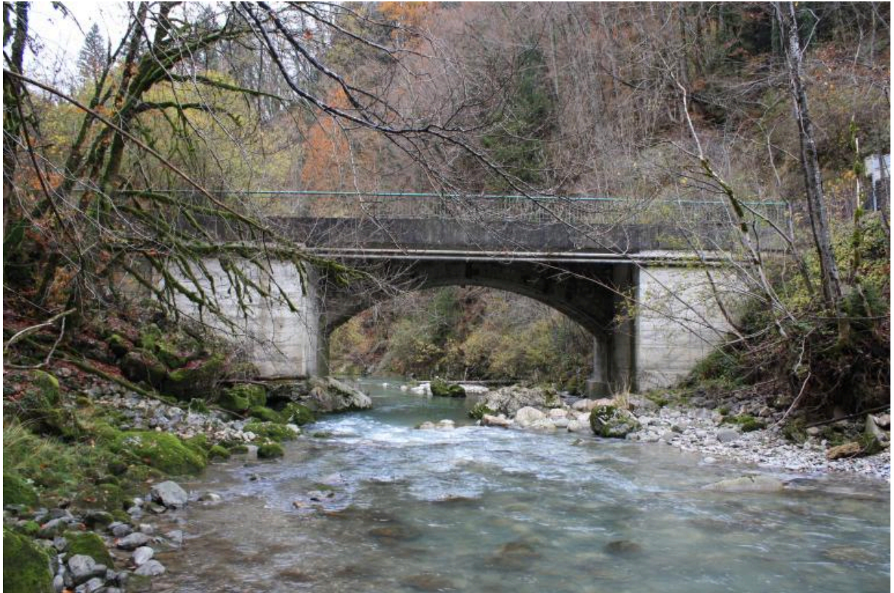
Pont de la Forclaz, face amont