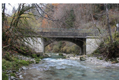
Pont de la Forclaz, face amont IVR84_20207401489NUCA