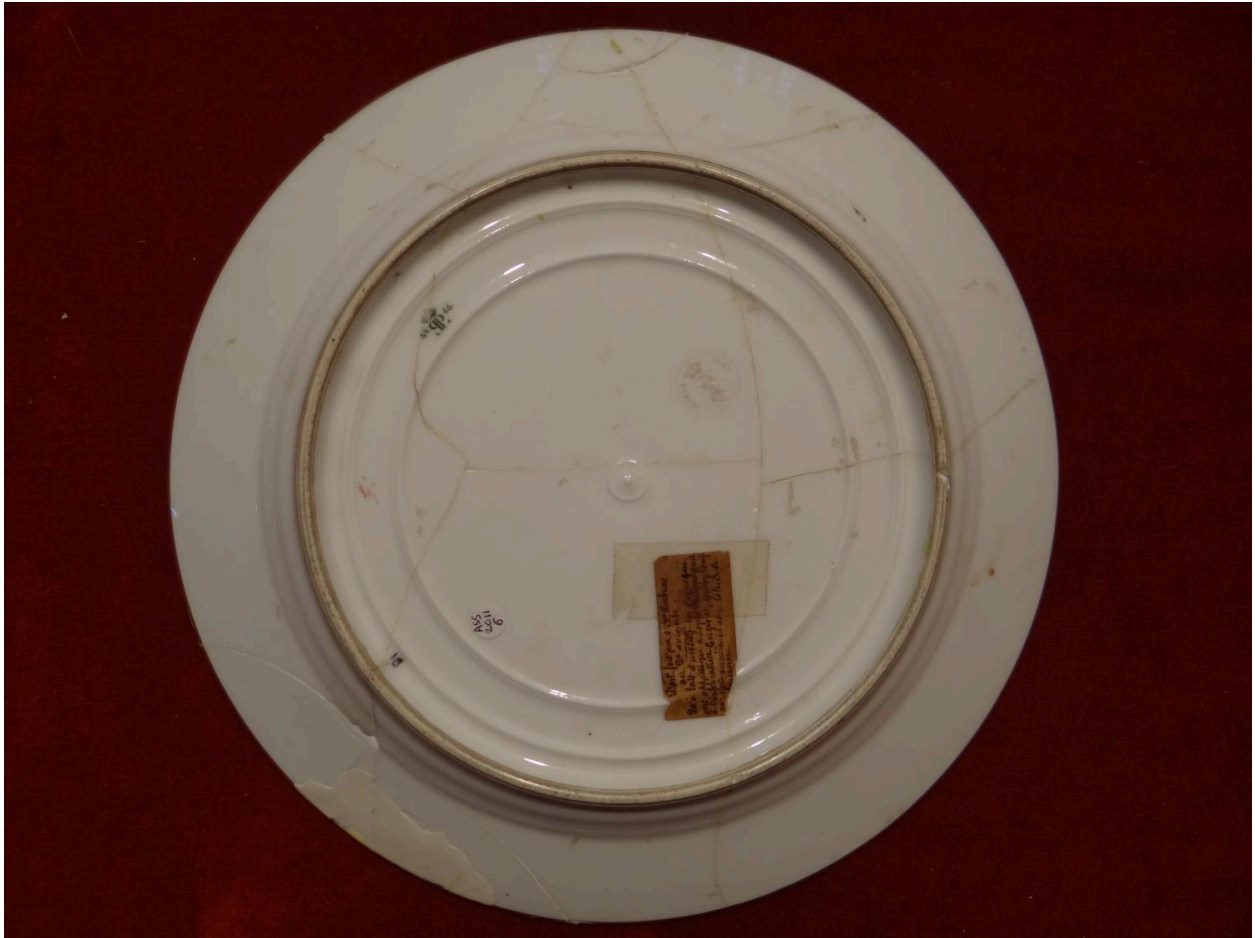
Vue du revers