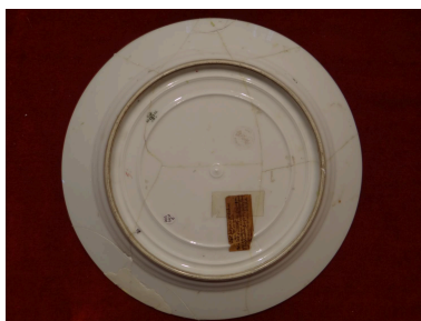
Vue du revers IVR84_20216300321NUC4A