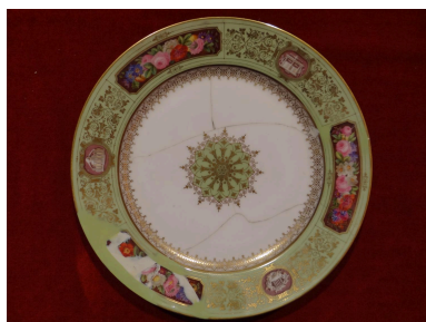
Vue générale IVR84_20216300320NUC4A