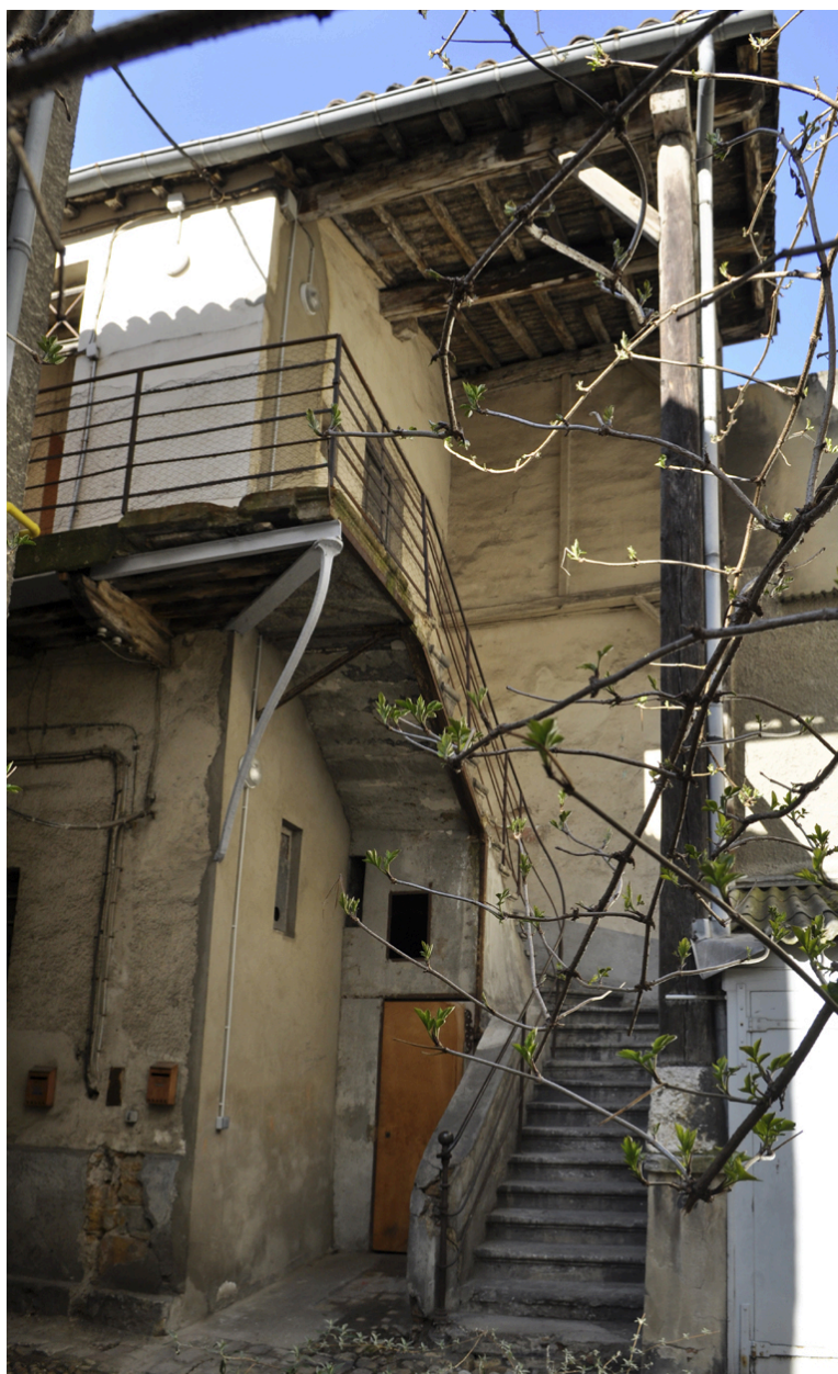
Vue de l'escalier extérieur du bâtiment de la cour