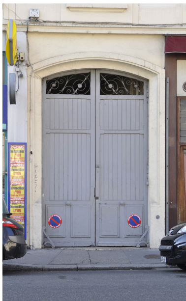
Elévation antérieure, détail de la porte cochère