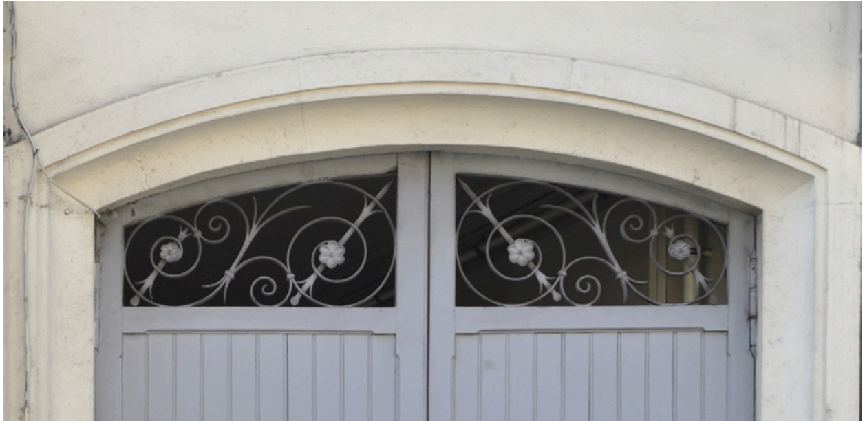
Elévation antérieure, détail de l'imposte de la porte cochère