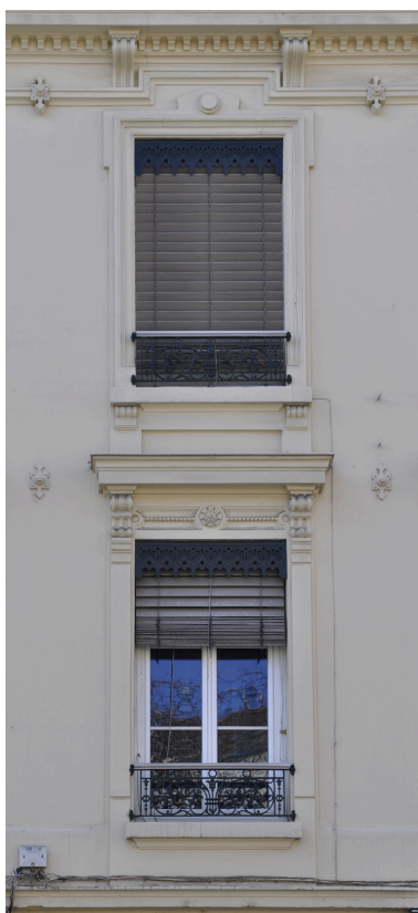
Elévation antérieure, détail d'une travée du 2ème étage