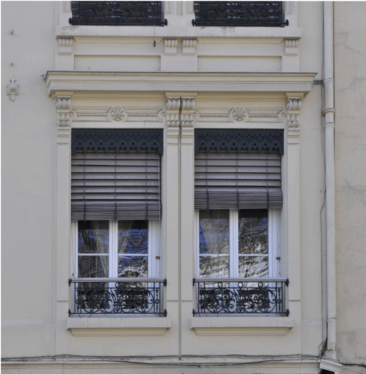
Elevation antérieure, détail des fenêtres du 1er étage