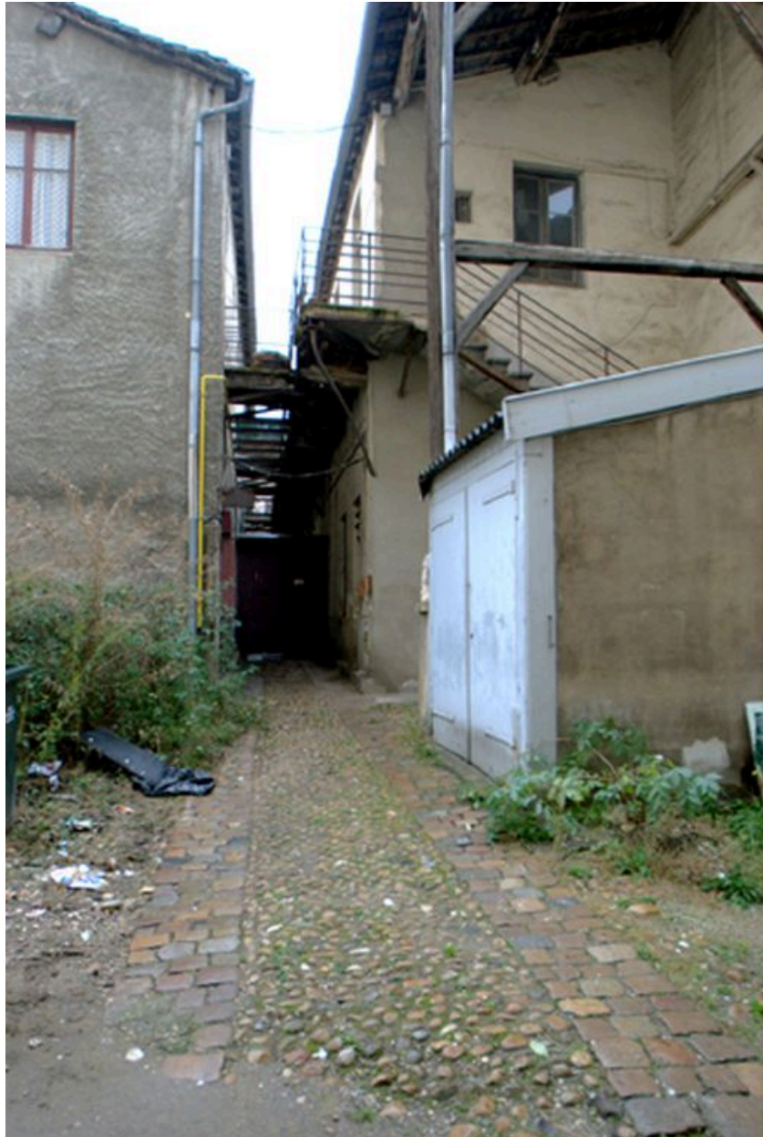
Vue de la cour et de la traboule vers la rue du Béguin