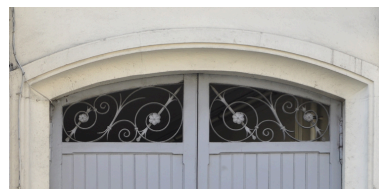
Elévation antérieure, détail de l'imposte de la porte cochère IVR82_20126902418NUCA