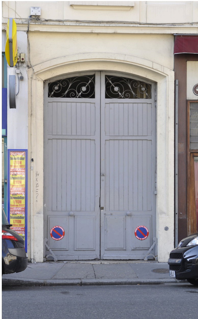
Elévation antérieure, détail de la porte cochère