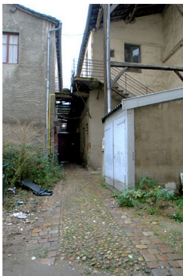
Vue de la cour et de la traboule vers la rue du Béguin IVR82_20096901260NUCA