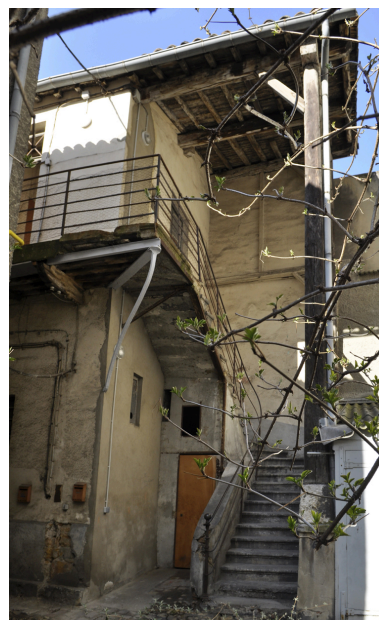
Vue de l'escalier extérieur du bâtiment de la cour