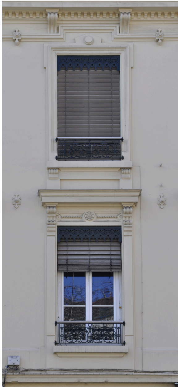
Elévation antérieure, détail d'une travée du 2ème étage