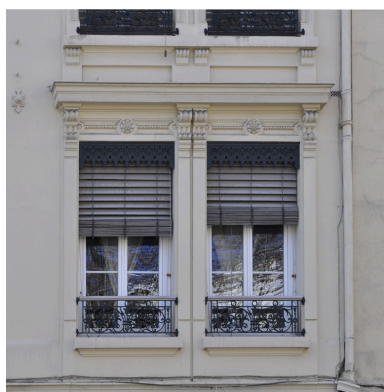
Elevation antérieure, détail des fenêtres du 1er étage