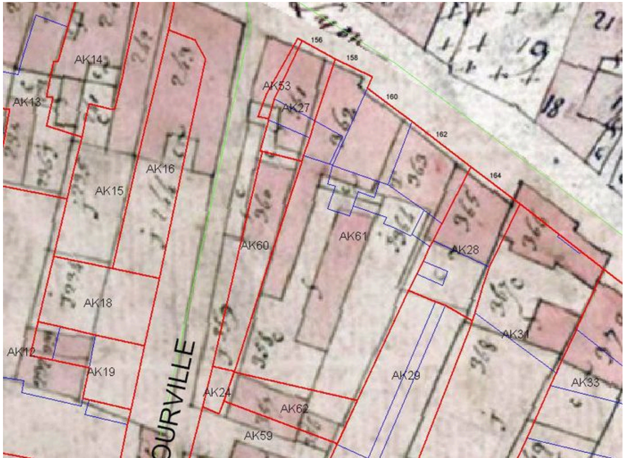
Extrait du plan cadastral actuel superposé sur le plan cadastral de 1825. Superposition P. Cherblanc