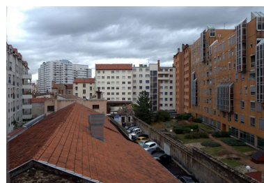
Elévation postérieure depuis le sud IVR82_20096901247NUCA