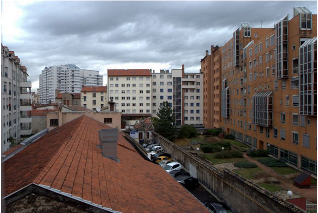
Elévation postérieure depuis le sud