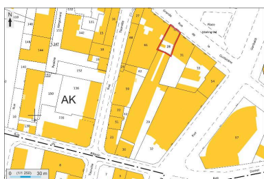
Plan masse et de situation, extrait de http://cadastre.gouv.fr IVR82_20136902397NUDA