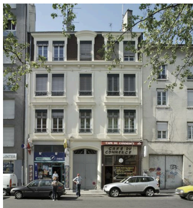
Elévation antérieure