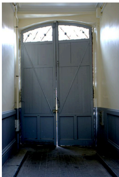
Revers du portail d'entrée IVR82_20096901259NUCA