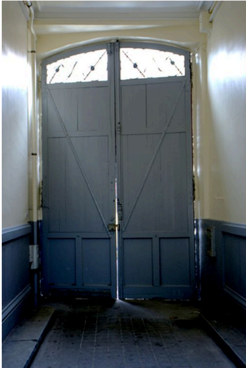
Revers du portail d'entrée