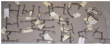
Vue générale IVR84_20226302540NUC4A