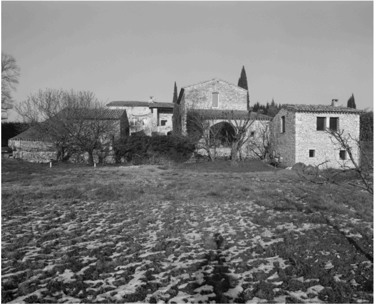
Vue d'ensemble de la ferme depuis le sud.