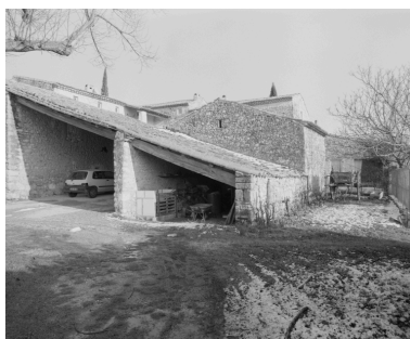
Vue de trois quarts du côté du hangar-porche.