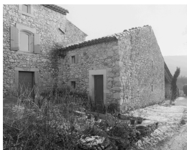
Une dépendance agricole et élévation latérale du corps principal, vue partielle.