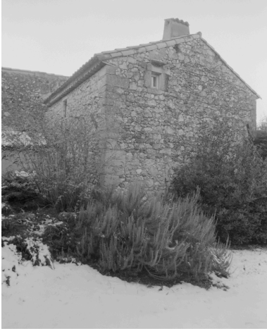
Vue de trois quarts de l'ancienne magnanerie. IVR82_19982600077X