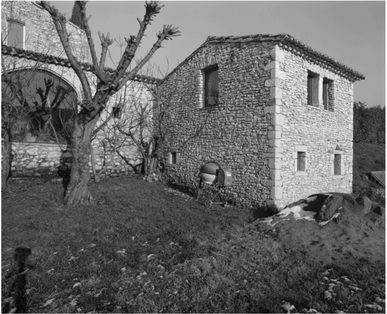
Elévation côté sud récemment restaurée (vue partielle) et corps de bâtiment remanié.