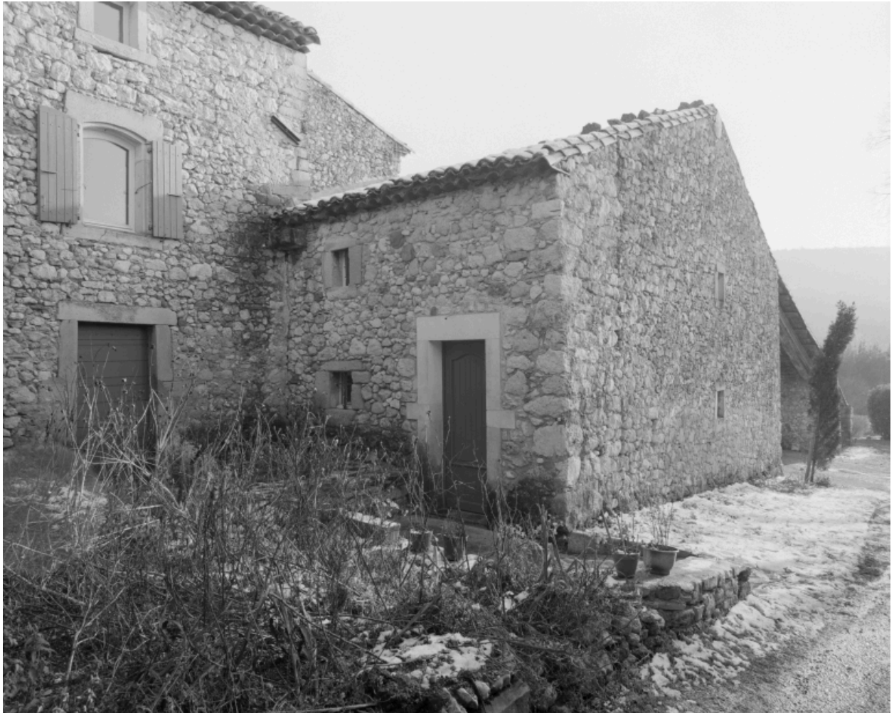
Une dépendance agricole et élévation latérale du corps principal, vue partielle.