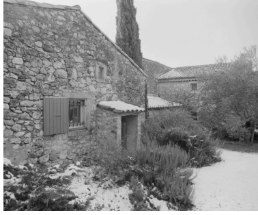
Divers corps de bâtiment et l'ancienne magnanerie à droite (élévation latérale).