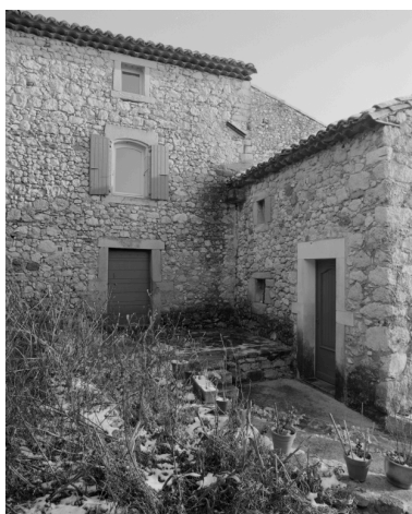
Elévation latérale d'un des logis donnant sur l'extérieur de la cour. IVR82_19982600081X