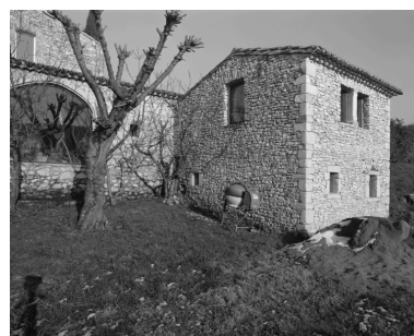
Elévation côté sud récemment restaurée (vue partielle) et corps de bâtiment remanié. IVR82_19982600082X