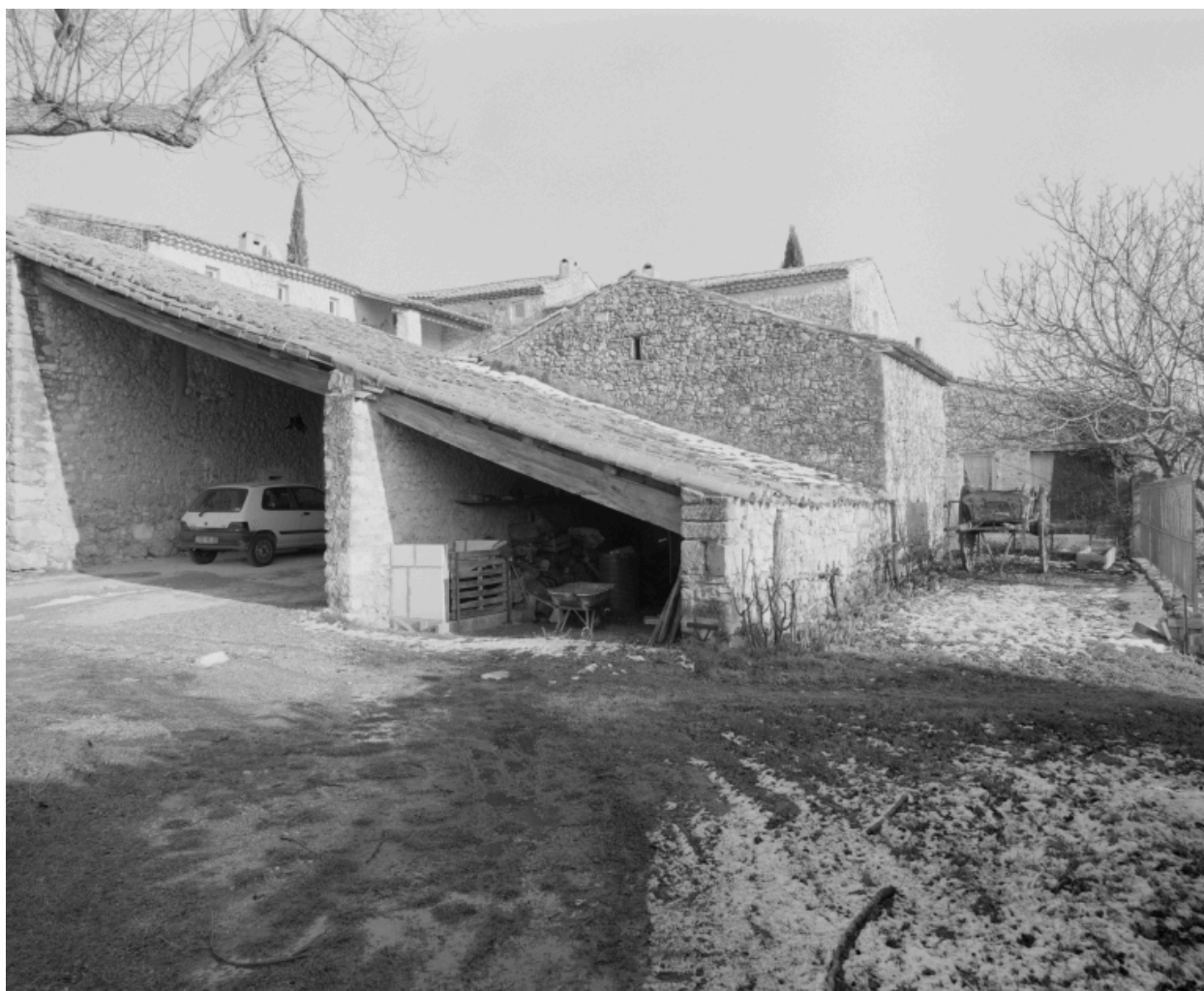
Vue de trois quarts du côté du hangar-porche.