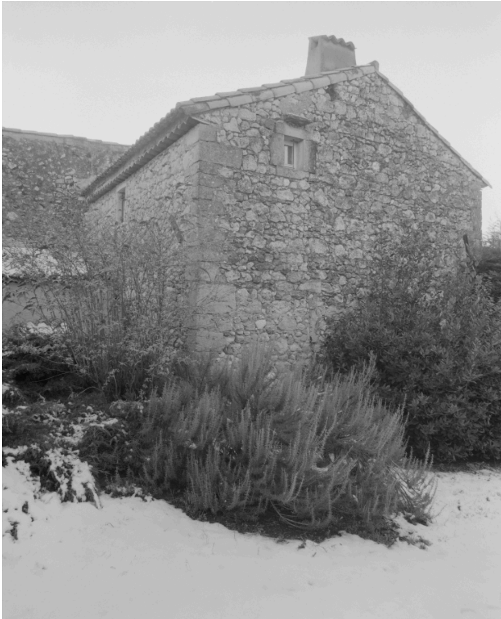
Vue de trois quarts de l'ancienne magnanerie.