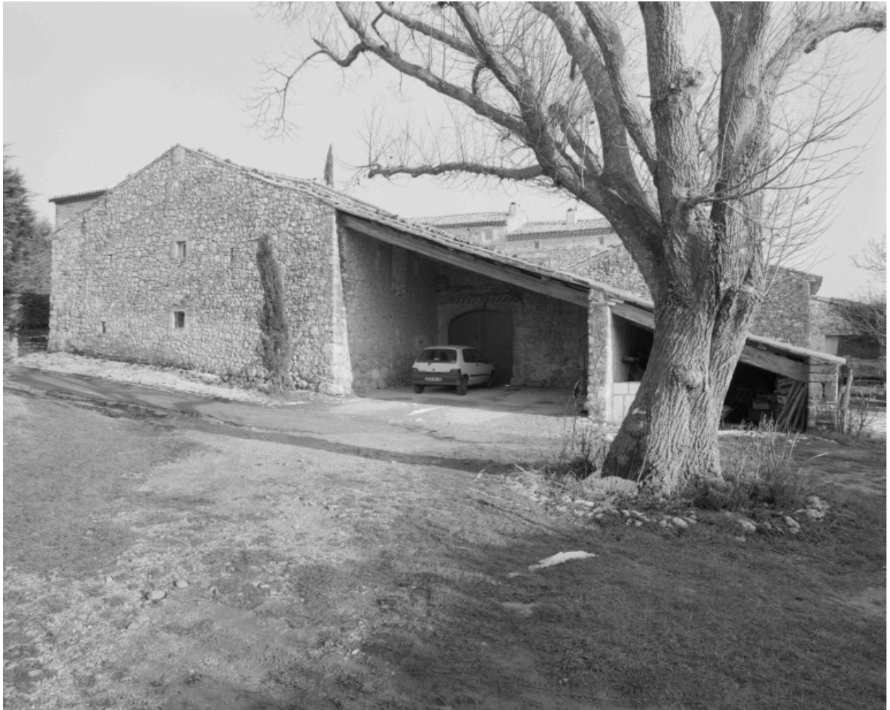
L'entrée de la cour, sous l'appentis.