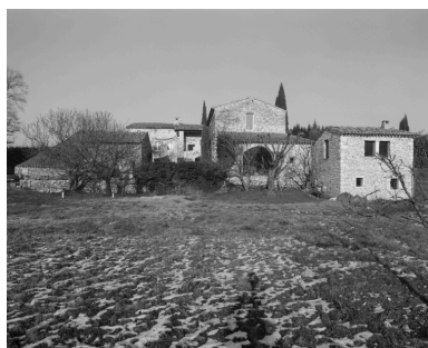
Vue d'ensemble de la ferme depuis le sud. IVR82_19982600083X