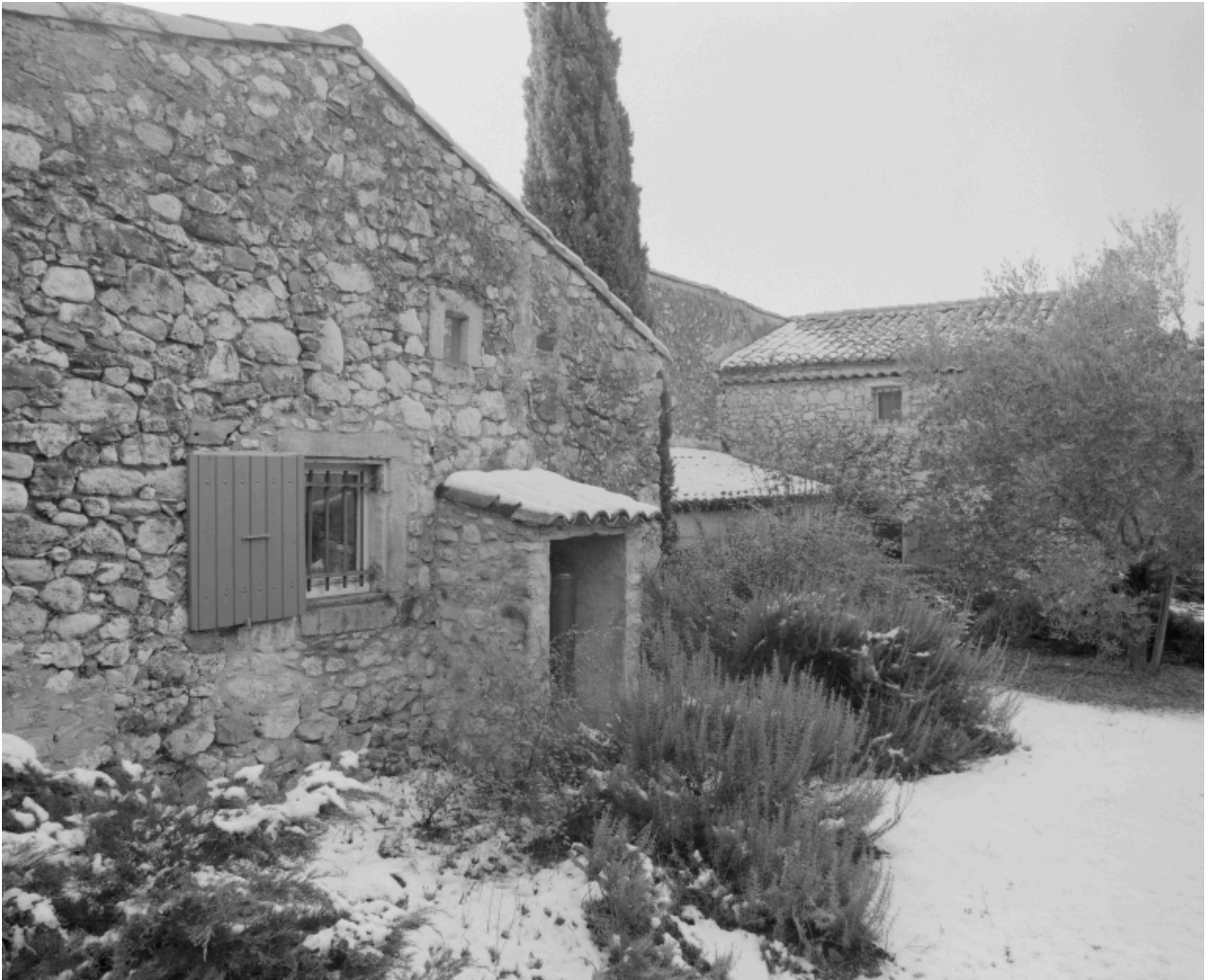
Divers corps de bâtiment et l'ancienne magnanerie à droite (élévation latérale).