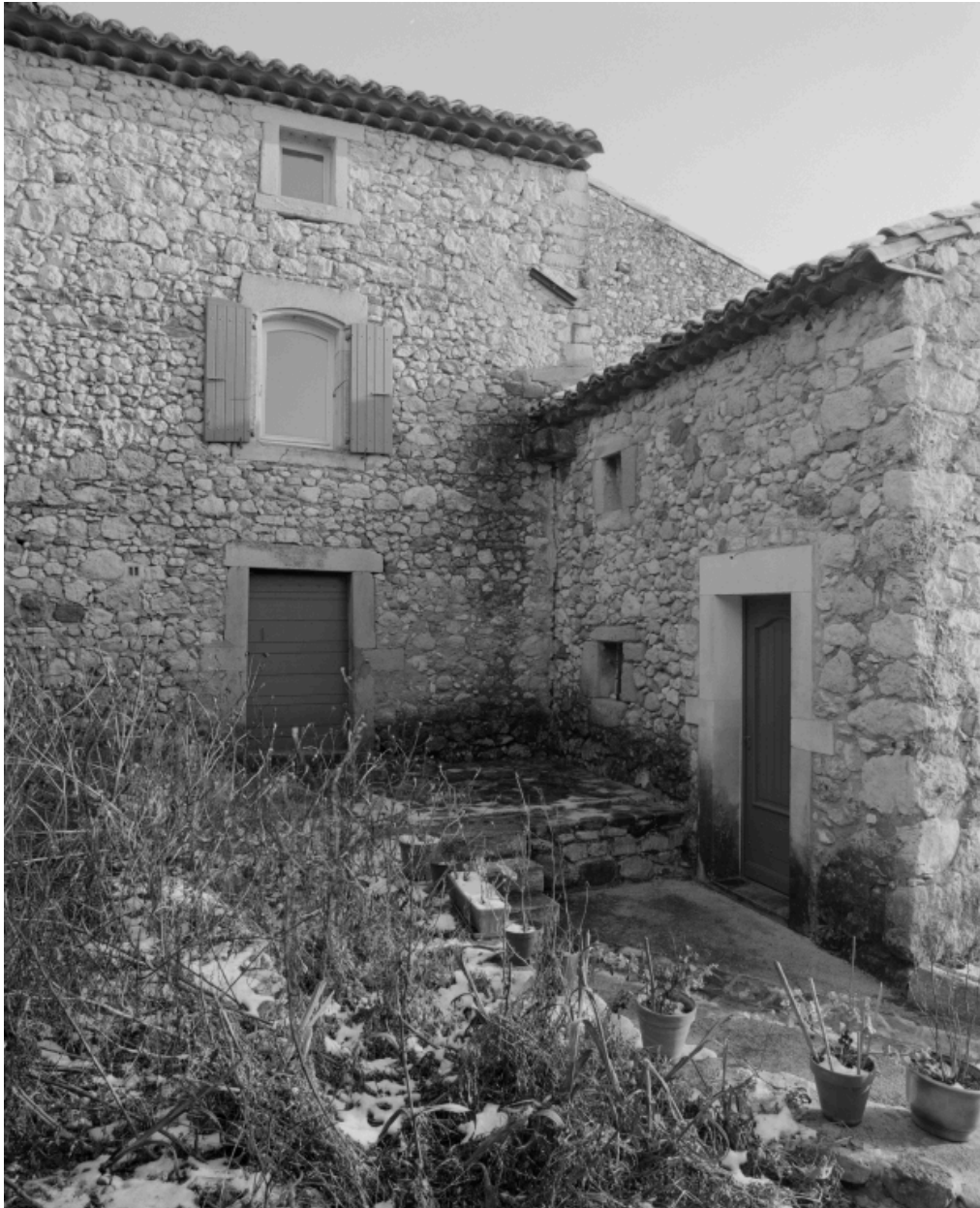
Elévation latérale d'un des logis donnant sur l'extérieur de la cour.