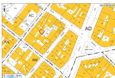
Plan masse et de situation