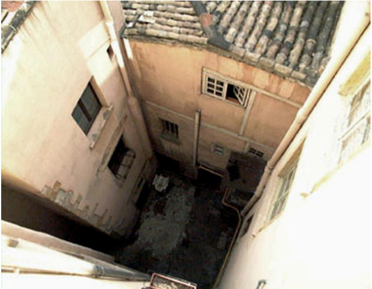
Vue de la cour commune aux 5 et 7 rue Bellière, 10 rue Ferrachat et 12 rue du Doyenné