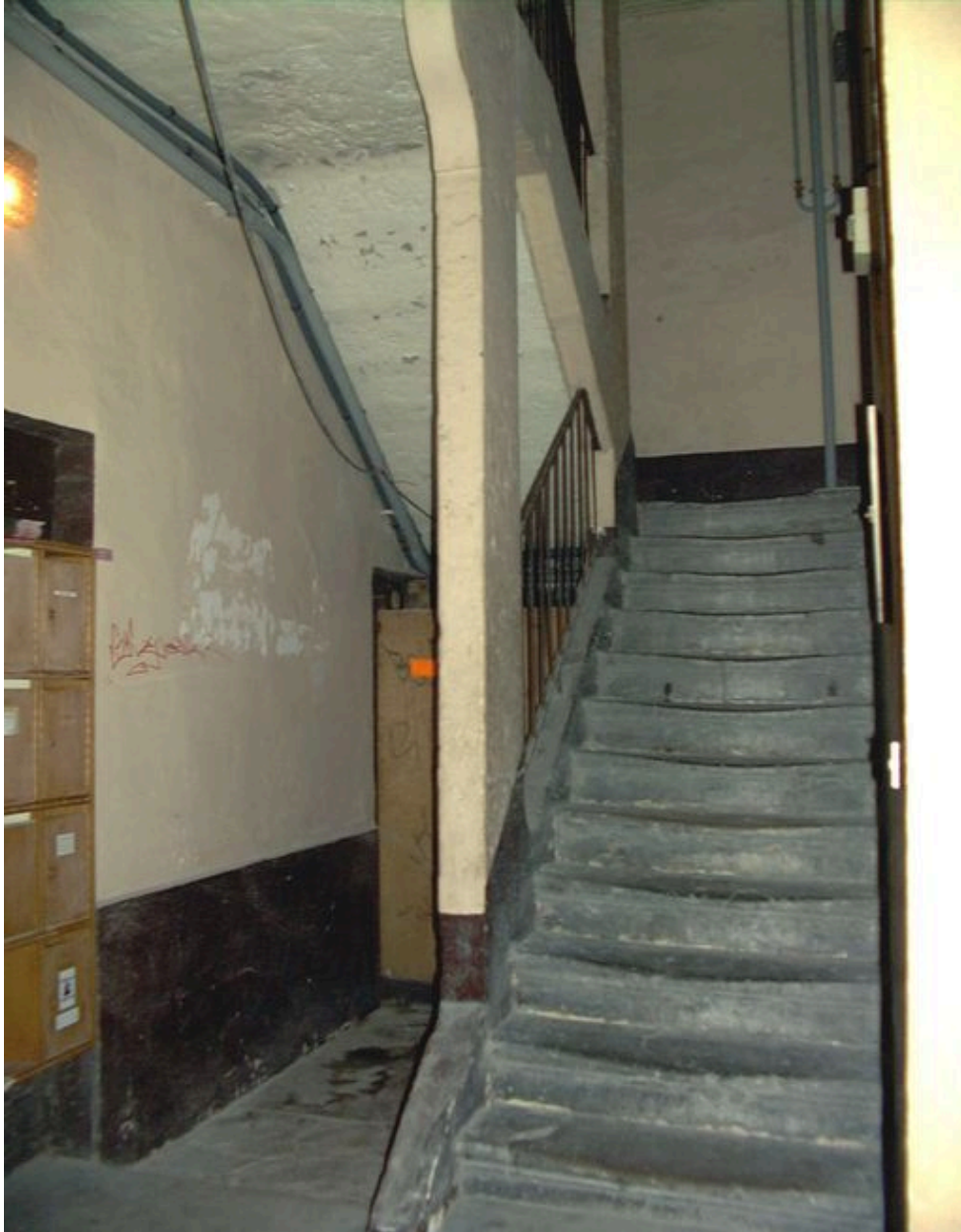
Vue de l'escalier commun aux 7 rue Bellière et 10 rue Ferrachat