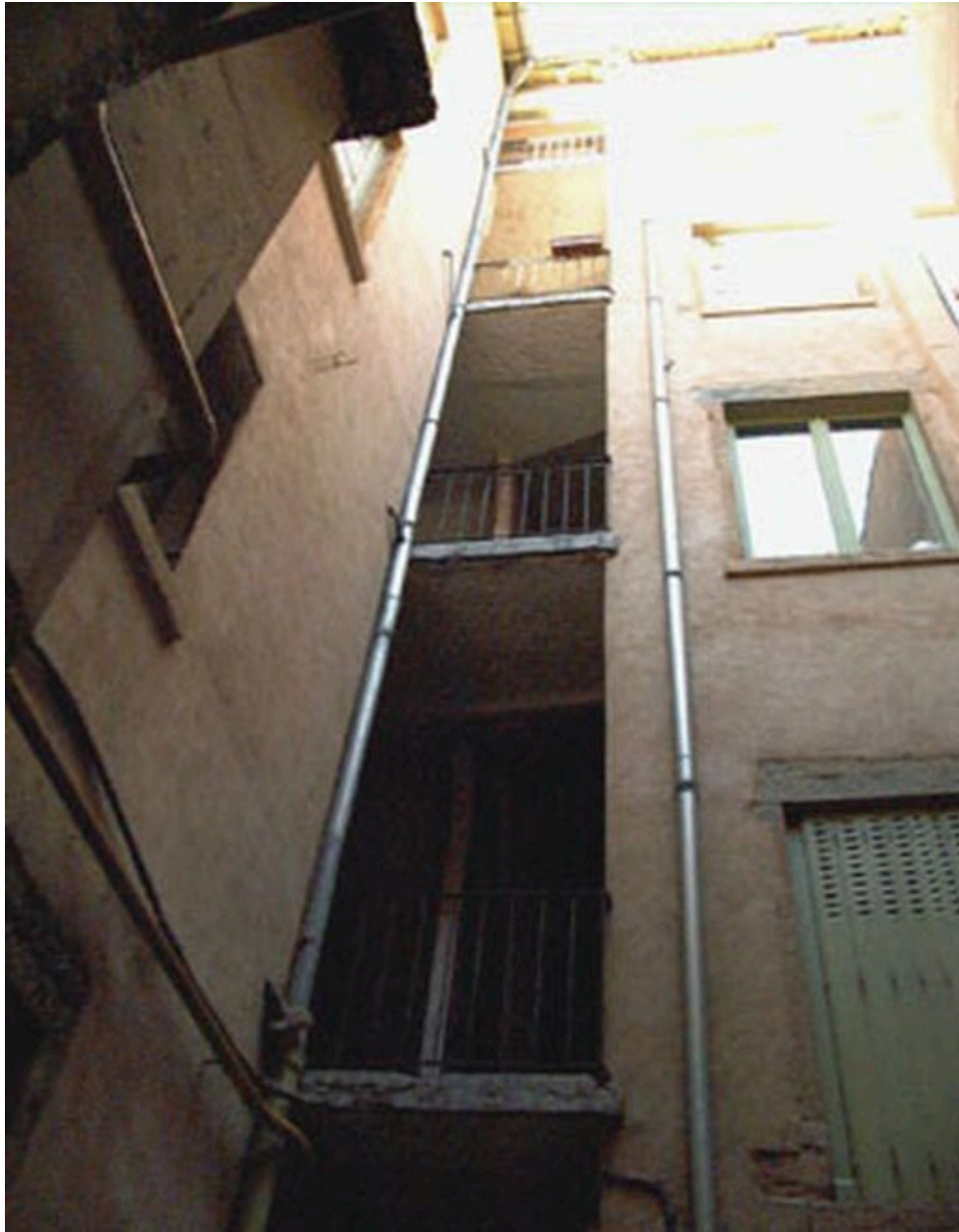
Vue de la cage ouverte sur cour de l'escalier commun aux 7 rue Bellière et 10 rue Ferrachat