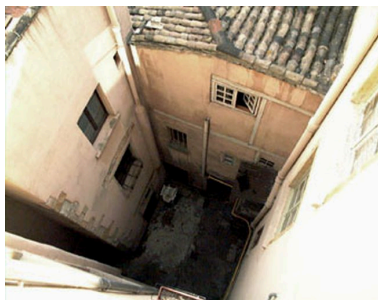
Vue de la cour commune aux 5 et 7 rue Bellière, 10 rue Ferrachat et 12 rue du Doyenné IVR82_20006900183NUCA