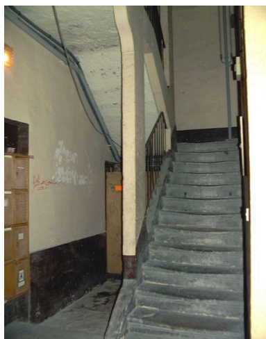
Vue de l'escalier commun aux 7 rue Bellière et 10 rue Ferrachat IVR82_20006900157NUCA