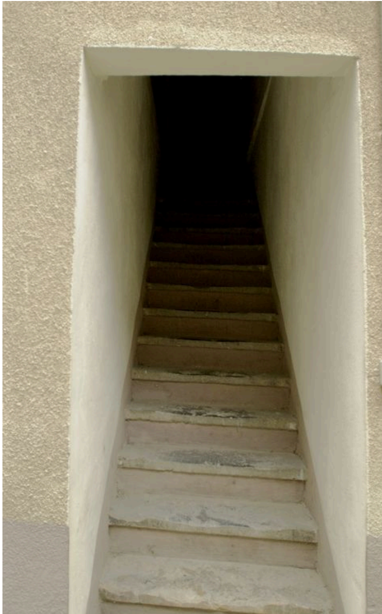
Escalier d'accès à l'étage