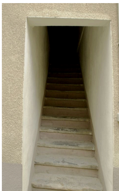
Escalier d'accès à l'étage IVR82_20086900689NUCA