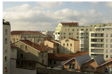
Vue d'ensemble depuis l'est IVR82_20086900674NUCA