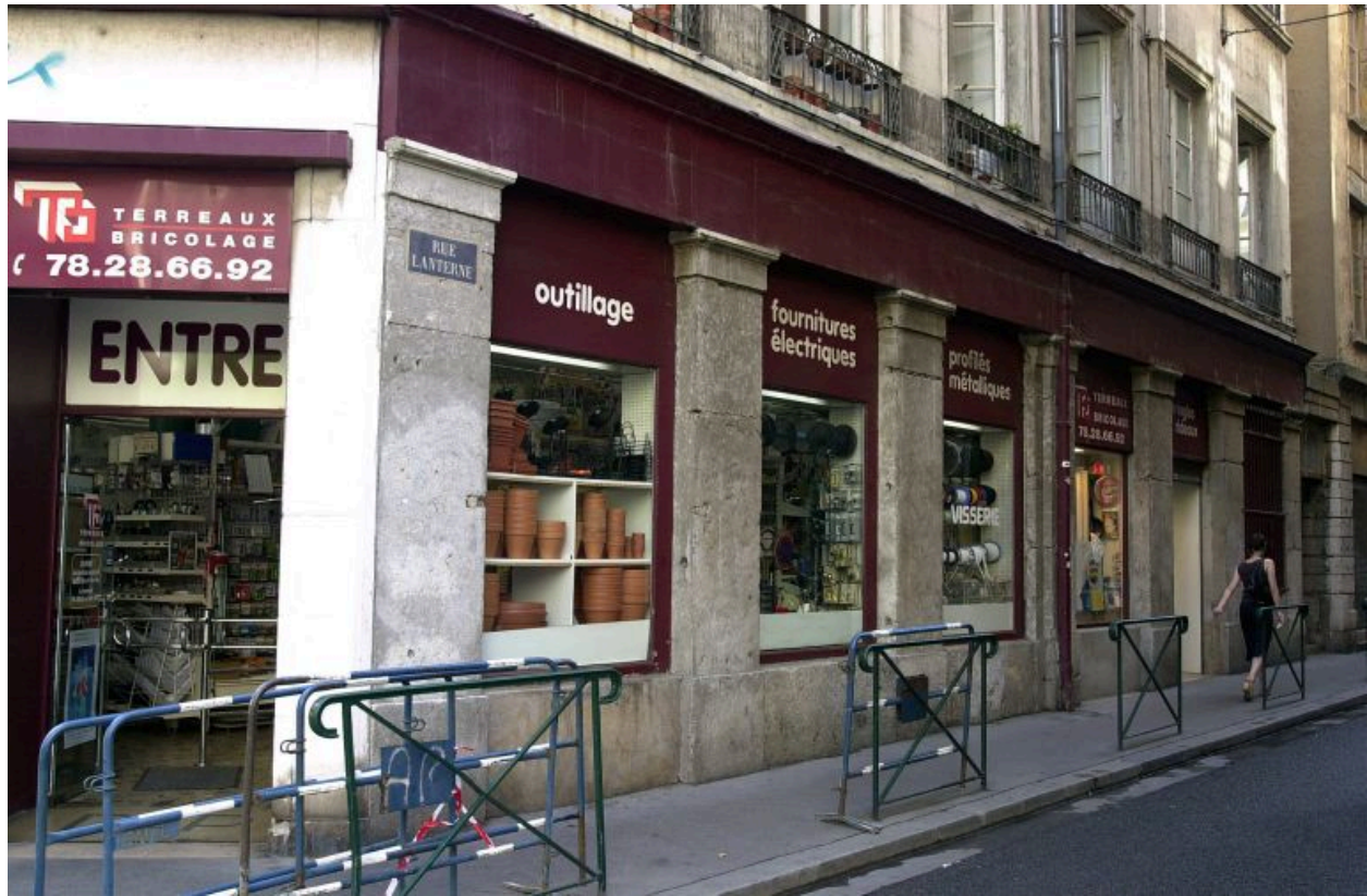
Façade secondaire rue Lanterne, rez-de-chaussée