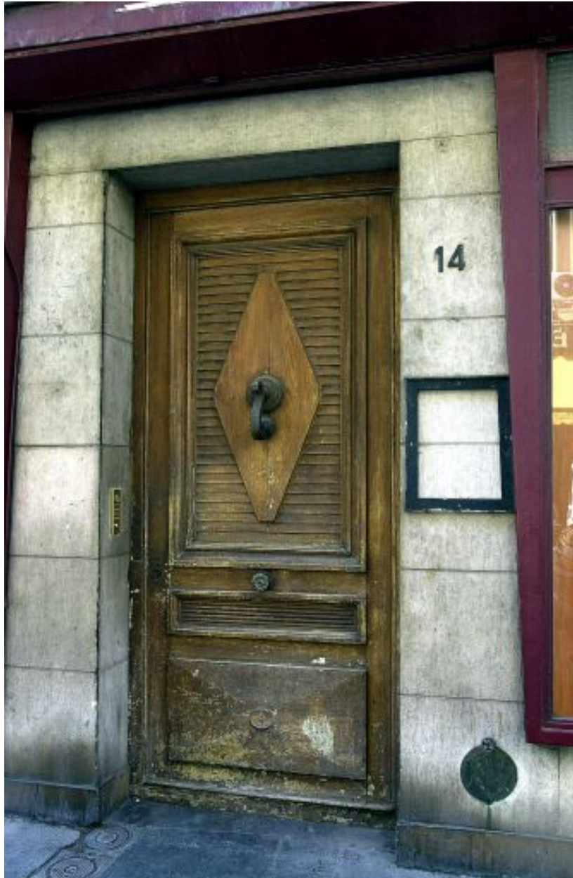
Façade principale, porte