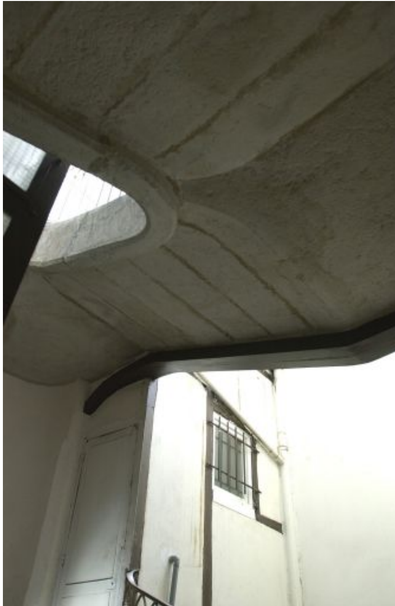
Escalier, vue du dessous des marches du cinquième étage