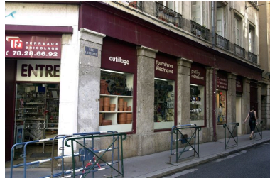
Façade secondaire rue Lanterne, rez-de-chaussée IVR82_20036901396NUCA