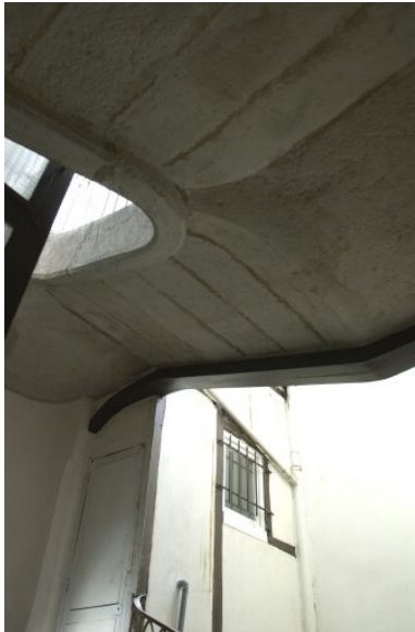
Escalier, vue du dessous des marches du cinquième étage IVR82_20036901401NUCA