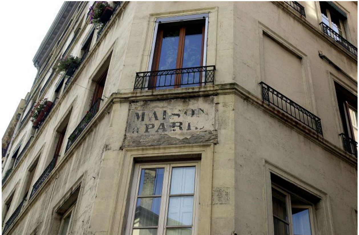
Angle à pan coupé, ancienne enseigne