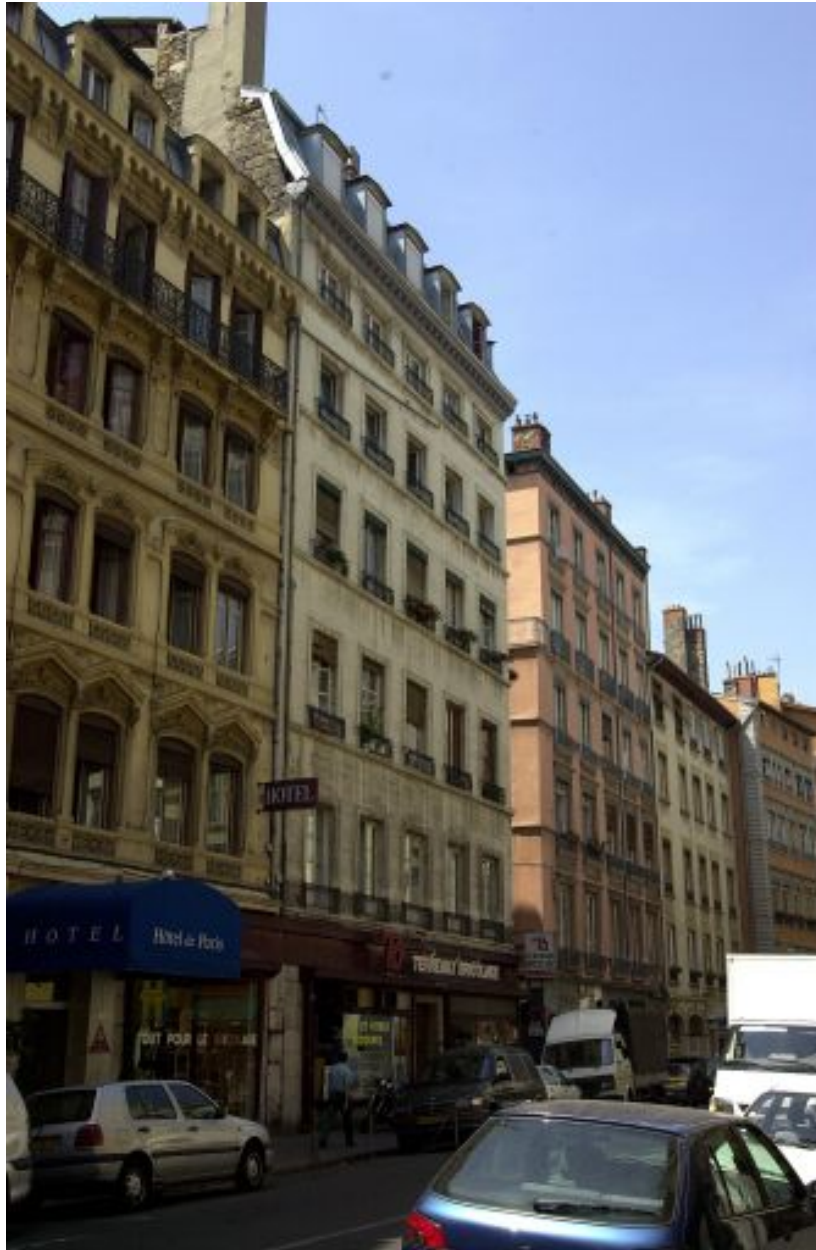
Façade principale, rue de la Platière