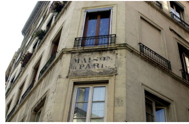
Angle à pan coupé, ancienne enseigne IVR82_20036901397NUCA