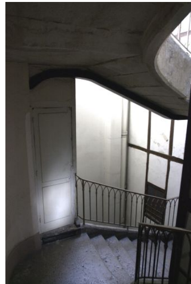
Escalier, quatrième étage, détail d'un repos IVR82_20036901400NUCA