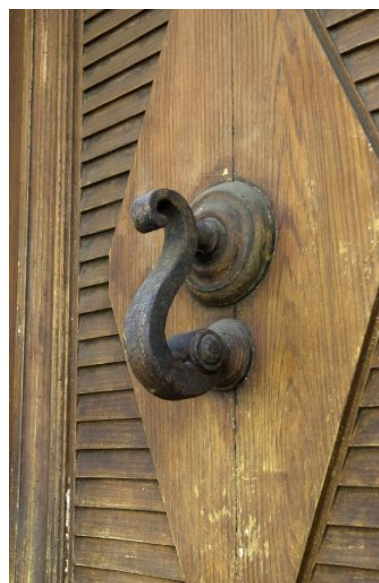
Porte, heurtoir IVR82_20036901394NUCA