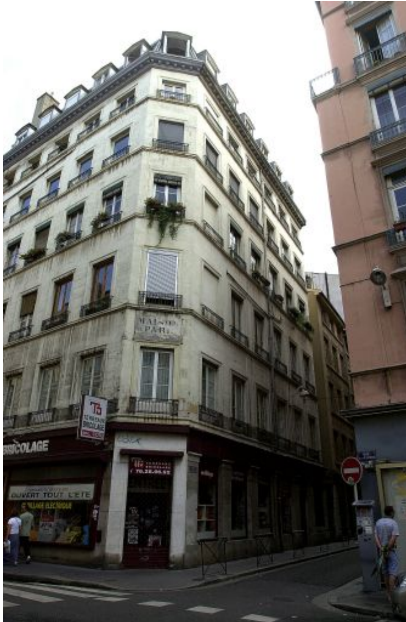
Angle à pan coupé et façade secondaire sur la rue Lanterne