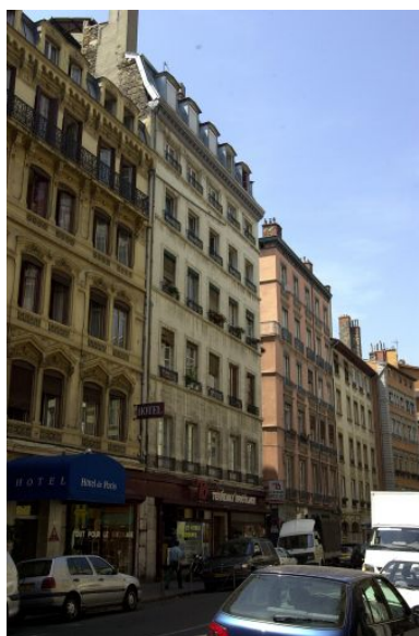
Façade principale, rue de la Platière