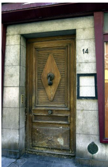
Façade principale, porte IVR82_20036901393NUCA