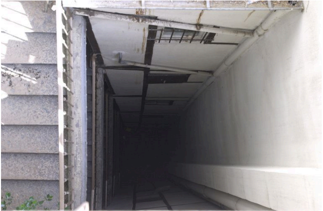
Cour, vue du haut de l'escalier