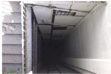
Cour, vue du haut de l'escalier IVR82_20036901399NUCA