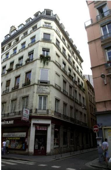
Angle à pan coupé et façade secondaire sur la rue Lanterne IVR82_20036901395NUCA