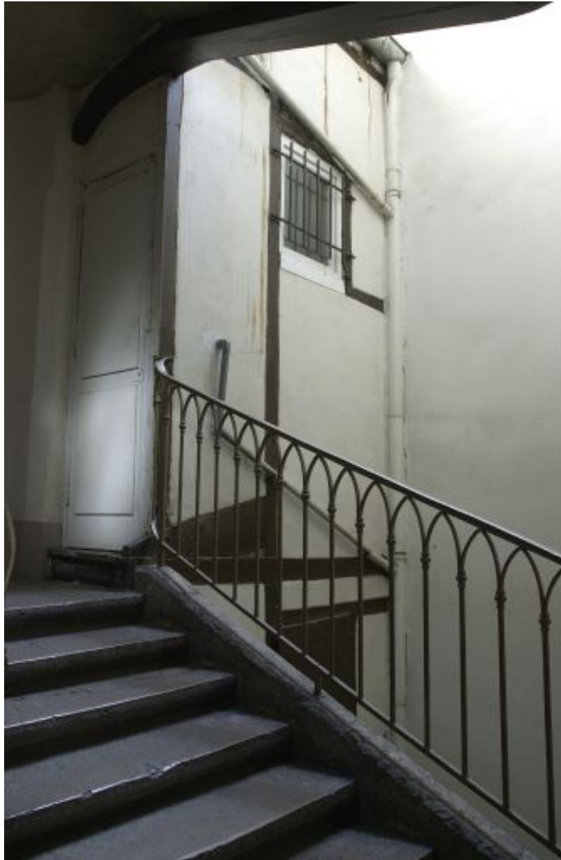
Quatrième étage de l'escalier, accès aux lieux d'aisance