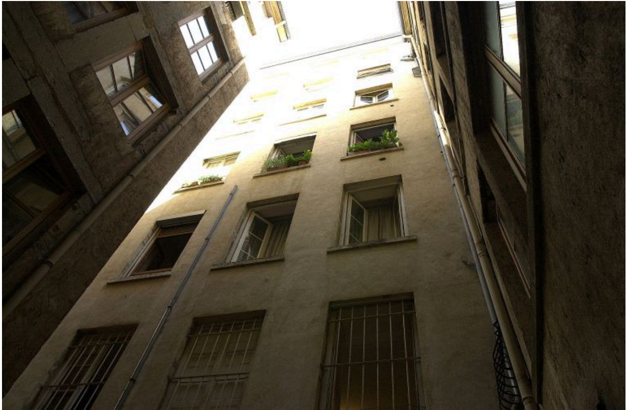
Façade sur l'impasse Charbonnier