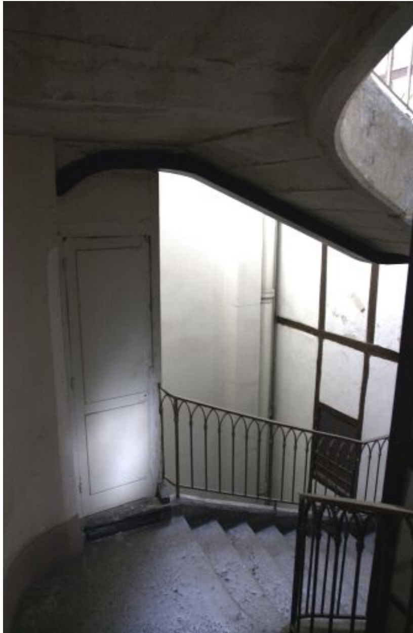
Escalier, quatrième étage, détail d'un repos