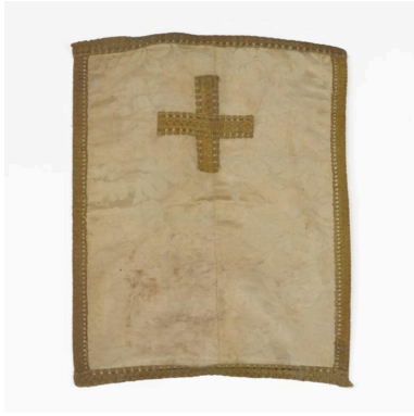
Vue générale. IVR83_20136300401NUC4A