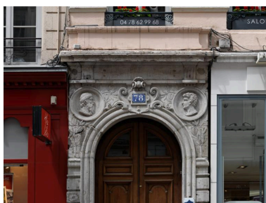
Détail de la partie supérieure IVR82_20126901534NUCA