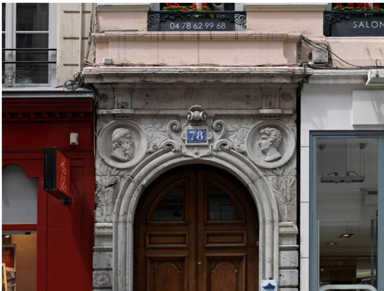
Détail de la partie supérieure