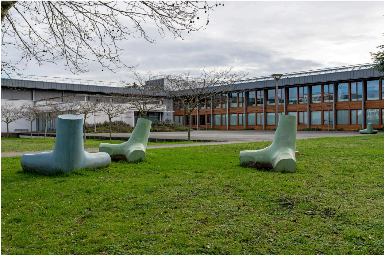
Quelques moulages, dans leur environnement.