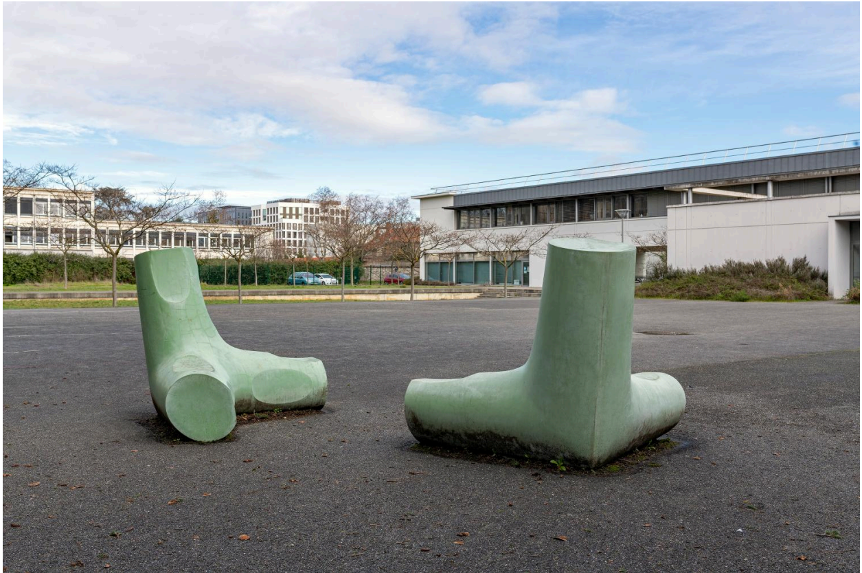
Deux moulages, vue rapprochée.