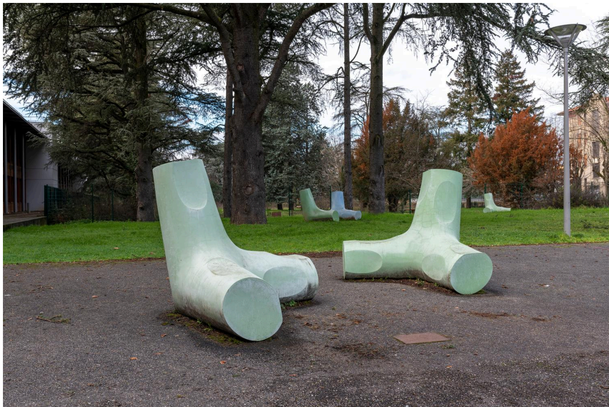
Quelques moulages, dans leur environnement.