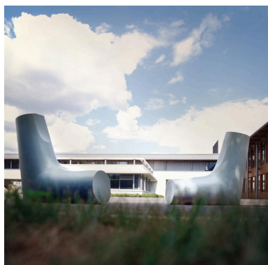
Modules, perspective vers le lycée.