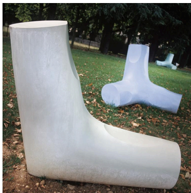
Modules en situation.