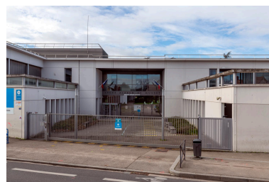
L'entrée du lycée, avec moulages en arrière plan.