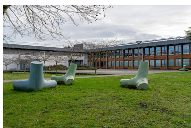
Quelques moulages, dans leur environnement.