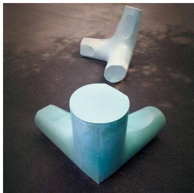
Deux modules en béton.