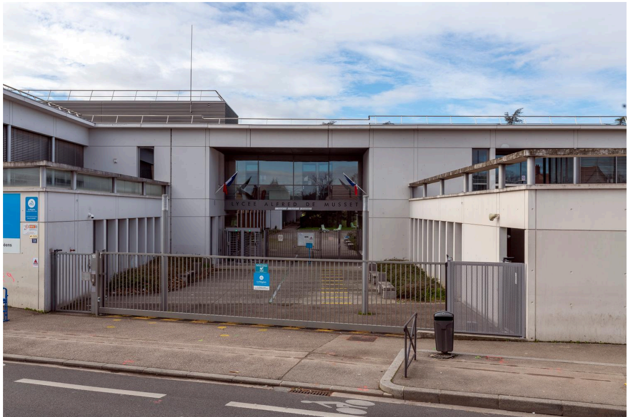
L'entrée du lycée, avec moulages en arrière plan.