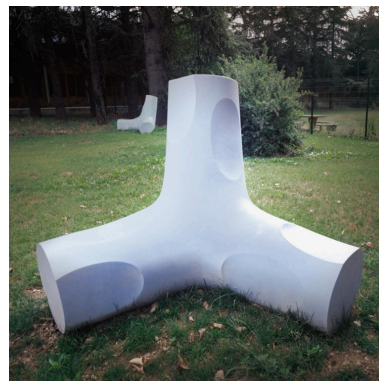
Modules en situation. IVR84_20206900683NUCAB