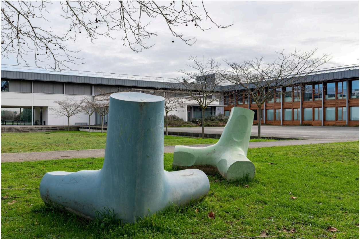
Deux moulages, vue rapprochée.