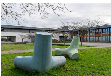
Deux moulages, vue rapprochée.