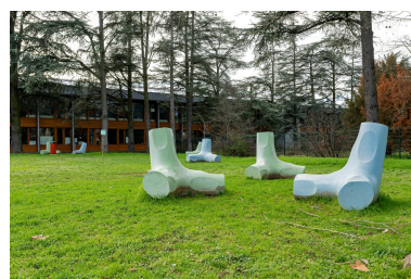
Quelques moulages, dans leur environnement. IVR84_20216900234NUCA