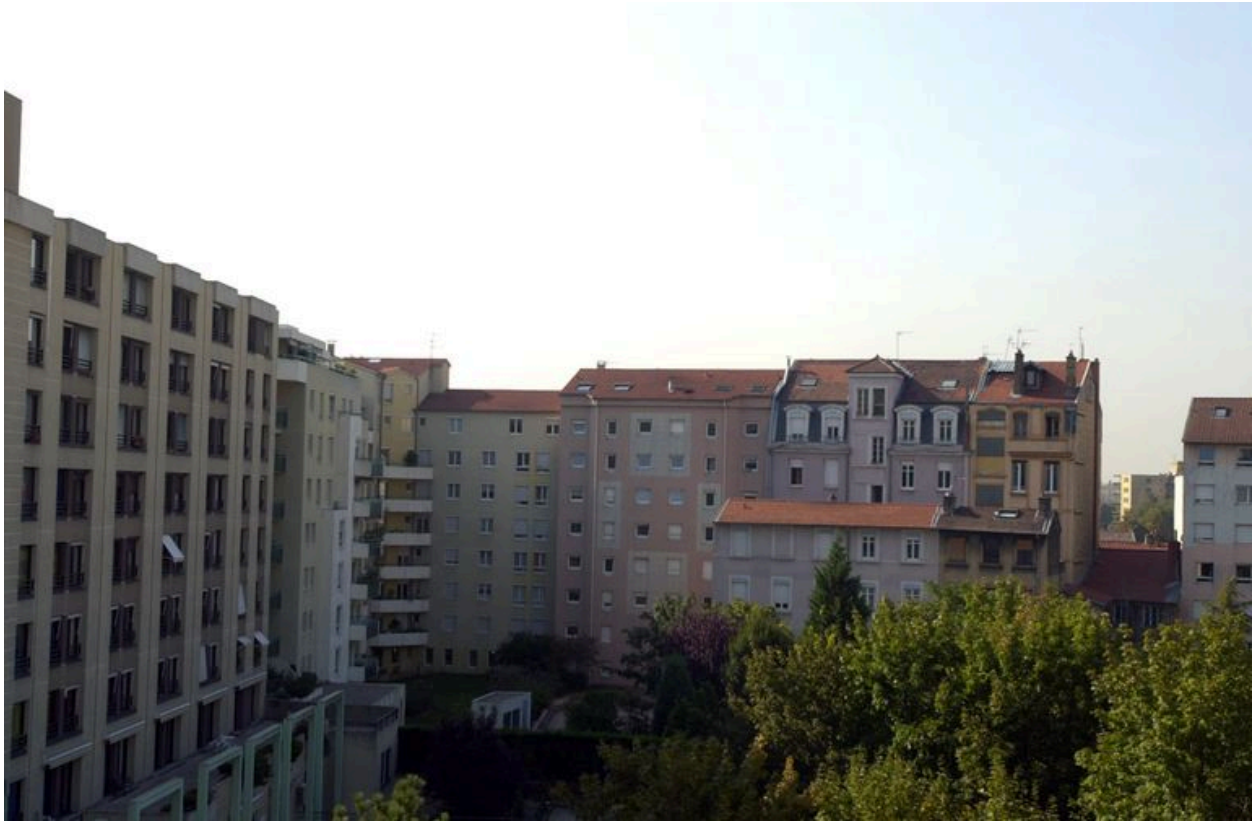
Élévation postérieure, depuis le nord