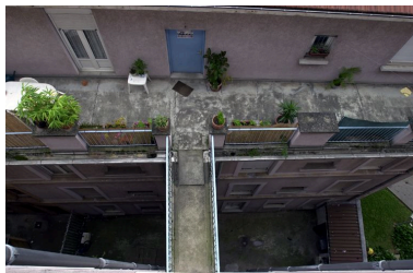
Vue d'ensemble depuis le haut IVR82_20096901384NUCA