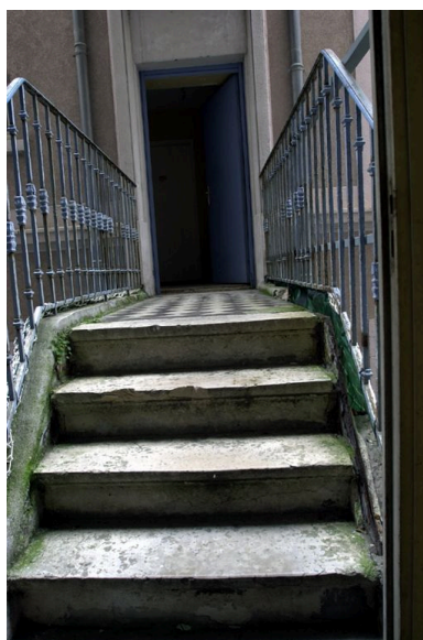
Passerelle desservant le 1er étage IVR82_20096901383NUCA