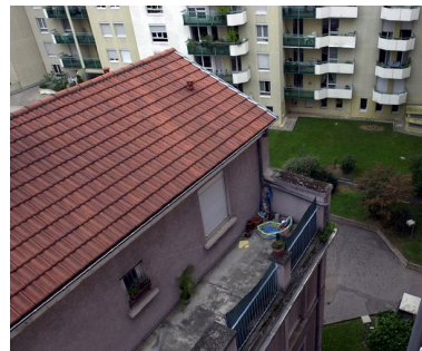
Vue partielle depuis le sud-ouest IVR82_20096901385NUCA