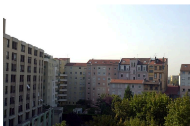
Elévation postérieure, depuis le nord IVR82_20096901395NUCA