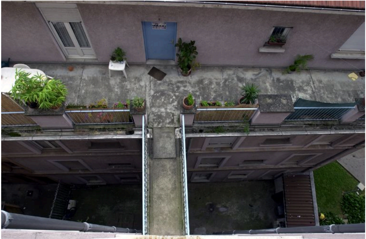
Vue d'ensemble depuis le haut