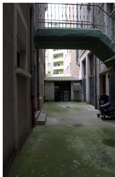
Vue de la cour depuis l'est IVR82_20096901390NUCA