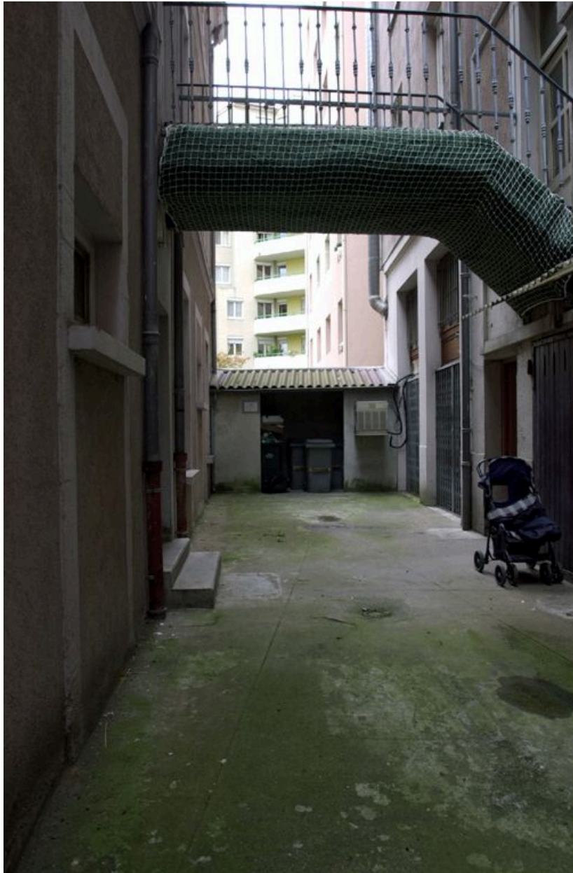
Vue de la cour depuis l'est