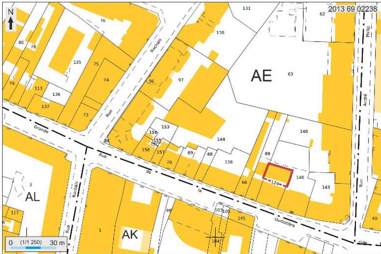
Plan masse et de situation