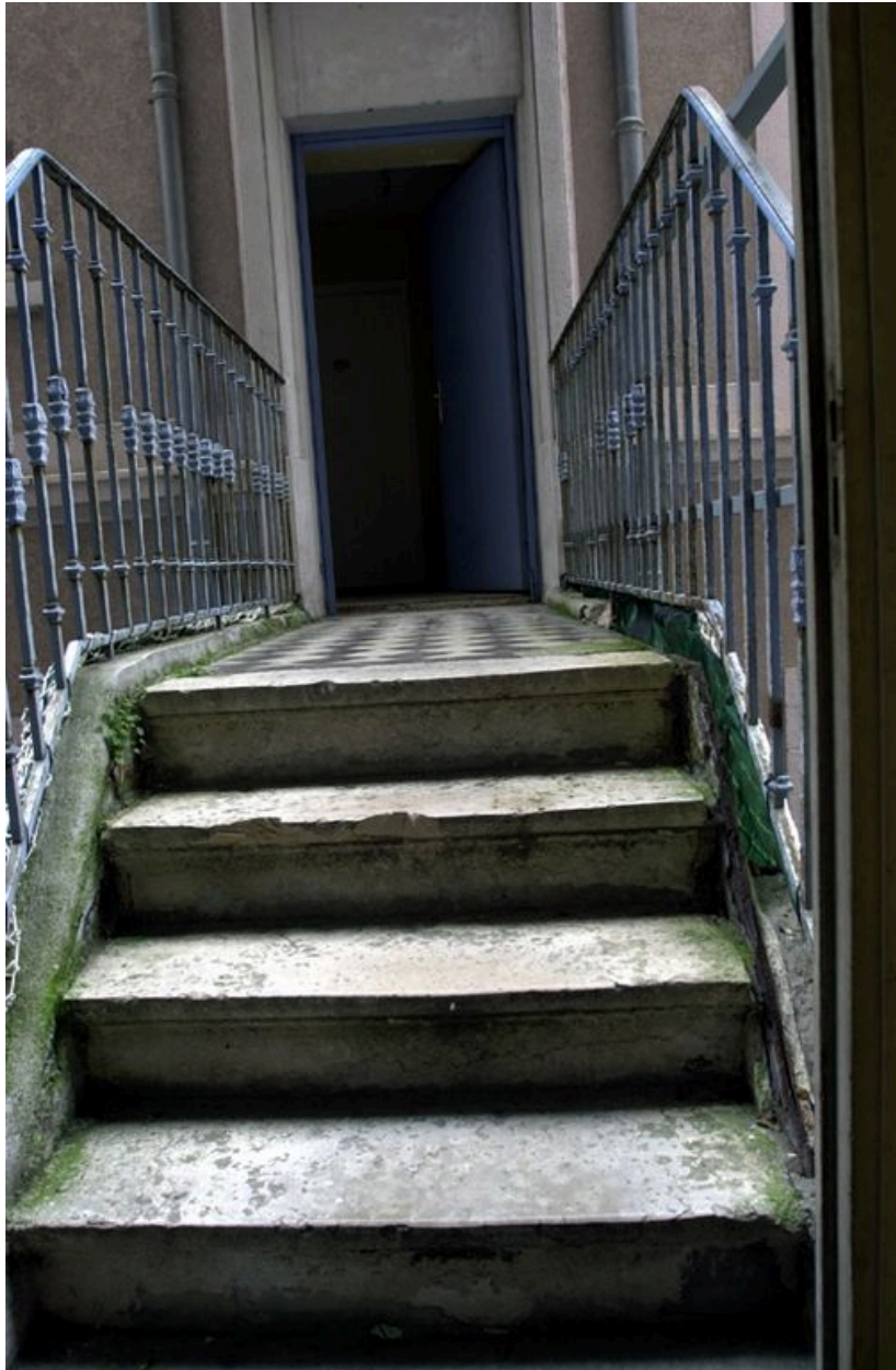
Passerelle desservant le 1er étage