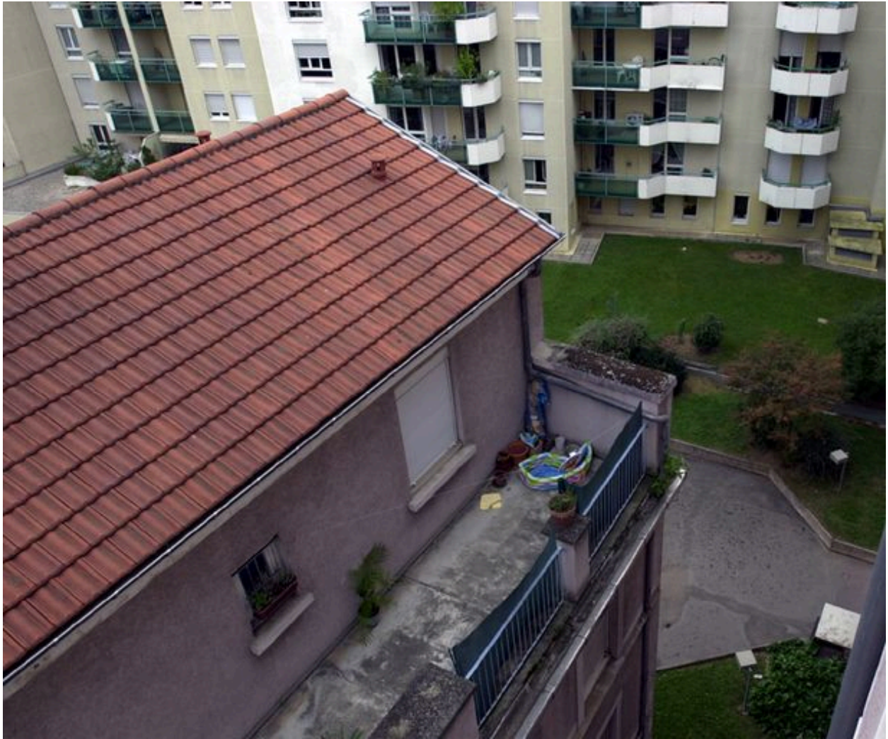
Vue partielle depuis le sud-ouest