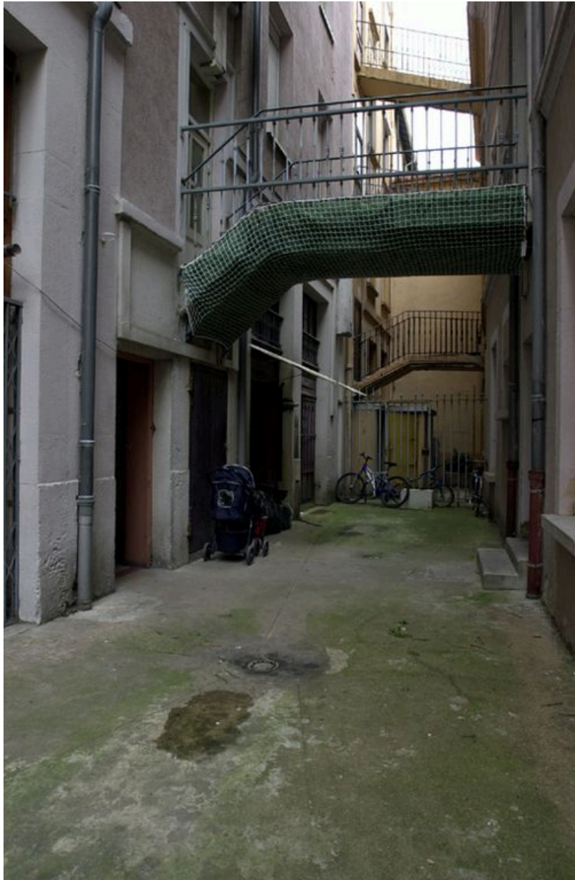
Vue de la cour depuis l'ouest