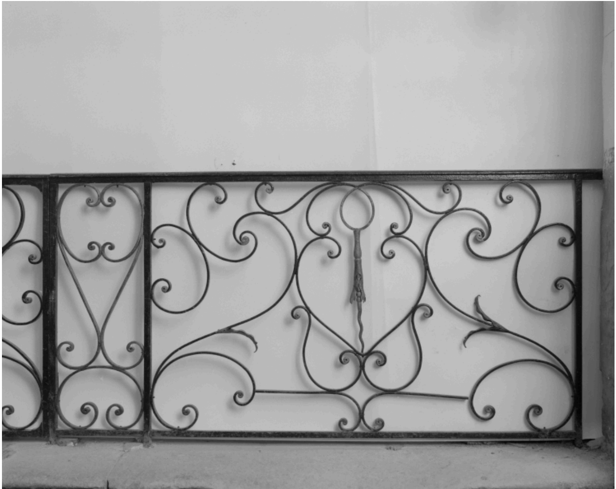
Vue partielle : panneau latéral droit.