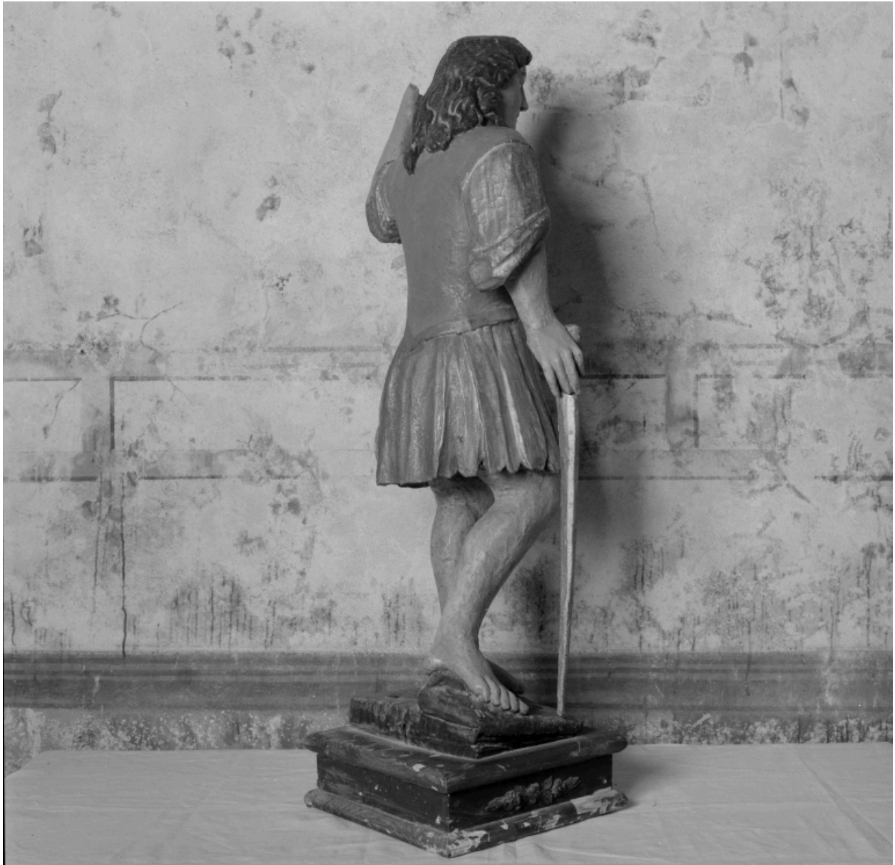
Vue de trois quarts, de dos.