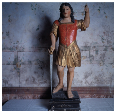
Vue d'ensemble, de face. IVR82_19992600535XA