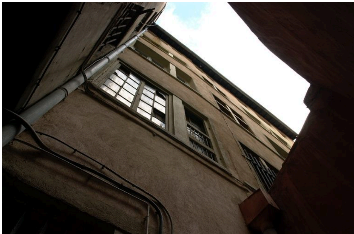
Vue générale depuis la cour