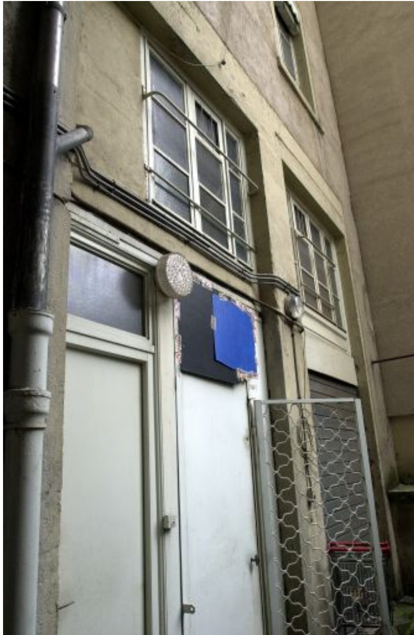
Détail des baies de l'entresol sur la cour