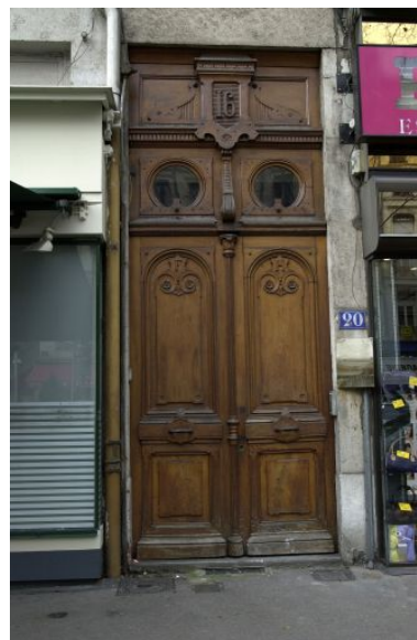
Huisserie de la porte d'entrée