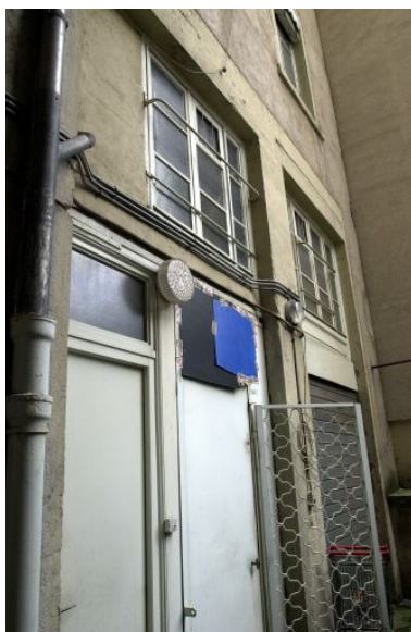
Détail des baies de l'entresol sur la cour IVR82_20016900267NUCA