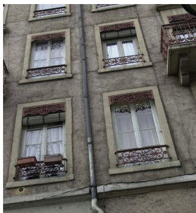
Détail des fenêtres : garde-corps et lambrequins IVR82_20016900265NUCA