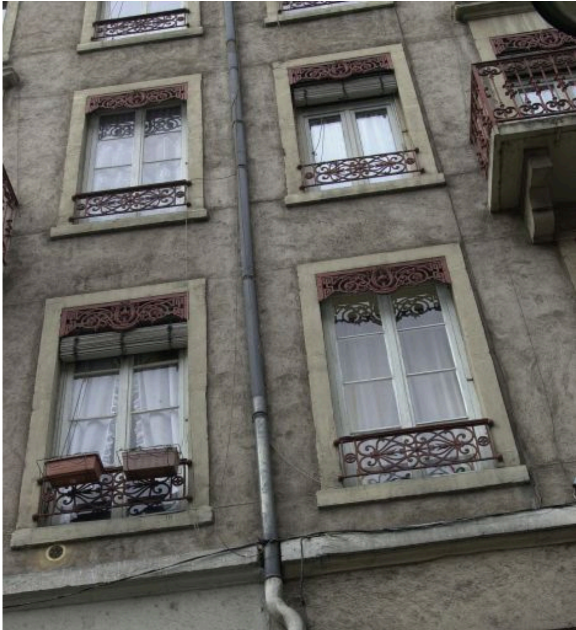
Détail des fenêtres : garde-corps et lambrequins