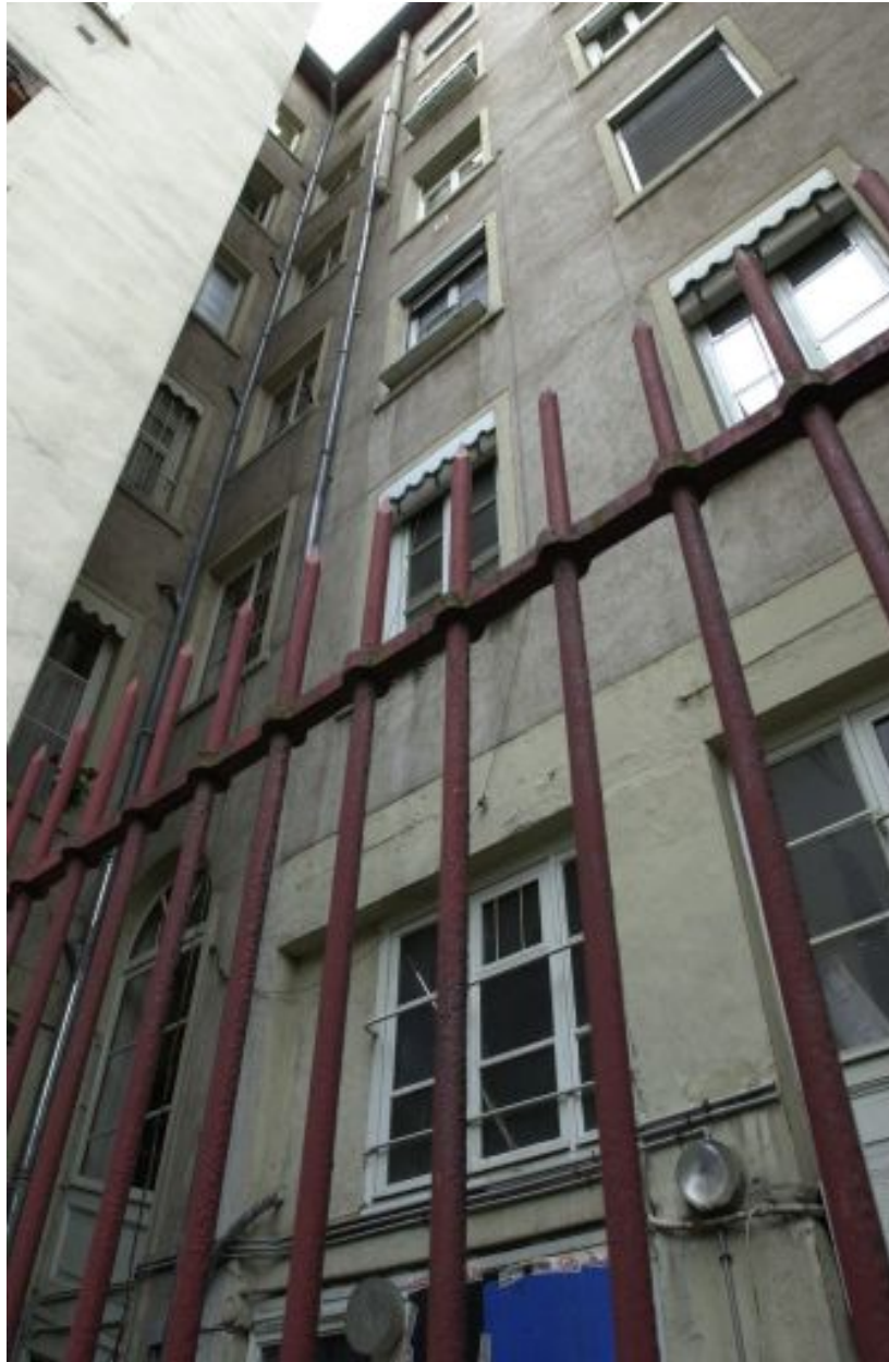
Elévations sur cour : la travée d'escalier à l'angle des deux corps de bâtiment