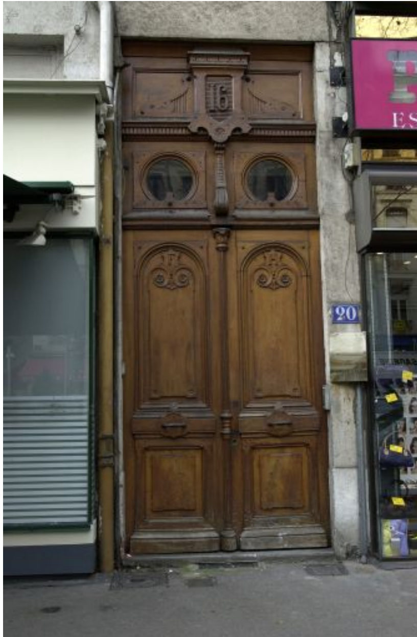
Huisserie de la porte d'entrée