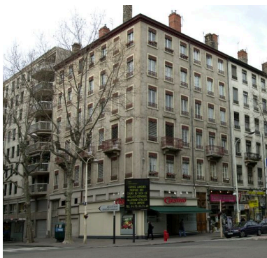
Vue d'ensemble depuis le sud-est IVR82_20016900264NUCA