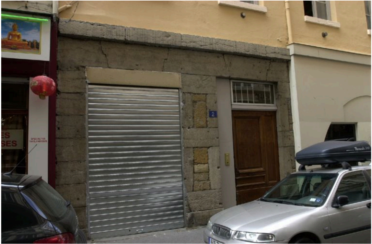
Façade principale rue de la Poulallerie, partie non transformée du 1er niveau et entrée