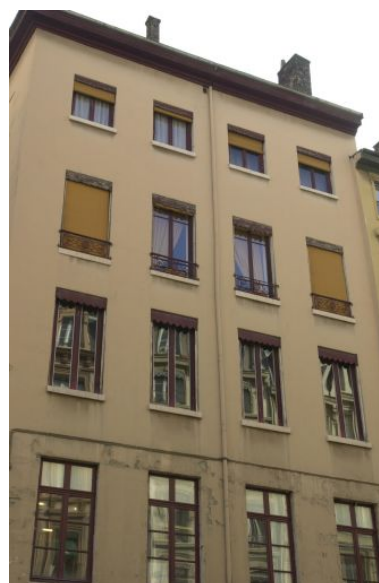
Façade rue de Brest, niveaux 2 à 5 IVR82_20036901103NUCA