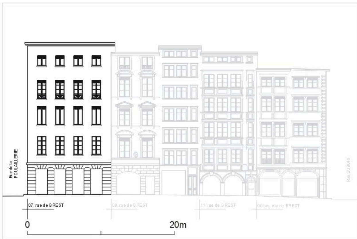
Elévation sur la rue de Brest, d'après un relevé photogrammétrique par A. Bensaci, 2003