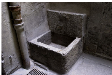
2e cour, fontaine IVR82_20046900775NUCA