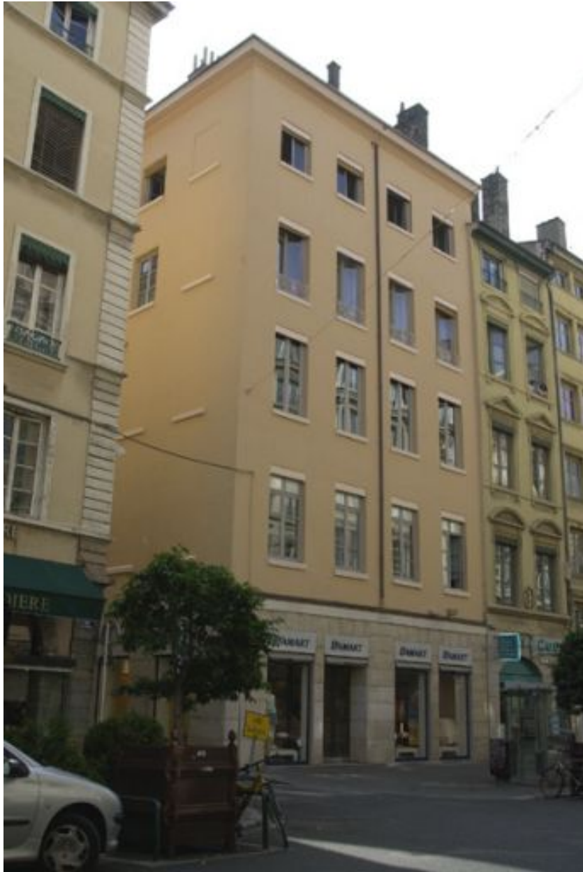
Façade rue de Brest, vue générale