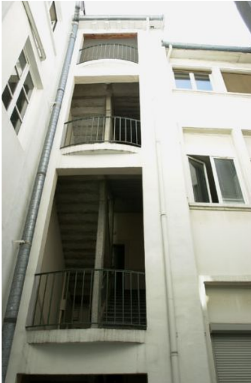
Façade de l'escalier dans la première cour, niveaux supérieurs