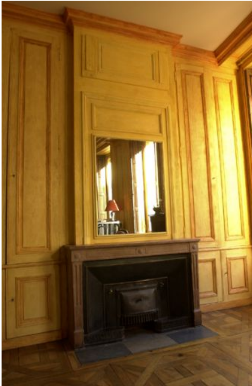
Cheminée et lambris d'un appartement du 2e étage