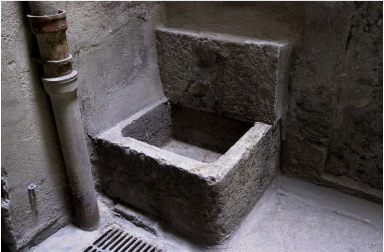
2e cour, fontaine