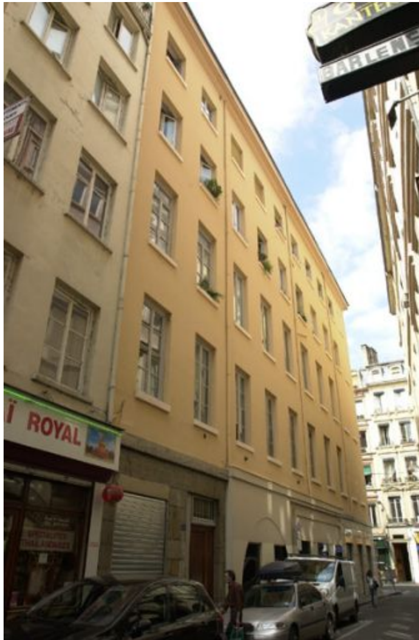
Façade principale rue de la Poulallerie