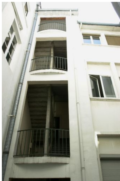
Façade de l'escalier dans la première cour, niveaux supérieurs