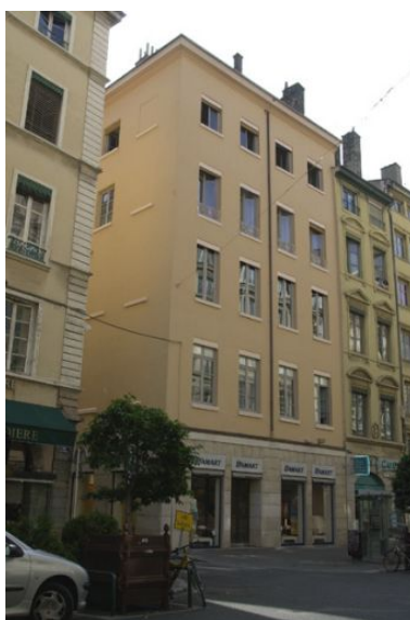
Façade rue de Brest, vue générale IVR82_20046900770NUCA