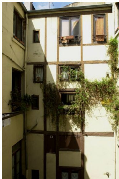
2e cour, élévation du corps des galeries de liaisons avec l'escalier IVR82_20046900774NUCA