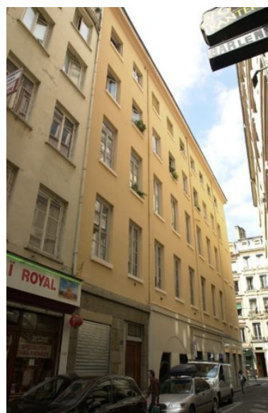
Façade principale rue de la Poulailleterie