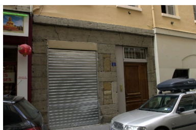
Façade principale rue de la Poulailleterie, partie non transformée du 1er niveau et entrée IVR82_20046900769NUCA