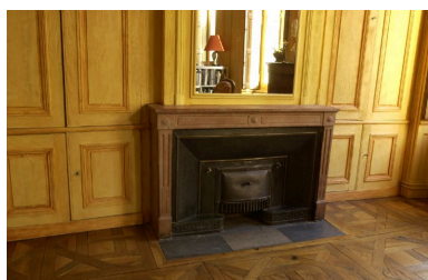
Cheminée dans un appartement du 2e étage IVR82_20046905903NUCA