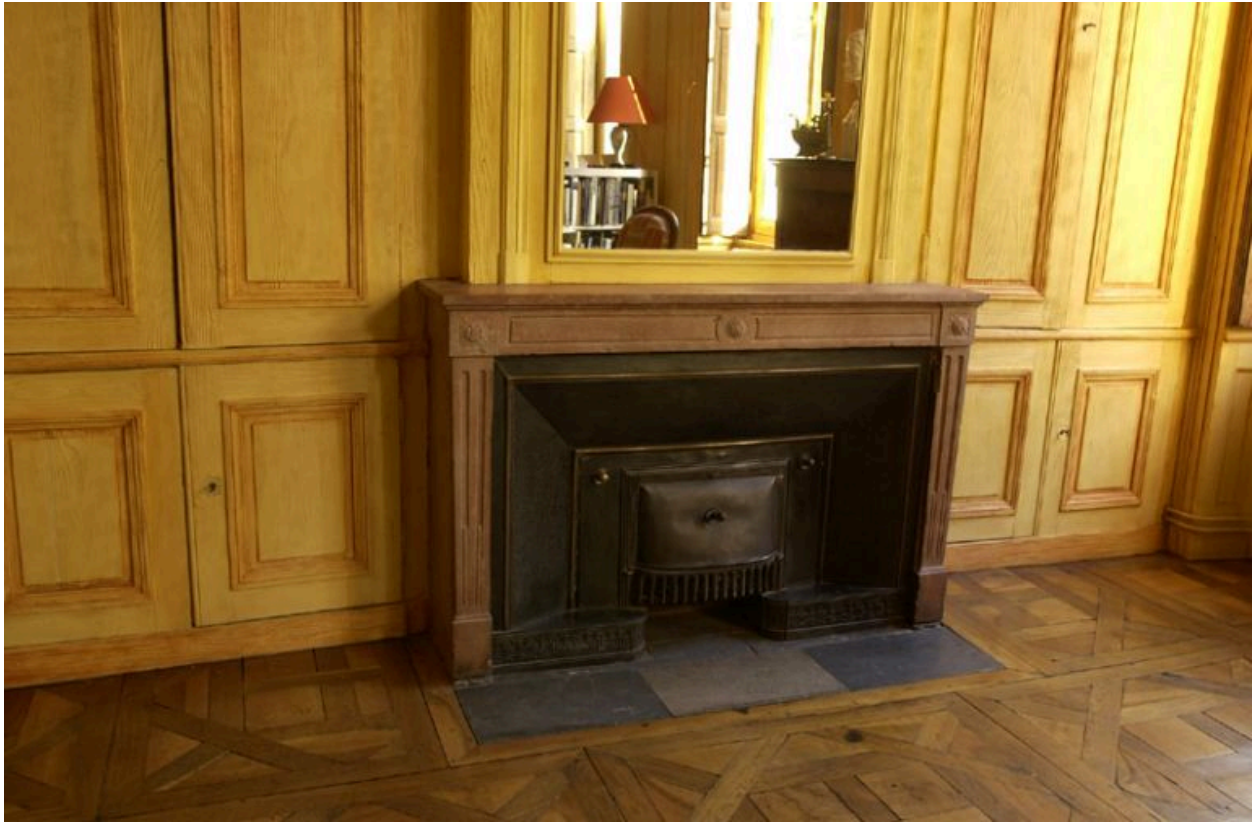
Cheminée dans un appartement du 2e étage