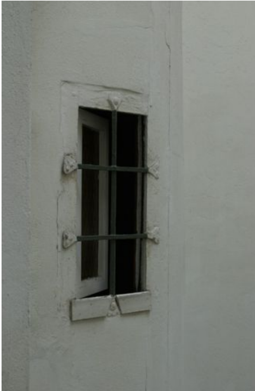
1ère cour, tourelle des lieux d'aisance, détail de la fenêtre du 2e étage