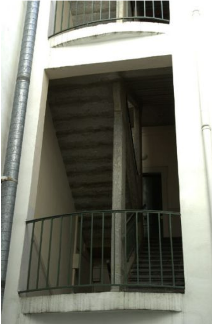
2e étage d'escalier et son ouverture sur la première cour