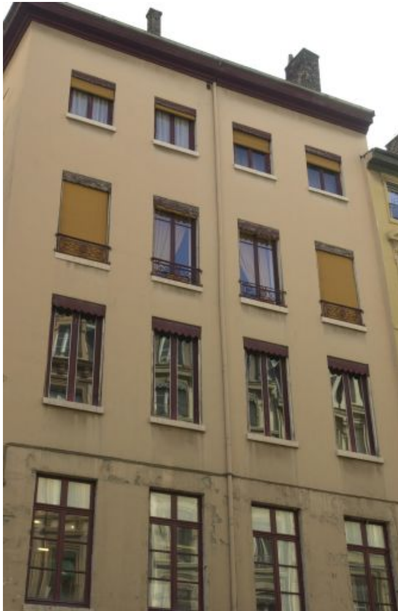
Façade rue de Brest, niveaux 2 à 5