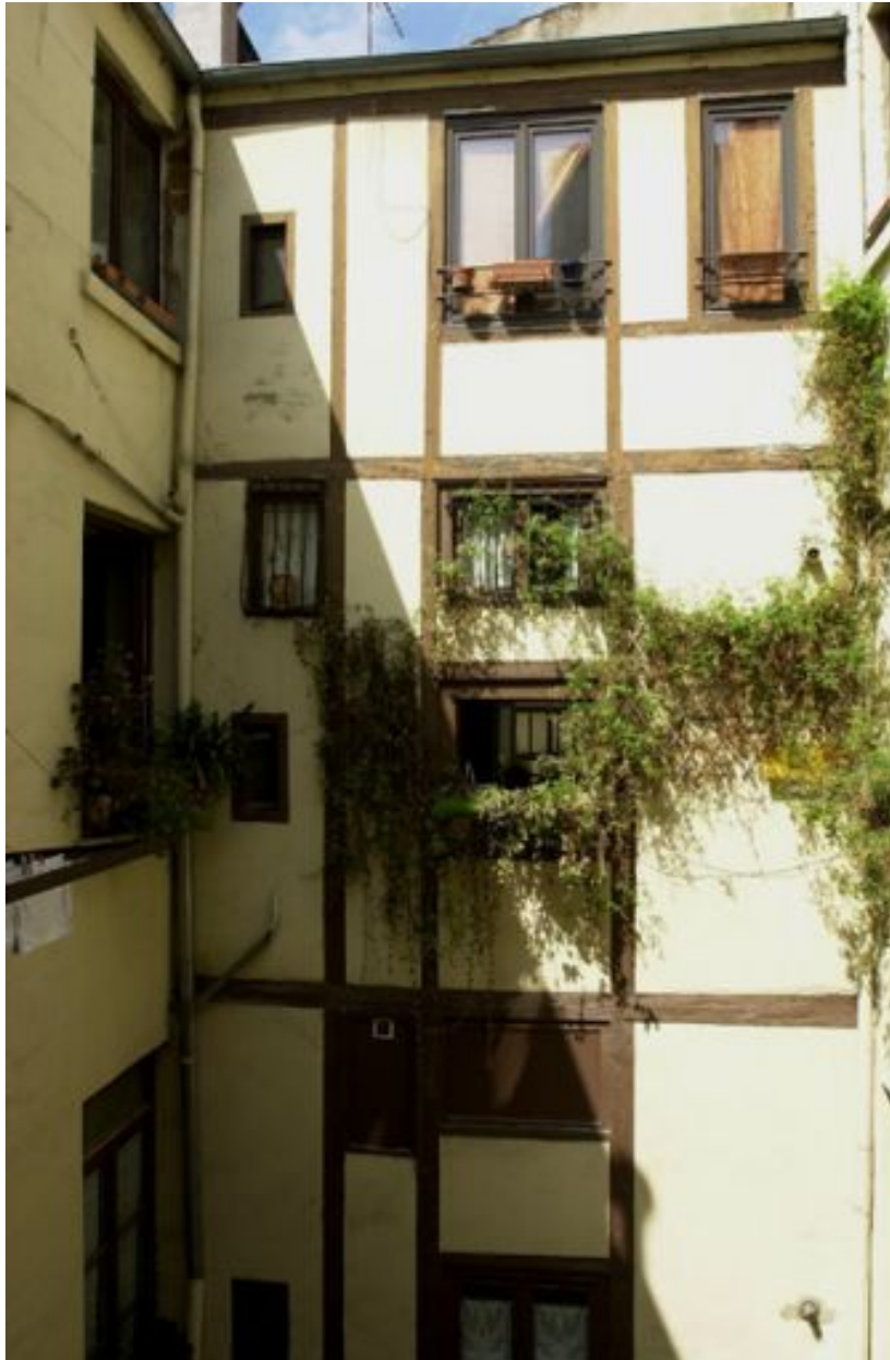
2e cour, élévation du corps des galeries de liaisons avec l'escalier