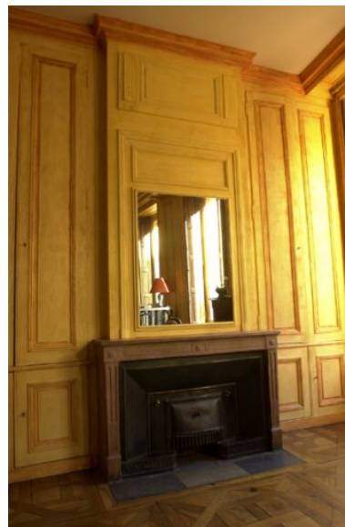
Cheminée et lambris d'un appartement du 2e étage IVR82_20046905902NUCA