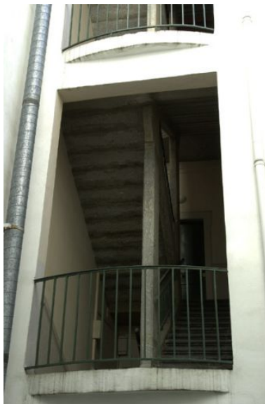
2e étage d'escalier et son ouverture sur la première cour IVR82_20046900772NUCA