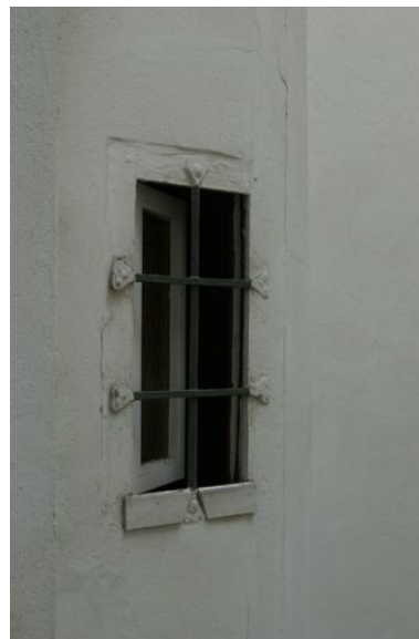
1ère cour, tourelle des lieux d'aisance, détail de la fenêtre du 2e étage IVR82_20046900773NUCA