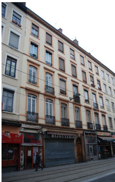
Vue générale, élévation sur rue IVR82_20136900054NUCA