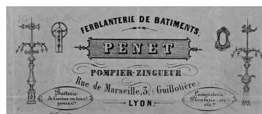
Papier à en-tête de la ferblanterie Penet, située 3 rue de Marseille en 1867 (Archives de l'archidiocèse de Lyon, I 1208). IVR82_20126905025NUC