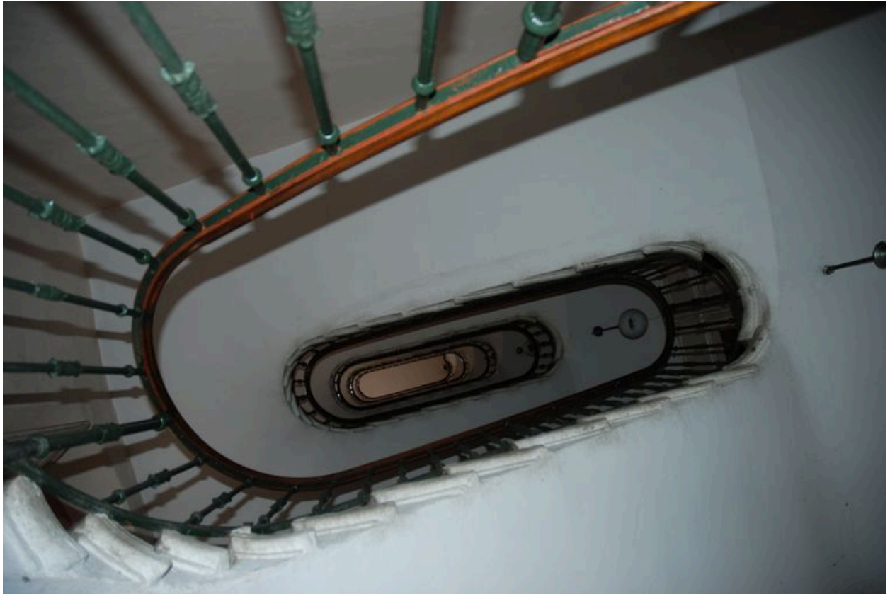
Vue intérieure, l'escalier vu en contre-plongée