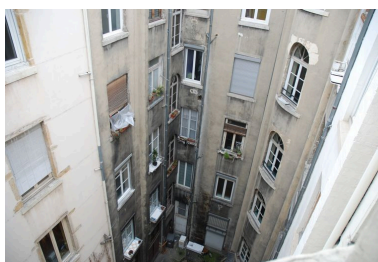
Vue partielle de l'élévation postérieure, occultée à mi-façade par le retour postérieur du 4 rue Béchevelin IVR82_20136900018NUCA