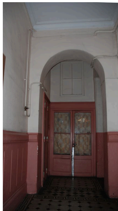
Vue intérieure : entrée de la loge de concierge, au rez-de-chaussée