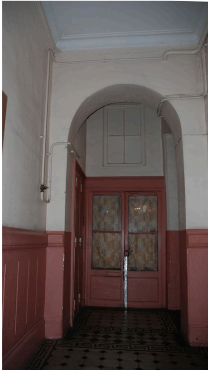
Vue intérieure : entrée de la loge de concierge, au rez-de-chaussée