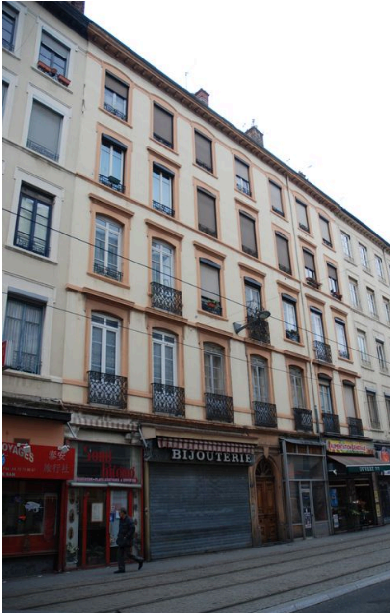
Vue générale, élévation sur rue