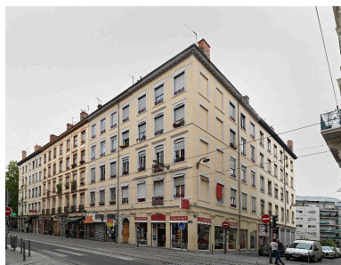
Vue de situation au sein de l'îlot, façades composées en miroir IVR84_20166901454NUCA