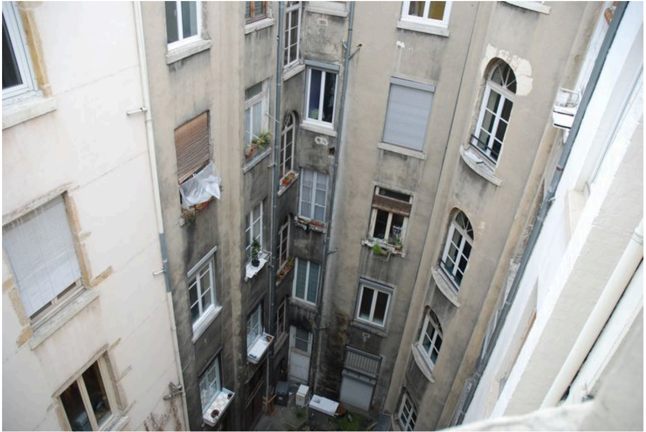
Vue partielle de l'élévation postérieure, occultée à mi-façade par le retour postérieur du 4 rue Béchevelin