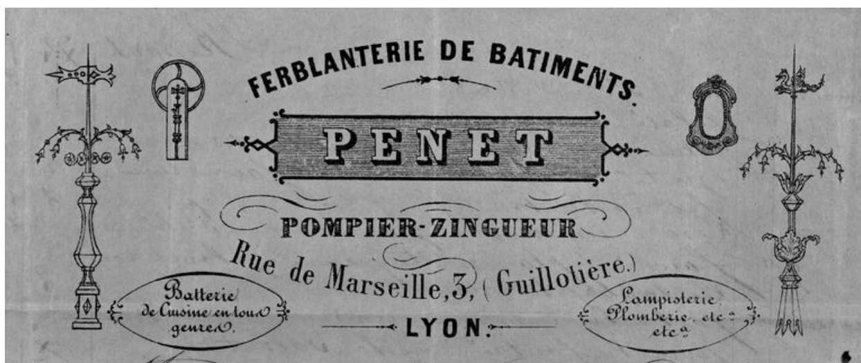
Papier à en-tête de la ferblanterie Penet, située 3 rue de Marseille en 1867.