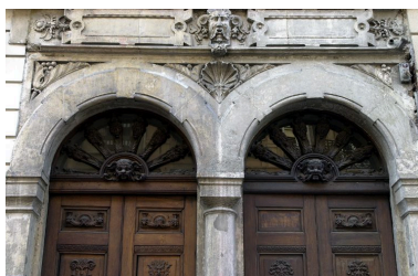
Les tympans