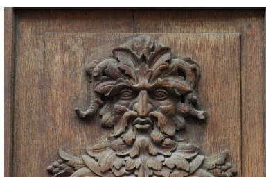
Vantail gauche de la porte du n° 58 : détail de la tête IVR82_20046905338NUCA