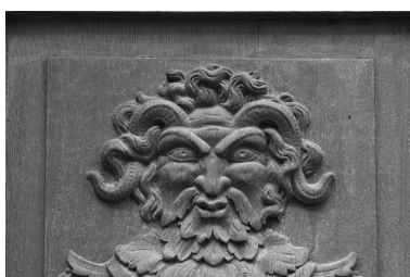
Vantail droit de la porte du n° 58 : détail de la tête