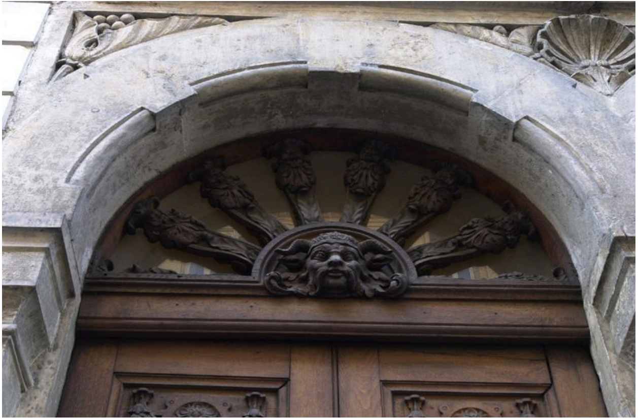
Le tympan du n°60