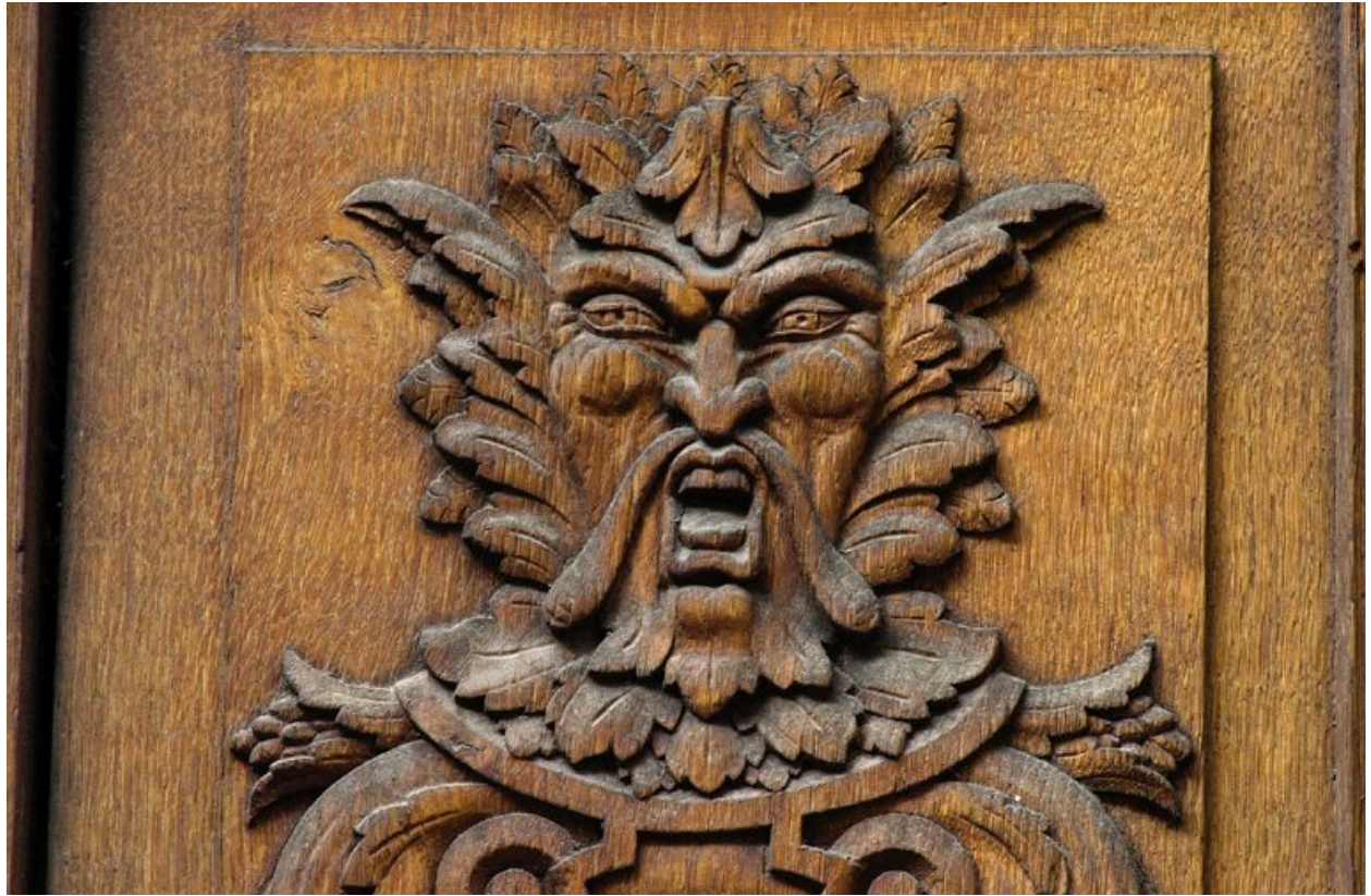
Vantail droit de la porte du n°60 : détail de la tête