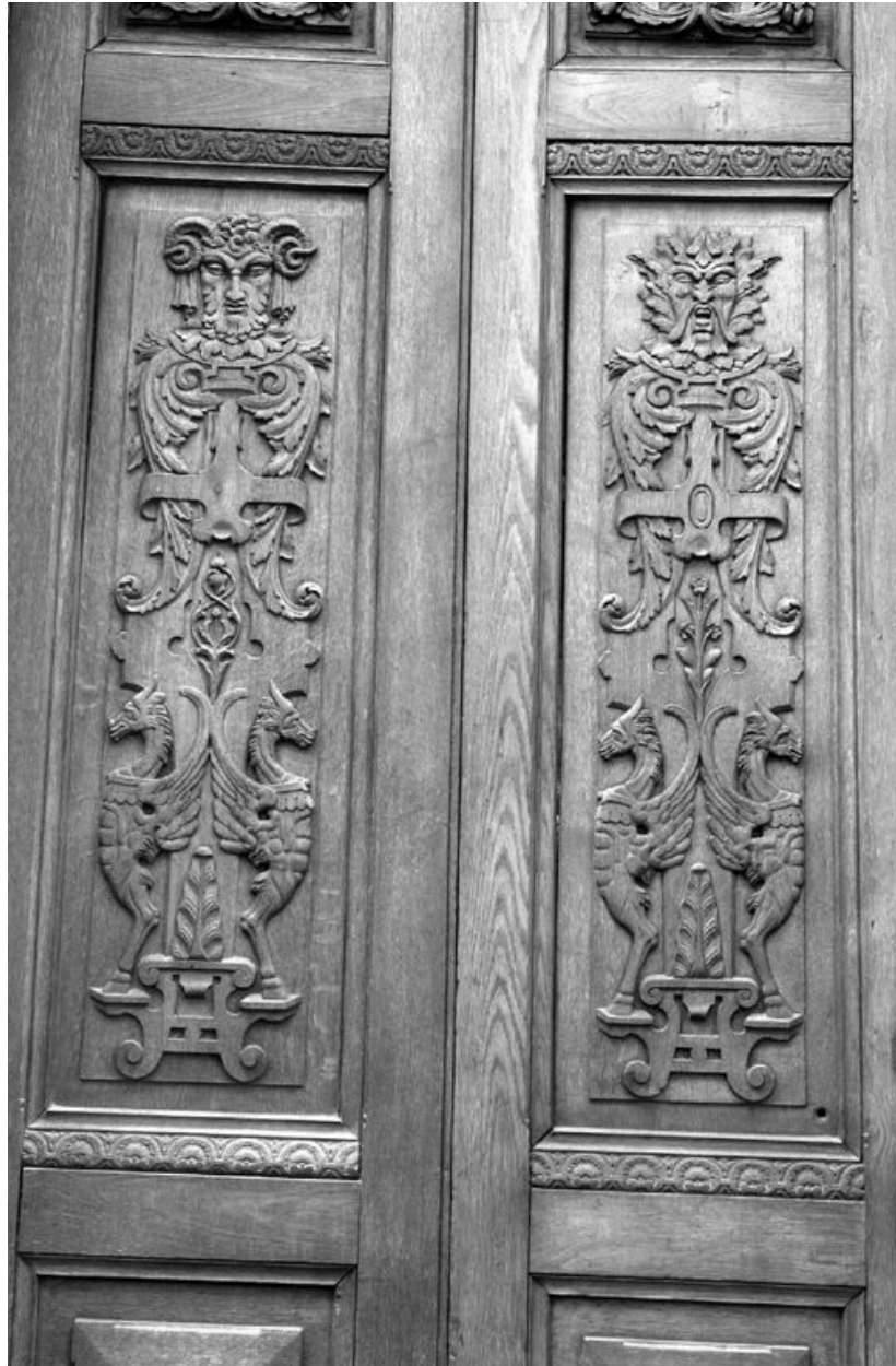
Les vantaux de l'immeuble sis au n°60