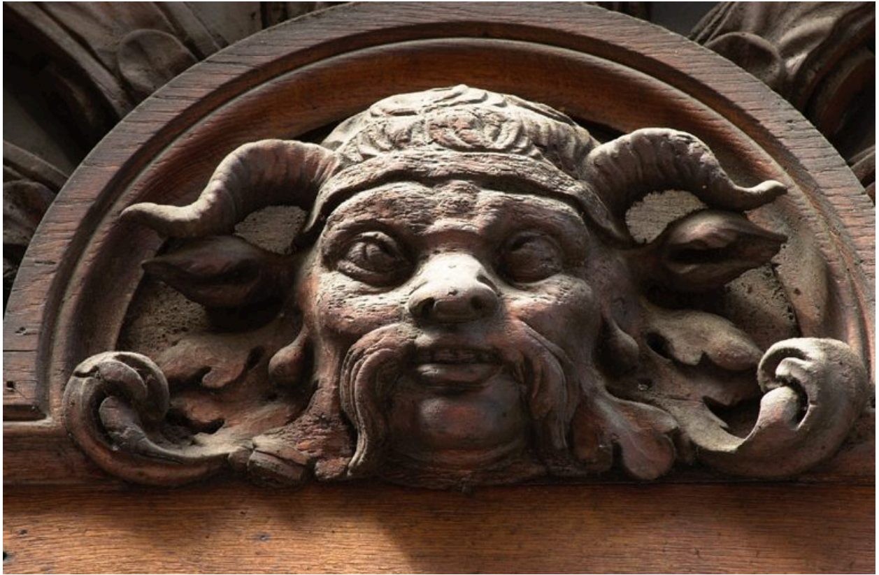
Tympan du n°60 : détail de la tête