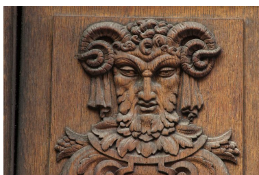
Vantail gauche de la porte n° 60 : détail de la tête IVR82_20046905336NUCA