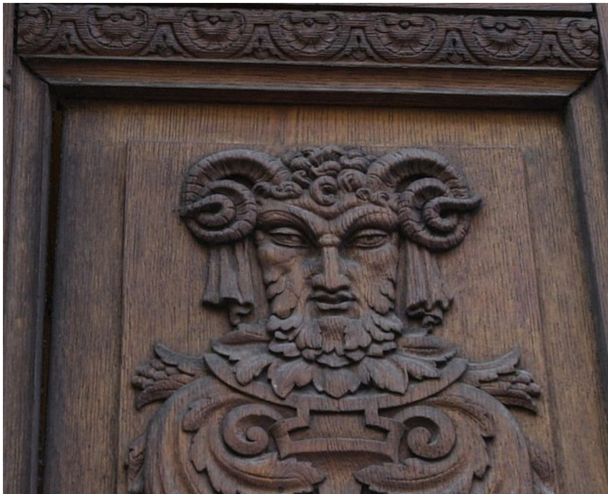
Vantail gauche de la porte du n° 60 : détail du buste