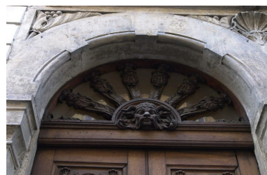
Le tympan du n°60