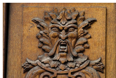
Vantail droit de la porte du n°60 : détail de la tête