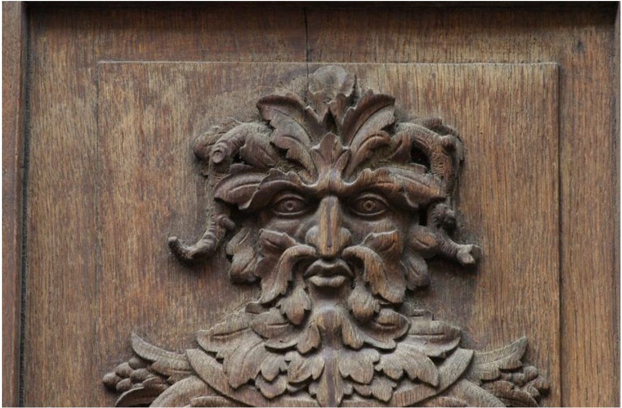
Vantail gauche de la porte du n° 58 : détail de la tête