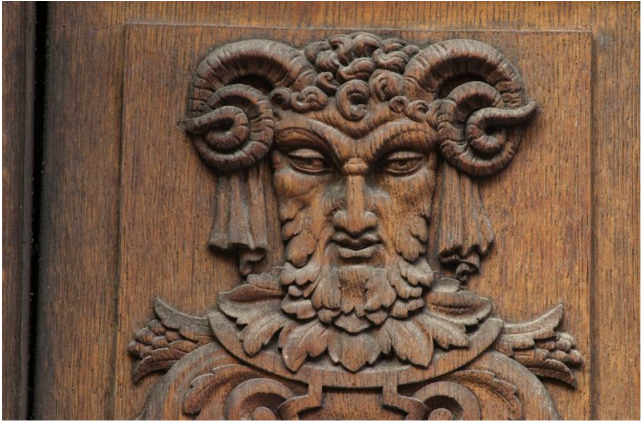
Vantail gauche de la porte n° 60 : détail de la tête