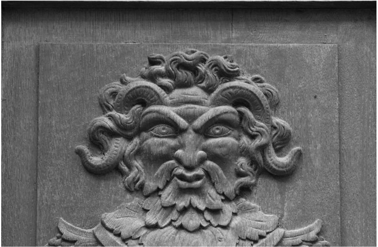
Vantail droit de la porte du n° 58 : détail de la tête