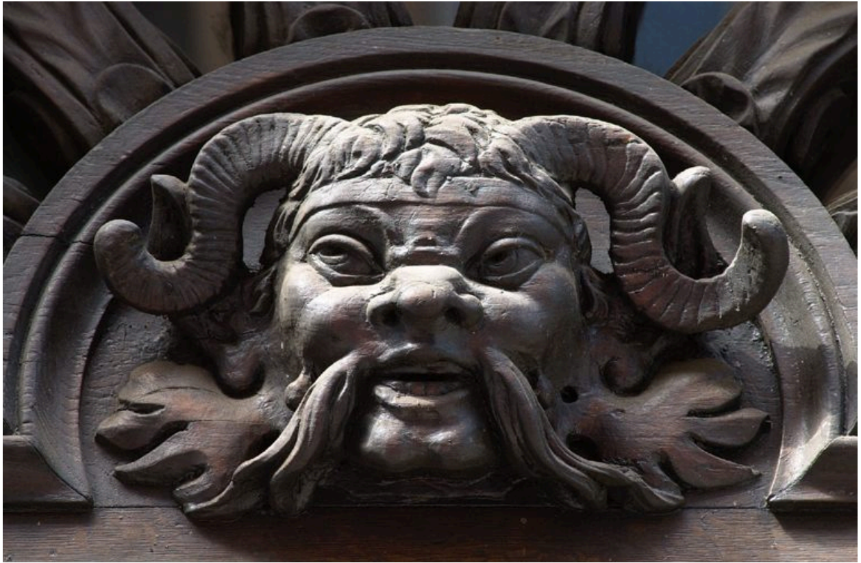
Tympan du n° 58 : détail de la tête