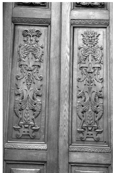
Les vantaux de l'immeuble sis au n°60