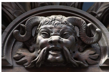
Tympan du n° 58 : détail de la tête