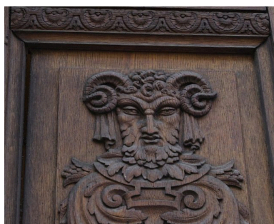
Vantail gauche de la porte du n° 60 : détail du buste